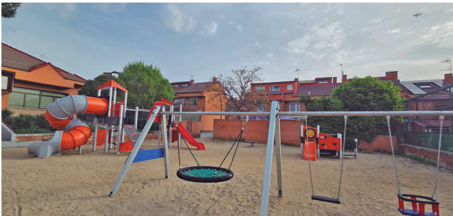
Nuevas estructuras de juego activo en espacios infantiles renovados AYUNTAMIENTO DE GETAFE

Getafe quiere conocer en esa reunión los planes de movilidad y seguridad que el Ayuntamiento de Madrid "no facilita", así como trasladar a los organizadores el "grave malestar y el impacto directo que este macroevento causará en el día a día de decenas de miles de getafenses". Desde Getafe insisten en que se asiste "con profunda preocupación a una realidad en la que cada día se anuncian nuevos conciertos sin que la ciudad tenga absolutamente ninguna información previa".