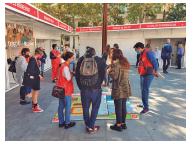
Semana de la Salud en años anteriores

Hasta el 14 de abril, el programa incluye pruebas gratuitas de audición, glucosa, tensión arterial y test rápidos de VIH, además de asesoramiento sobre hábitos saludables, autismo o fibromialgia, junto a talleres de RCP e higiene postural. La programación se completa, además, con diversas conferencias sobre la prevención del cáncer de colon en la Fábrica de Harinas y talleres de testamento vital en el Centro Manuel Cortés Casas.