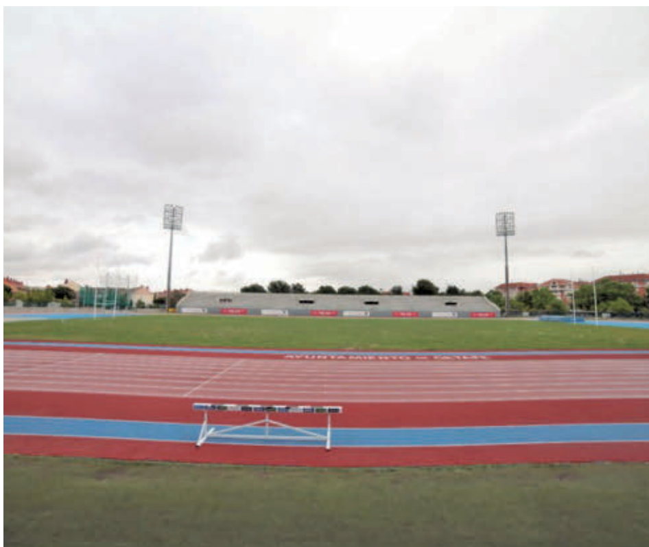
Instalaciones deportivas municipales AYUNTAMIENTO DE GETAFE