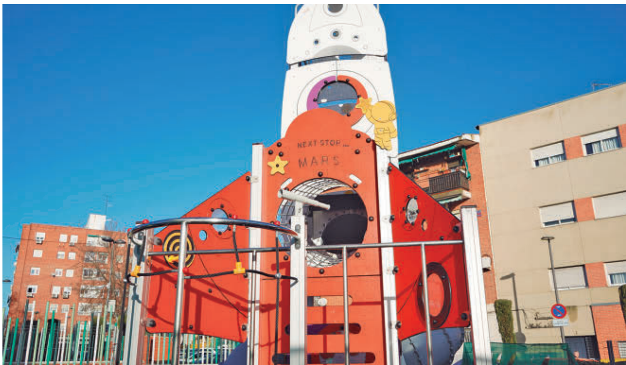
AYTO DE GETAFE