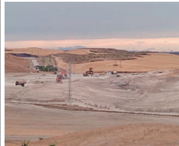
Vertedero de Pinto PLATAFORMA POR EL CIERRE DEL VERTEDERO DE PINTO