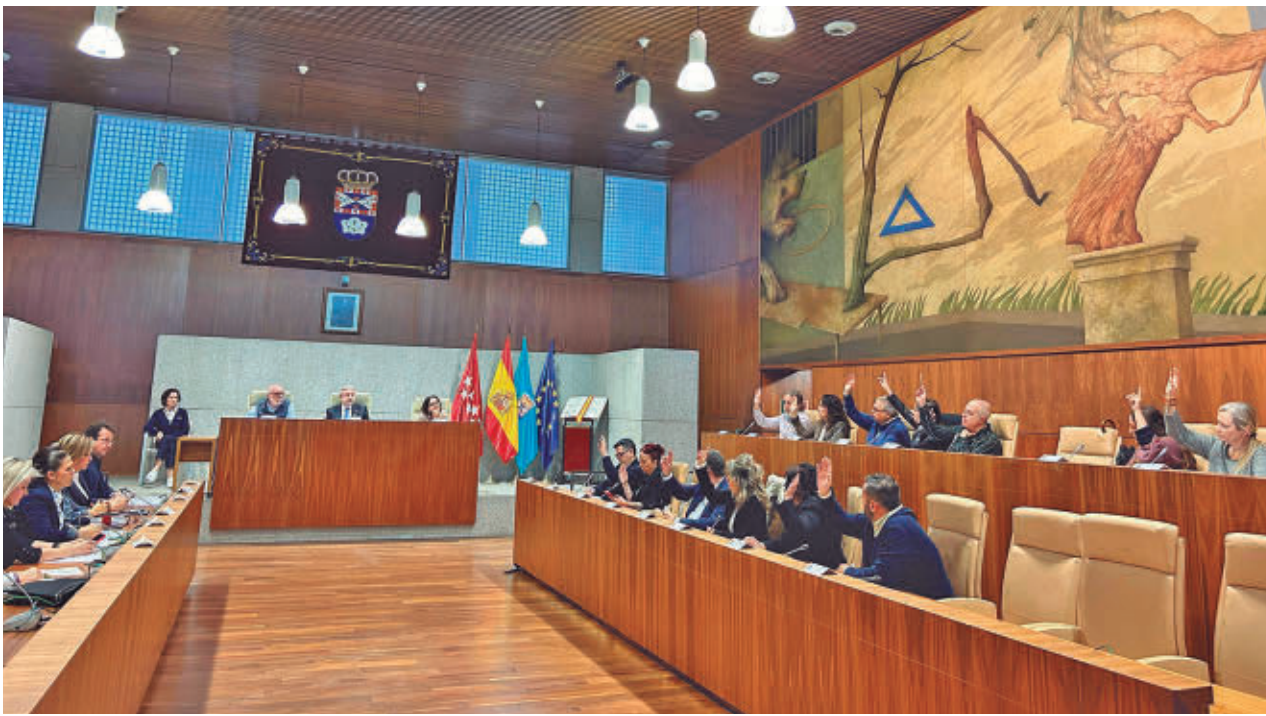
Sesión plenaria en el Ayuntamiento de Leganés