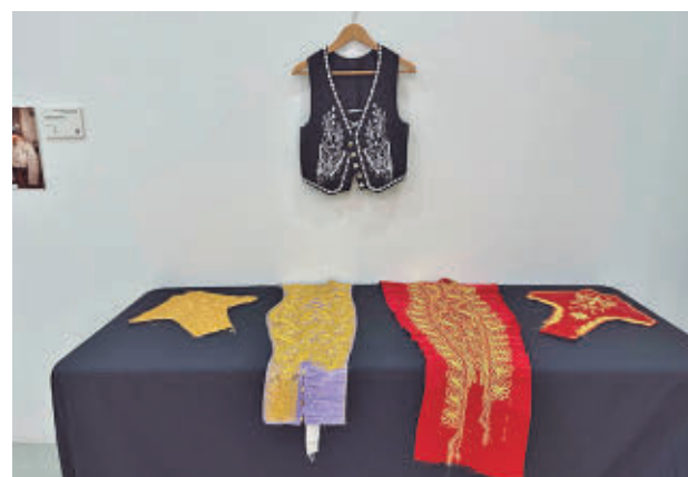
Otros de los objetos de la exposición

GenteMadrid.es Consulte la actualidad regional y local en nuestra página web