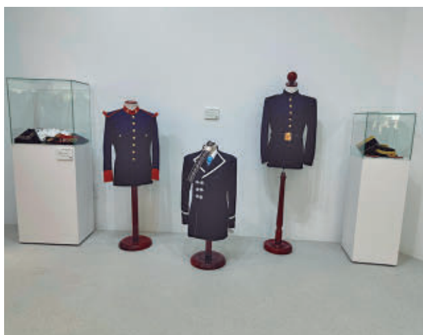
Algunas de las prendas de Militanza

nes al rescate de la artesanía: Con el corazón en el oficio' reúne una selección de trabajos realizados a mano por artistas y creadores del municipio. Puede visitarse hasta este domingo 12 de abril en la Sala