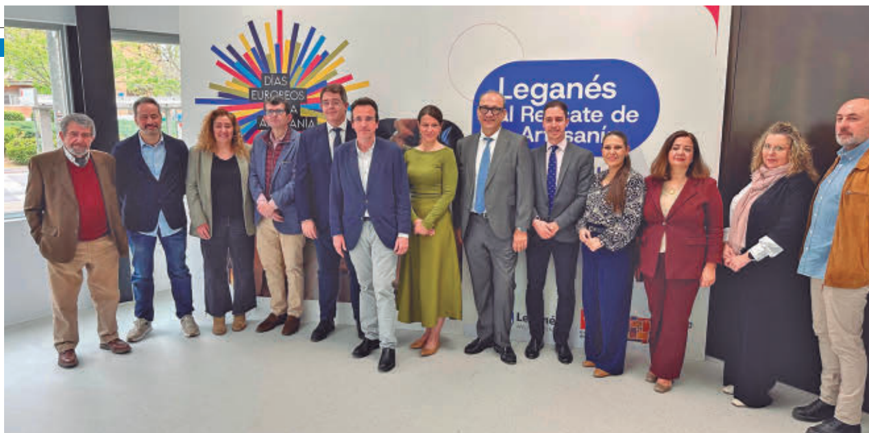
Acto de inauguración de la muestra

Leganés celebra hasta el domingo 12 los Días Europeos de la Artesanía con una exposición de creadores locales que se podrá visitar en la Biblioteca Central