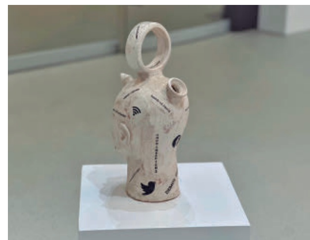
Botijo de cerámica de José J. Marín

En esta III edición se quiere apostar por visibilizar el talento local a través de una propuesta centrada en la exposición colectiva. Entre otros, participan Mayo, taller de arte con más de 40 años de trayectoria dedicado a la escultura, la imaginaria y el arte belenístico; Militanza, una firma creada en 2021 especia-