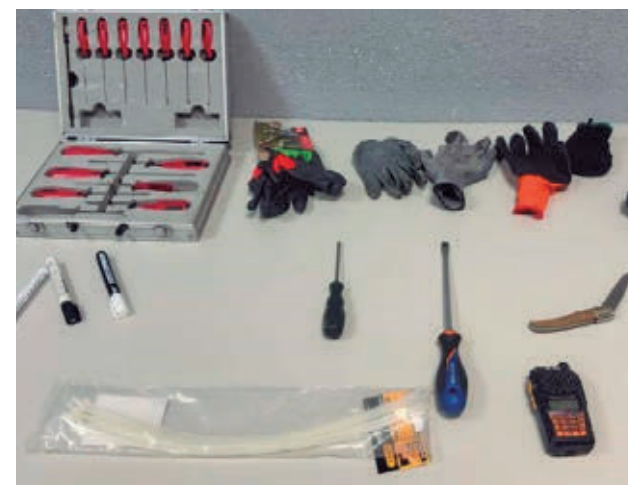
Material incautado a los detenidos POLICÍA NACIONAL

Los agentes recibieron un vídeo y realizaron una investigación que les permitió localizar el piso, situado en las inmediaciones del parque Pablo Picasso. Fueron detenidos una mujer y un hombre españoles, un hombre colombiano y dos hermanos húngaros.