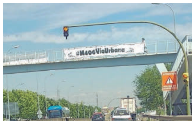
Carretera M-406 a su paso por Leganés E. P.

La actuación se realizaría en el tramo que transcurre