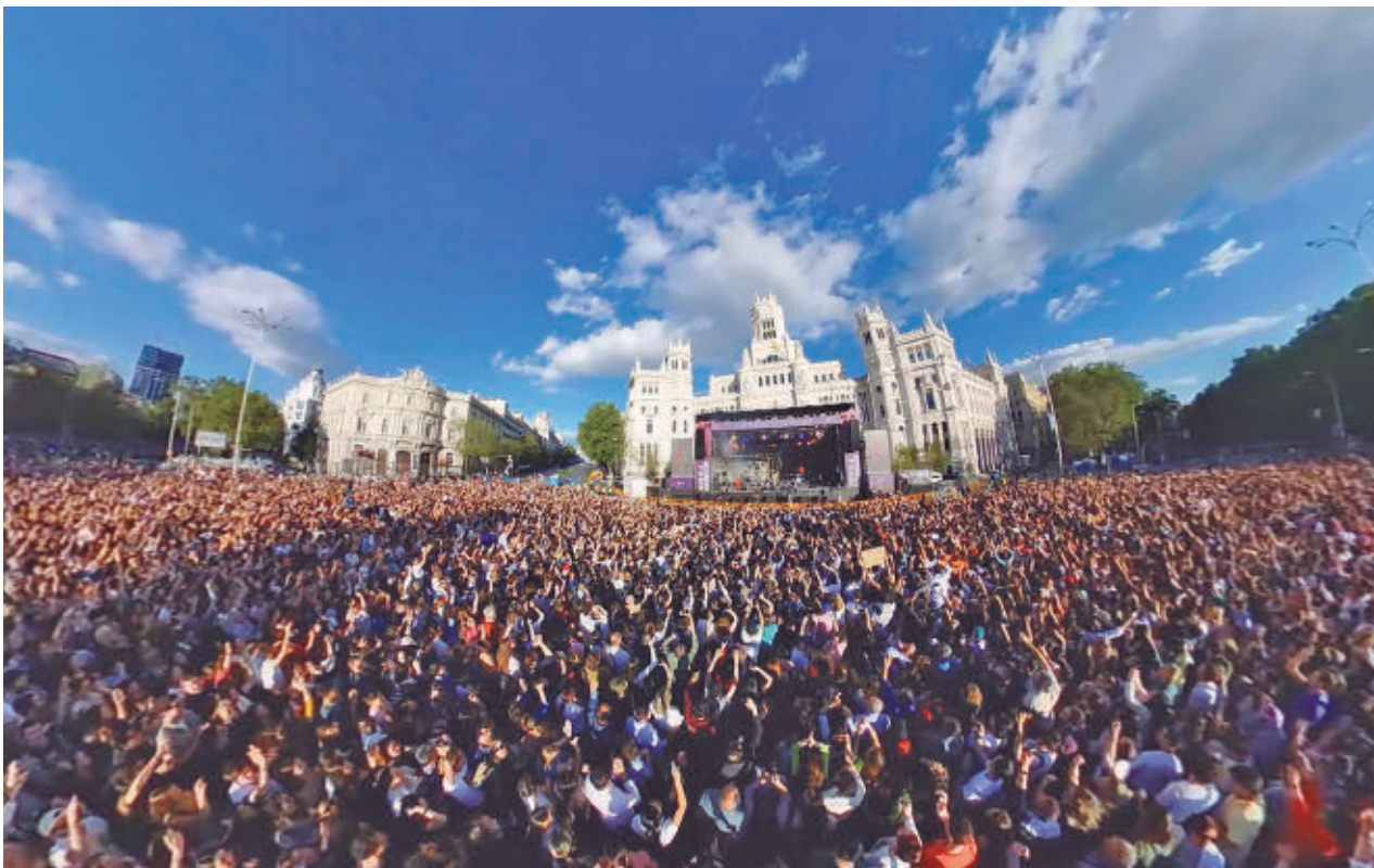
Los asistentes volverán a abarrotar el entorno de la Plaza de Cibeles ACDP