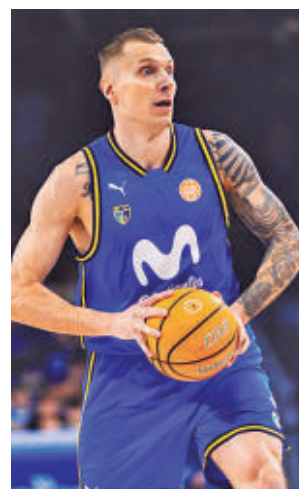
Triunfo de los colegiales

Estos resultados no alteran demasiado el lugar de ambos equipos en la tabla. El 'Estu' es quinto clasificado, mientras que el 'Fuenla' aún tiene dos triunfos de ventaja sobre el décimo clasificado. Este viernes (20:45), el Movistar Estudiantes abre la jornada visitando al Tizona, mientras que el Fuenlabrada visitará el sábado al Oviedo.