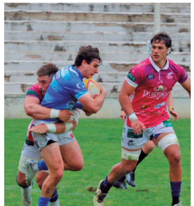
Nuevo encuentro en el Estadio Nacional

Para el penúltimo compromiso de esta fase regular habrá que esperar hasta el jueves 23 (20 horas) cuando visite Magariños el Casademont Zaragoza, actual líder de la clasificación y uno de los claros candidatos a alzarse con el título de campeón. El cierre llegará el 25 de abril (19 horas, en principio habrá horario unificado) con la visita a la pista de un Durán Maquinaria Ensino que tiene pie y medio en las eliminatorias por el título.