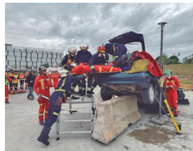
Una de las pruebas de esta semana

Durante la competición, los equipos deben enfrentarse a simulacros de alta complejidad, con rescates de víctimas atrapadas en vehículos, en escenarios diseñados para reproducir siniestros reales. El objetivo es evaluar la capacidad técnica, la coordinación y los tiempos de respuesta de los efectivos.