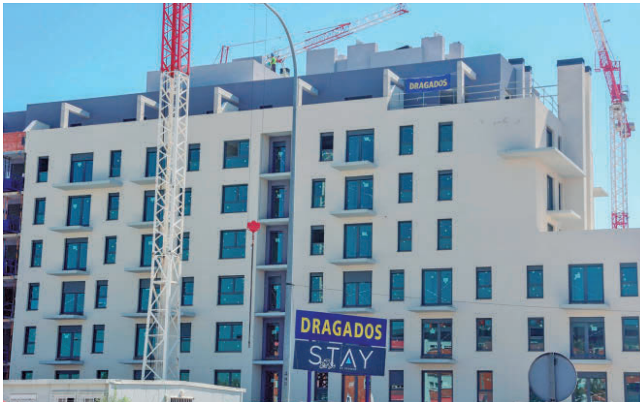
Promoción de pisos en construcción en Madrid

Tendrán preferencia quienes acrediten al menos cinco años de empadronamiento en el municipio o desarrollen en él su actividad laboral. En segundo lugar, se situarán los solicitantes con diez años de residencia acreditada en la región, quedando en último término el resto de las personas empadronadas. Este nuevo esquema sustituye al anterior, que establecía un mínimo de tres años. Además, se quiere reforzar la gestión y