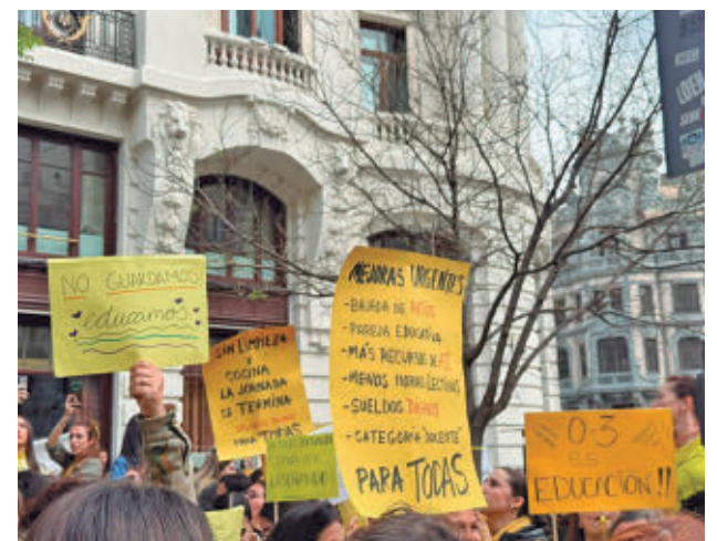
Concentración de los trabajadores E.P.

Para la Consejería de Educación, Ciencia y Universidades de la Comunidad de Madrid exigen mejoras en los pliegos de condiciones que en la actualidad "plasman la infrafinanciación y la dejadez y el abandono de este ciclo educativo en unas ratios que son abusivas". Para todas las instituciones, los trabajadores han pedido dejar la externalización y la privatización de un sector "tan importante como es la educación infantil".