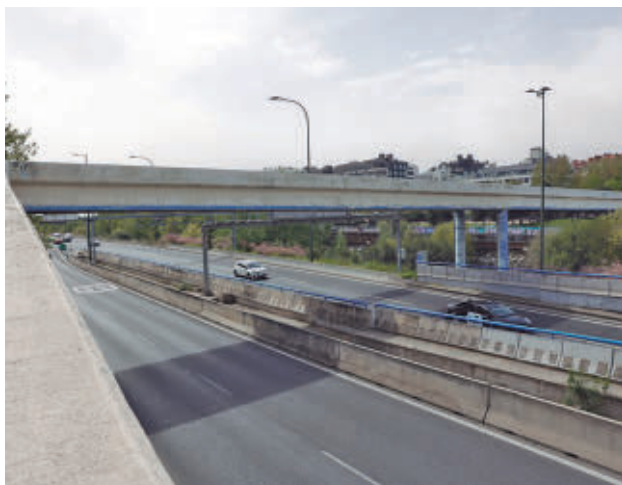
Estado actual de la infraestructura peatonal

acompañadas, y también de las dificultades cuando se detecta una discapacidad y, por tanto, también del shock que pueden sufrir en un momento dado los padres como consecuencia de esa discapacidad", añadió el primer edil.