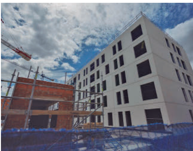
Una vivienda en construcción en la capital

En comparación interanual, el paro cayó en ambos sexos. Disminuyó un 3,5% entre los hombres, 2.058 menos, y un 3,4% entre las mujeres de creció un 3,4%, 2.703 parados menos. Con respecto a febrero de 2026, aumentó entre los hombres un 0,1% (70 parados más), y descendió entre las mujeres, un 0,2% (146 desempleadas menos).