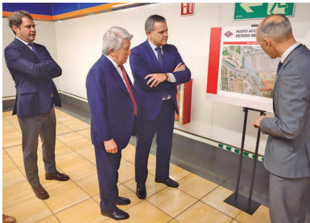
Un momento de la visita institucional a la estación del suburbano

Fuentes regionales aseguran que la Comunidad tiene previsto licitar el proyecto con