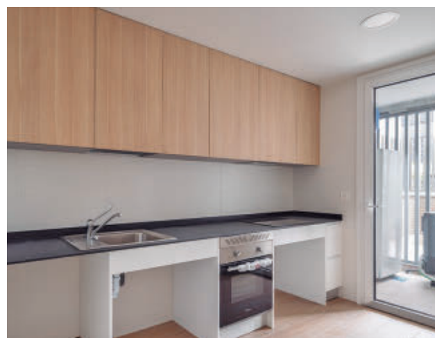
La cocina de uno de los nuevos pisos de Cañaverál 13

Consulte la actualidad regional y local en nuestra página web