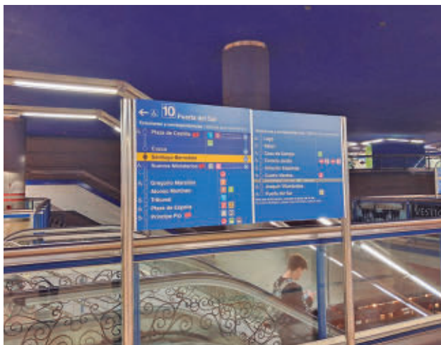
Uno de los carteles del suburbano @AGUADOC1396

Consulte la actualidad regional y local en nuestra página web