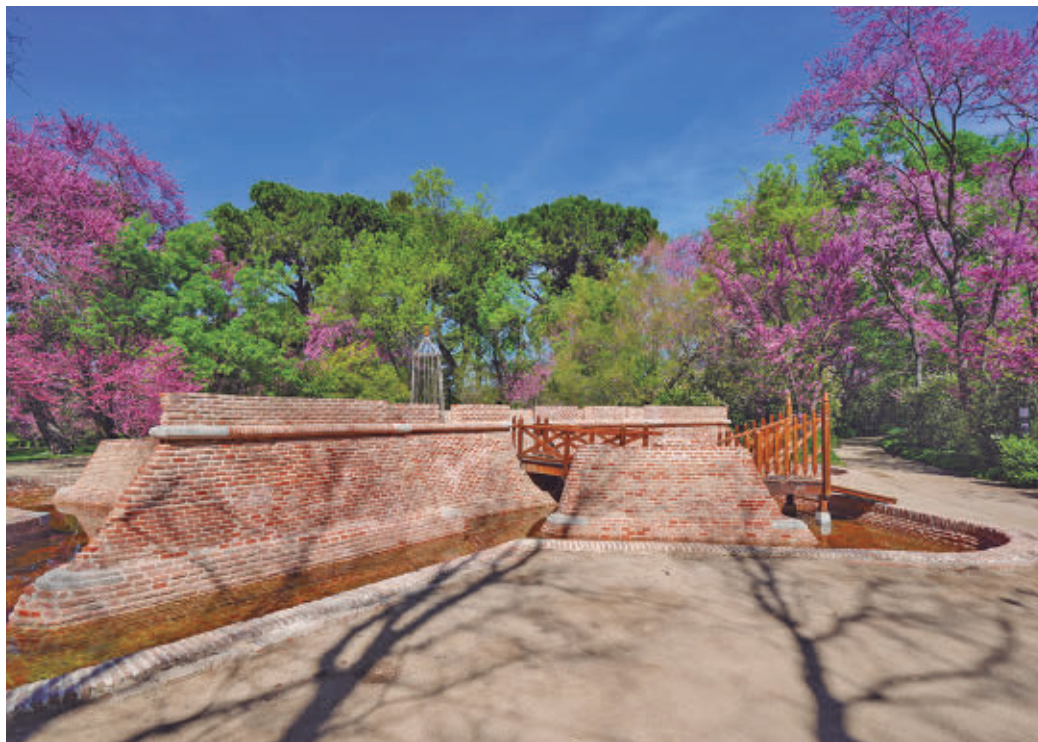
El fortín del jardín histórico de El Capricho, tras los trabajos de restauración

do de visitantes de entre 150 y 200 personas. Así lo adelantó el delegado de Urbanismo, Medio Ambiente y Movilidad, Borja Carabante, en la visita que realizó el lunes 6 de abril a este pulmón verde para comprobar los trabajos de restauración llevados a cabo por el Consistorio en dos de los elementos arquitectónicos más emblemáticos del jardín histórico, el fortín y el casino de baile.