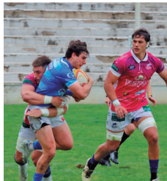
Nuevo encuentro en el Estadio Nacional

Para el penúltimo compromiso de esta fase regular habrá que esperar hasta el jueves 23 (20 horas) cuando visite Magariños el Casademont Zaragoza, actual líder de la clasificación y uno de los claros candidatos a alzarse con el título de campeón. El cierre llegará el 25 de abril (19 horas, en principio habrá horario unificado) con la visita a la pista de un Durán Maquinaria Ensino que tiene pie y medio en las eliminatorias por el título.