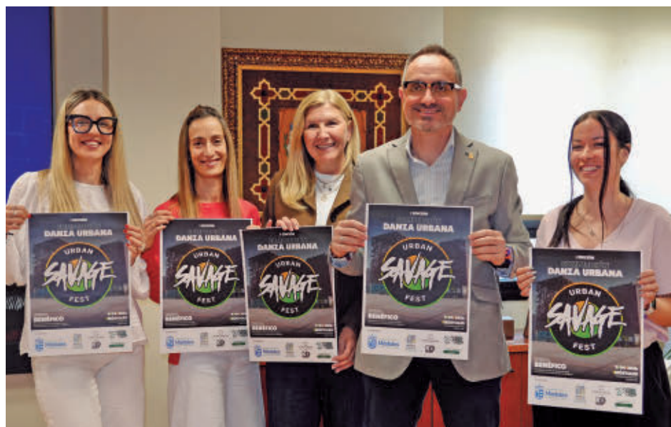
En el I Urban Savage Fest participarán bailarines de todas las edades y todos los niveles