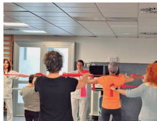
50 actividades gratuitas con una treintena de entidades