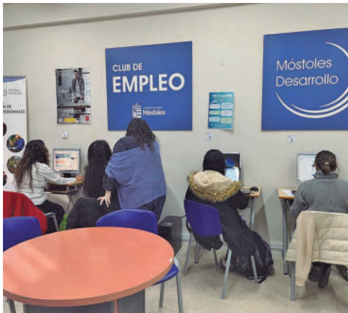
Participarán centros educativos, universidades y profesionales

El evento tendrá lugar en las instalaciones de Móstoles Desarrollo, en la calle Pin-