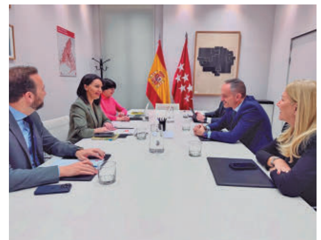
Reunión entre representantes regionales y municipales

Esta iniciativa se enmarca en una estrategia más amplia del Consistorio en materia de vivienda, que incluye el desarrollo de nuevos suelos y la construcción de miles de viviendas en los próximos años para responder a la creciente demanda.