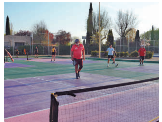
Móstoles refuerza su apuesta por disciplinas emergentes

Las pistas estarán disponibles próximamente mediante el sistema habitual de alquiler de instalaciones deportivas municipales.