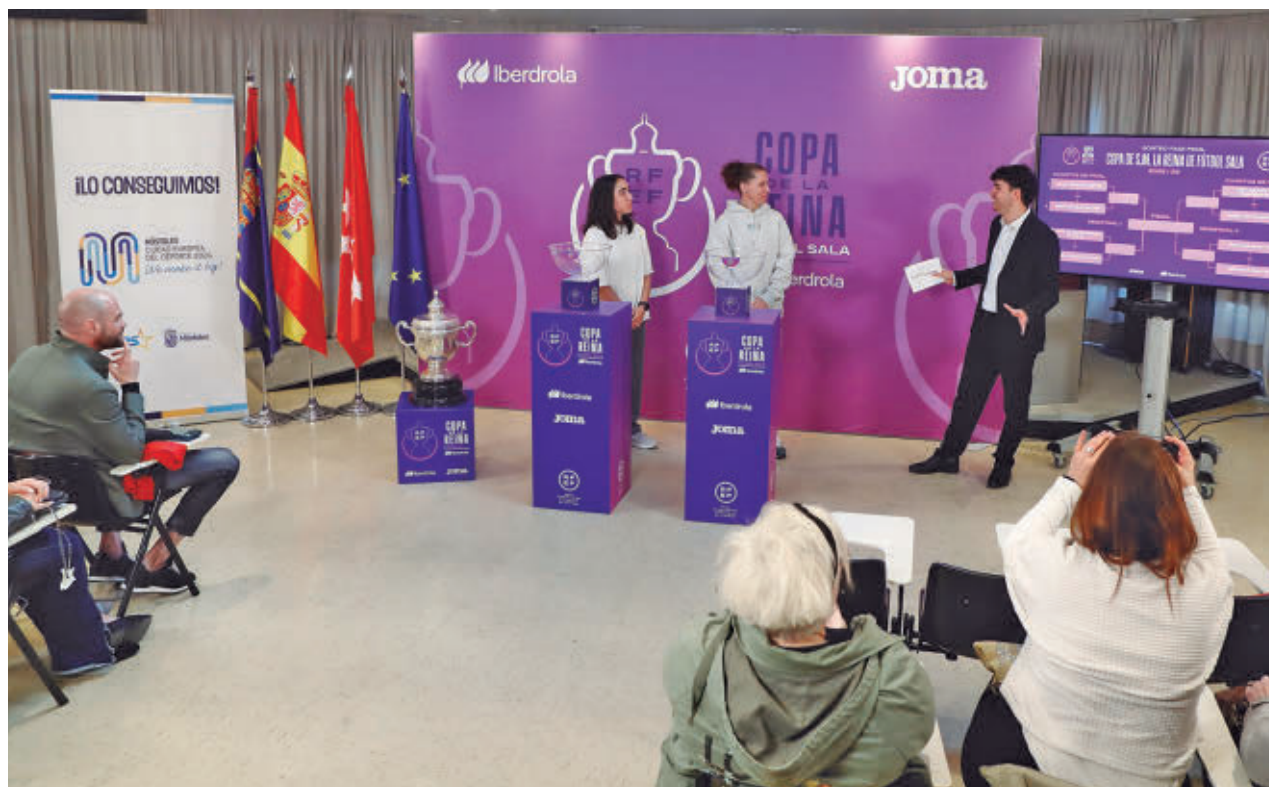
Los ocho mejores equipos de Primera y Segunda División se enfrentarán en la Fase Final de la Copa de la Reina 2026