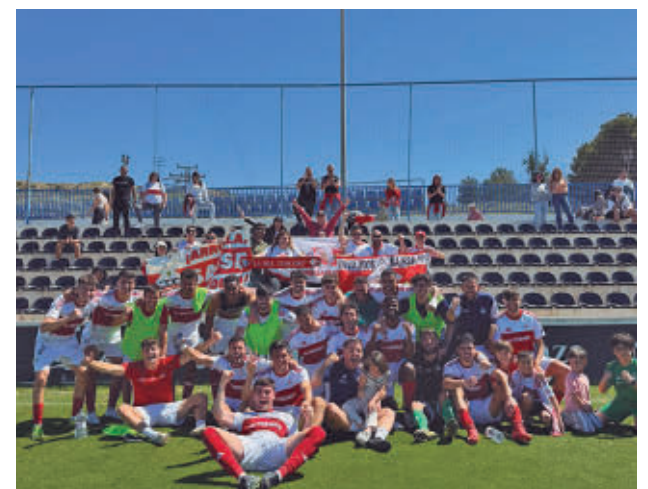
Celebración en el campo del Intercity UD SANSE

rios equipos madrileños. Ahora mismo, el Fuenlabrada ocupa el puesto de promoción de permanencia, con 33 puntos, con Quintanar (32), Real Madrid C (31) y Moscardó (30) acechando esa posición. Este fin de semana pueden cambiar el panorama los resultados del Fuenlabrada-Alcalá, Moscardó-Orihuela y Las Palmas At-R. Madrid C.