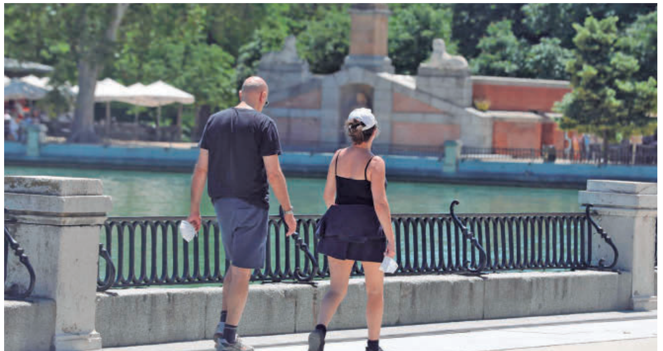
Pareja en el parque de El Retiro

ALCORCÓN Y COSLADA SON LOS MUNICIPIOS QUE MENOS REGISTRARON