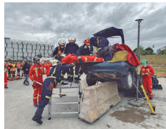
Una de las pruebas de esta semana

Durante la competición, los equipos deben enfrentarse a simulacros de alta complejidad, con rescates de víctimas atrapadas en vehículos, en escenarios diseñados para reproducir siniestros reales. El objetivo es evaluar la capacidad técnica, la coordinación y los tiempos de respuesta de los efectivos.