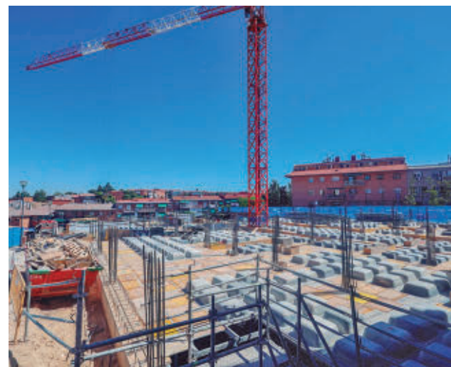
Construcción de una promoción del Plan Vive E. P.

Tras ganar el Premio Planeta en 2023 Sonsoles Ónega presenta su nueva novela: ‘Llevará tu nombre’