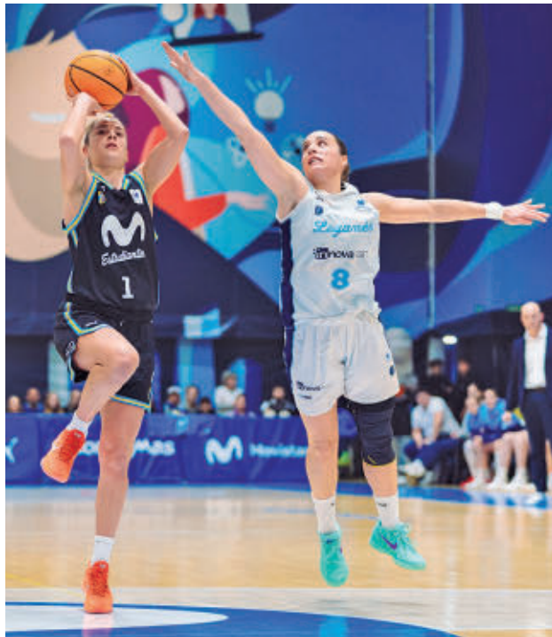
Estudiantes y Leganés apuran sus opciones

Tras el paréntesis por la celebración de la Copa de la Reina, la Liga Femenina Endesa pisa el acelerador para encarar la recta final de la fase regular. Tres jornadas son las que restan para conocer qué conjuntos se ganarán el derecho de disputar los 'play-offs' por el título. En esa pelea están metidos de lleno los dos representantes madrileños. El que mejor lo tiene es el In-