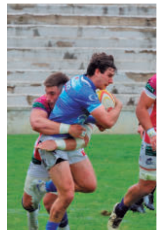
Cita en el Estadio Nacional

La segunda fase de la División de Honor masculina de rugby afronta sus dos últimas jornadas con el VRAC Quesos Entrepinares destacado en el liderato gracias a su pleno de victorias. Lejos de esos números brillantes, los tres equipos madrileños llegan a este tramo de la temporada con la tranquilidad de haber asegurado la permanencia y con el deseo de cerrar el curso con un buen sabor de boca. Dos de ellos, el Complutense Cisneros y el Societe Generale Liceo Francés, protagonizan este sábado (15 horas) en el Estadio Nacional un interesante derbi, con los locales defendiendo su cuarta posi-