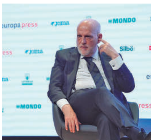
Javier Tebas, presidente de LaLiga

EL PERIÓDICO GENTE NO SE RESPONSABILIZA NI SE IDENTIFICA CON LAS OPINIONES QUE SUS LECTORES Y COLABORADORES EXPONGAN EN SUS CARTAS Y ARTÍCULOS