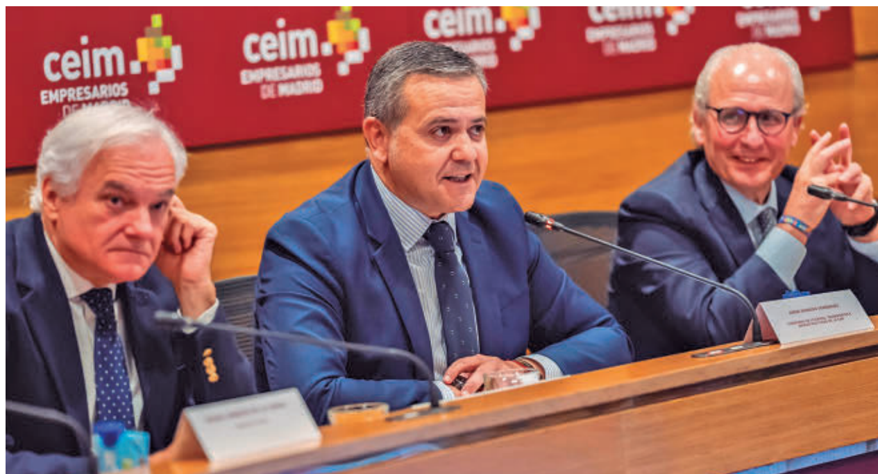
Acto celebrado esta semana en la sede de CEIM

Según explica el INJUVE, esta iniciativa es "un valioso instrumento para garantizar la cohesión social y para lograr los objetivos marcados en la Estrategia Europea de la Juventud 2019-2027.