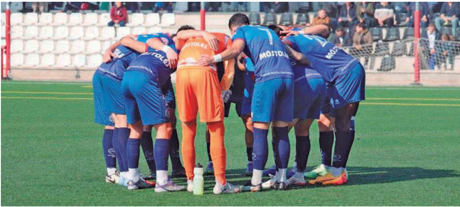
El CD Móstoles URJC ha perdido terreno en la pelea por el primer puesto