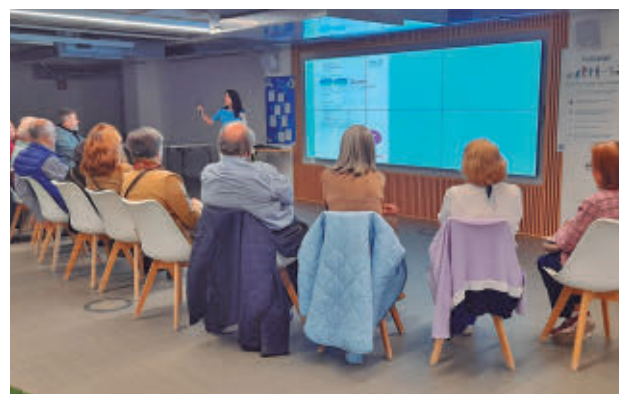
Sesión del Canal de Isabel II con mayores

Estas sesiones, que se han celebrado en la capital y en los municipios de Humanes y Alcobendas, han permitido a la empresa pública conocer las dificultades que los madrileños encuentran a la hora de realizar gestiones a través de