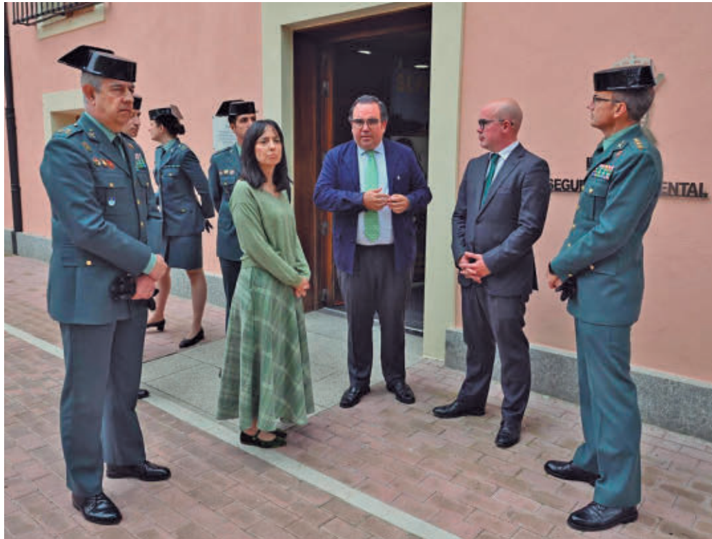
Acto de inauguración del Instituto Nacional de Seguridad Ambiental

EL CONSISTORIO HA CEDIDO UN ESPACIO EN LA CASA DE LA MILLONARIA