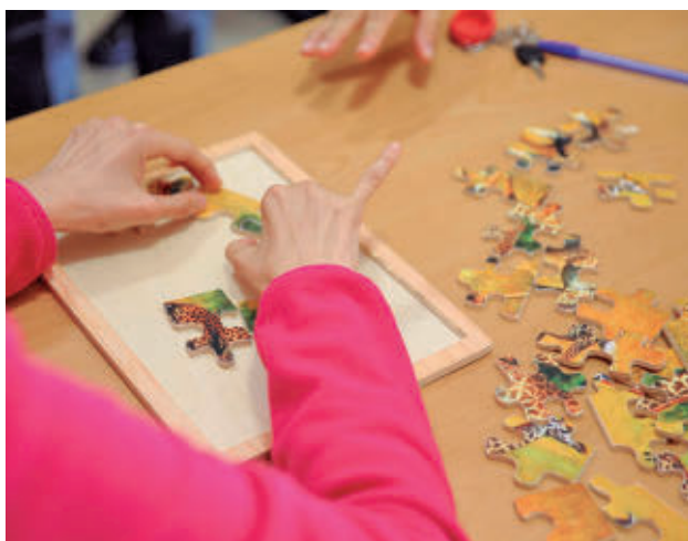
Uno de los talleres para personas con discapacidad

"Cada año, Las Rozas trabaja para renovar su compromiso con la autonomía individual y la inclusión social", ha recalcado el Ayuntamiento de la ciudad tras recibir el galardón, para añadir a continuación que lo hace mediante programas de actividades, talleres terapéuticos, salidas vacacionales o el apoyo a las entidades y asociaciones del Tercer Sector.