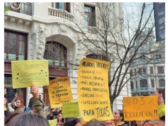
Concentración de los trabajadores E.P.

Para la Consejería de Educación, Ciencia y Universidades de la Comunidad de Madrid exigen mejoras en los pliegos de condiciones que en la actualidad "plasman la infrafinanciación y la dejadez y el abandono de este ciclo educativo en unas ratios que son abusivas". Para todas las instituciones, los trabajadores han pedido dejar la externalización y la privatización de un sector "tan importante como es la educación infantil".