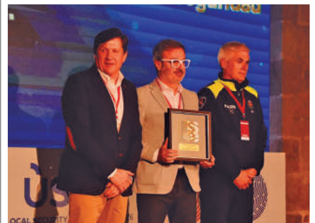
La Gala de los VI Usecim Awards tuvo lugar en Barcelona

GenteMadrid.es Consulte la actualidad regional y local en nuestra página web