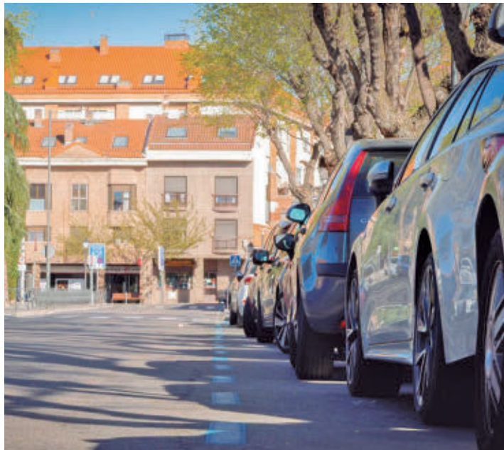
Una de las nuevas zonas delimitadas por líneas azules

El Ayuntamiento de Boadilla del Monte, a través de la EMSV, ha puesto en marcha la ampliación de la ORA (zona azul) a la avenida de España, donde se incorporan 47 nuevas plazas, con el objetivo de facilitar la rotación de vehículos, reducir el estacionamiento prolongado no autorizado y favorecer que los residentes del casco encuentren aparcamiento con mayor facilidad,