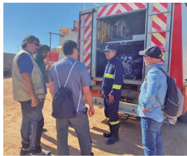
Una visita institucional a los campamentos de refugiados