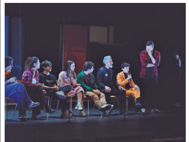
Los estudiantes asisten a una función teatral contra el acoso

La alcaldesa de Alcorcón, Candelaria Testa, ha asegurado que están "coordinando acciones" y que volverán a reclamar a la SAREB las resoluciones judiciales necesarias para frenar la okupación en la calle Praga, en el entorno de Parque Oeste. "Nos pasa un poco como lo que hay en la calle Madrid, dependemos de resoluciones judiciales y, en tanto que eso suceda, estamos coordinándonos con las fuerzas y cuerpos de seguridad", ha añadido. La alcaldesa se ha manifestado en estos términos después de que los vecinos denunciaran nuevas okupaciones en plena Semana Santa. Según ha dicho, resulta clave el trabajo conjunto con los efectivos de seguridad, por lo que asegura que sobre estos asuntos se celebran reuniones "rigurosas".