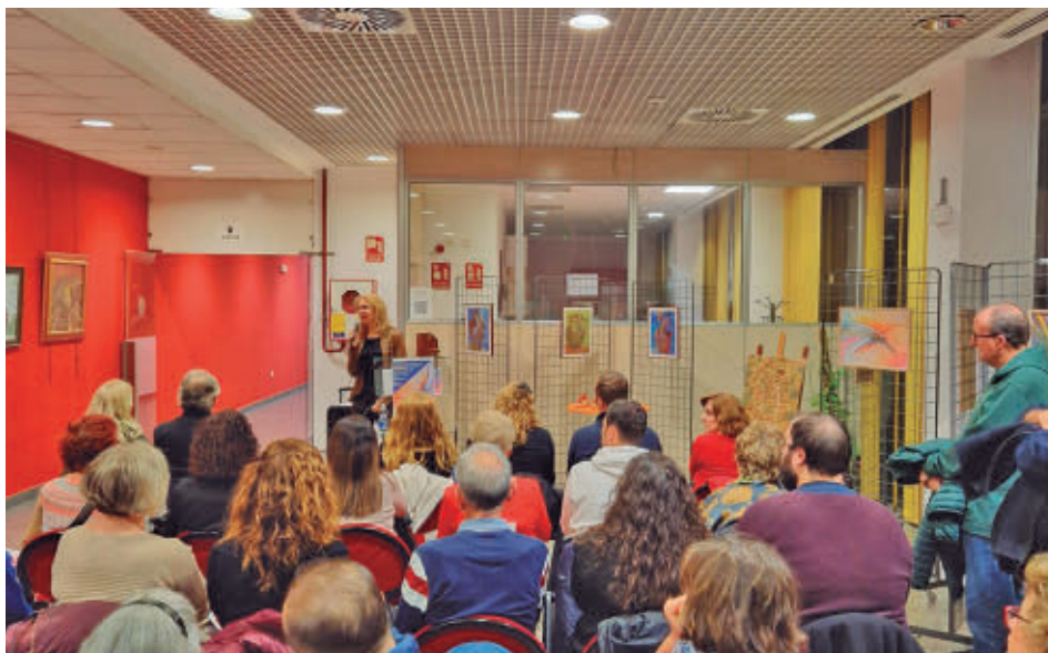
La asociación se dio a conocer el pasado 3 de diciembre A.C DEL BARRO