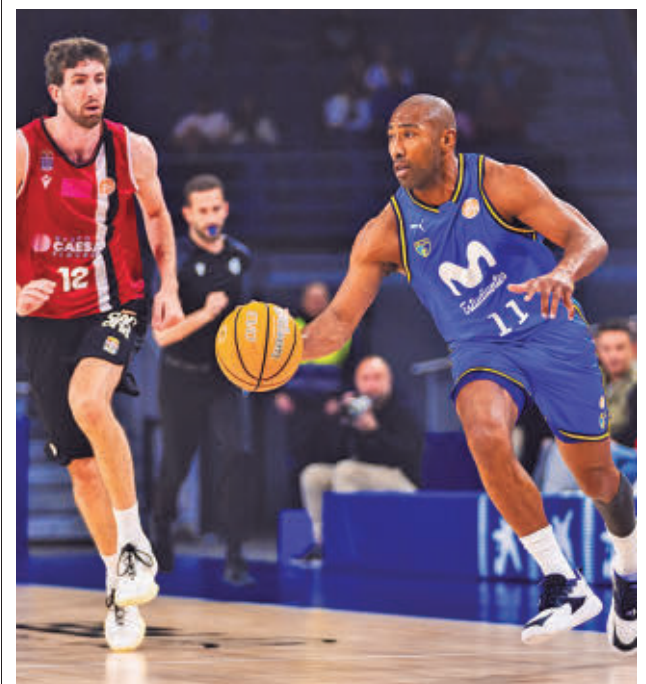
El Estudiantes va remontando el vuelo

Dos de esos tres equipos accederán a semifinales, donde se medirán el sábado 25 (17 y 19:30 horas) ante los dos primeros clasificados del Grupo A, donde están CVB Barça, Fedes Ascensores La Laguna y Santa Cruz Cuesta Piedra, el gran favorito al ascenso. Los vencedores de esas semifinales obtendrán el billete para jugar la próxima temporada en la Liga Iberdrola, además de protagonizar la final programada para el domingo 26 a partir de las 12 del mediodía.