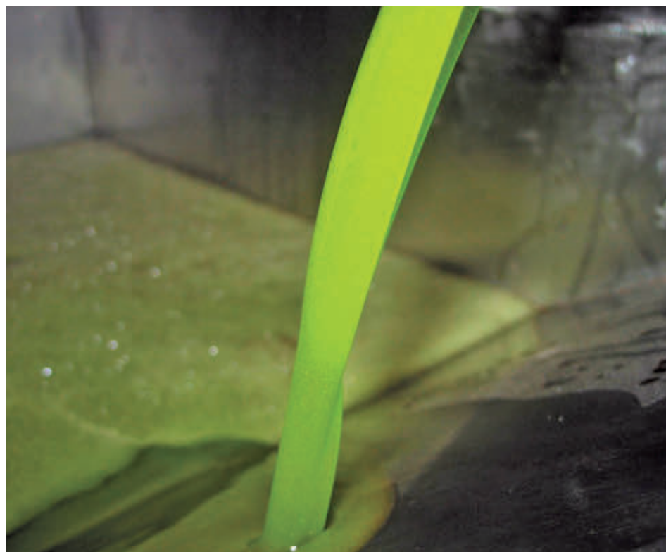
Elaboración de aceite de oliva en una almazara E. P.

UPA Y ASAJA PIDEN QUE SE AUMENTEN LOS PRECIOS EN ORIGEN