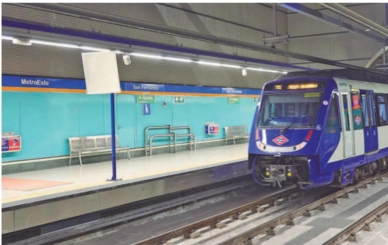
Un tren entrando en la estación de Metro de San Fernando