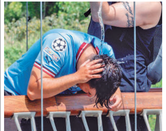
Un hombre se refresca en una fuente