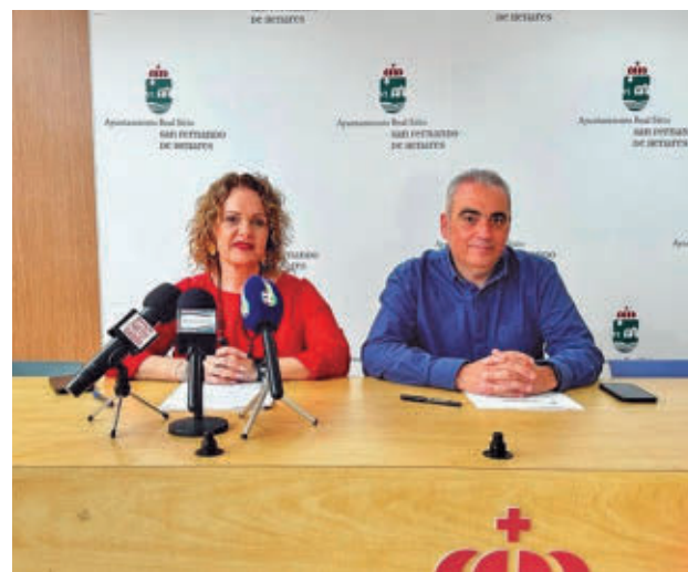
Presentación de las inversiones