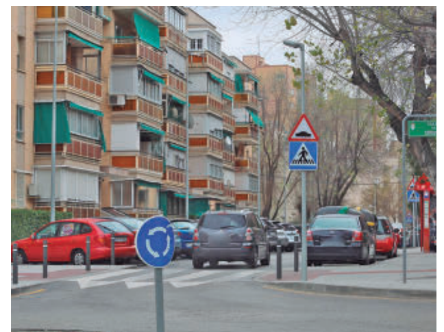
Una de las calles en las que se está actuando

Además, con la vista puesta para después del verano, está prevista otra partida de más de 4 millones de euros para proceder a un nuevo Plan de Asfaltado que beneficiará a la práctica totalidad de calles de la ciudad, según el Ayuntamiento.