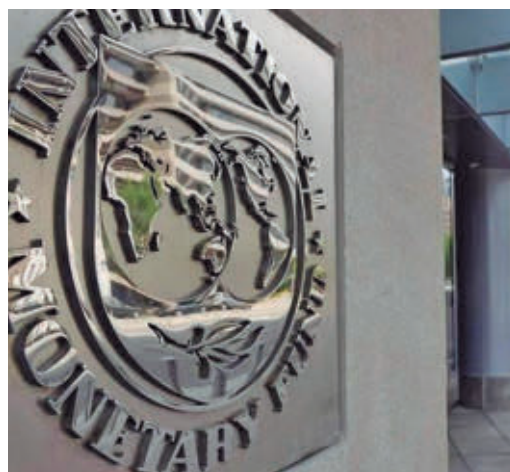
Fachada del Fondo Monetario Intenacional

EL PERIÓDICO GENTE NO SE RESPONSABILIZA NI SE IDENTIFICA CON LAS OPINIONES QUE SUS LECTORES Y COLABORADORES EXPONGAN EN SUS CARTAS Y ARTÍCULOS