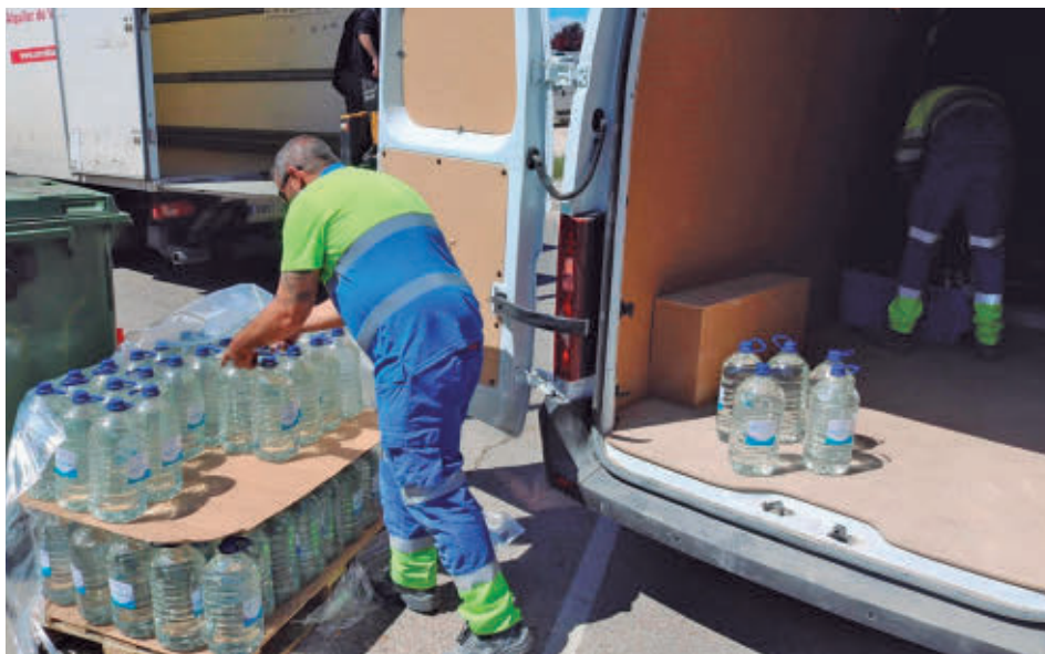
Reparto de agua embotellada por parte del Ayuntamiento