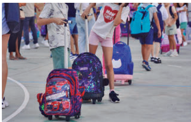
La evaluación ya se está llevando a cabo E. P.

En total, participarán 50 colegios de cada comunidad autónoma y 50 alumnos por