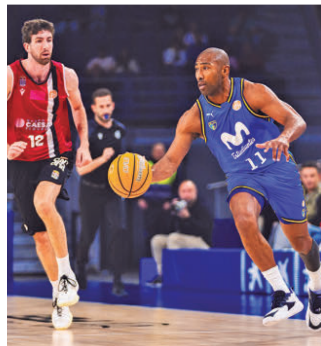
El Estudiantes va remontando el vuelo

Dos de esos tres equipos accederán a semifinales, donde se medirán el sábado 25 (17 y 19:30 horas) ante los dos primeros clasificados del Grupo A, donde están CVB Barça, Fedes Ascensores La Laguna y Santa Cruz Cuesta Piedra, el gran favorito al ascenso. Los vencedores de esas semifinales obtendrán el billete para jugar la próxima temporada en la Liga Iberdrola, además de protagonizar la final programada para el domingo 26 a partir de las 12 del mediodía.