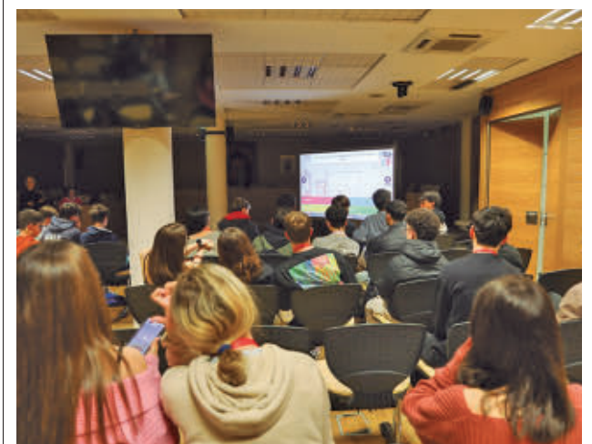
Imagen de archivo de visita de escolares al Ayuntamiento

Actualmente 13 comunidades de vecinos de Las Margaritas y Juan de la Cierva esperan para recibir los anticipos de las ayudas reconocidas, mientras que otras 23 no tienen aún sus resoluciones favorables. Getafe insiste en que estos retrasos hacen que las comunidades no se atrevan a realizar las obras, a pesar de la oportunidad que representan los fondos europeos.