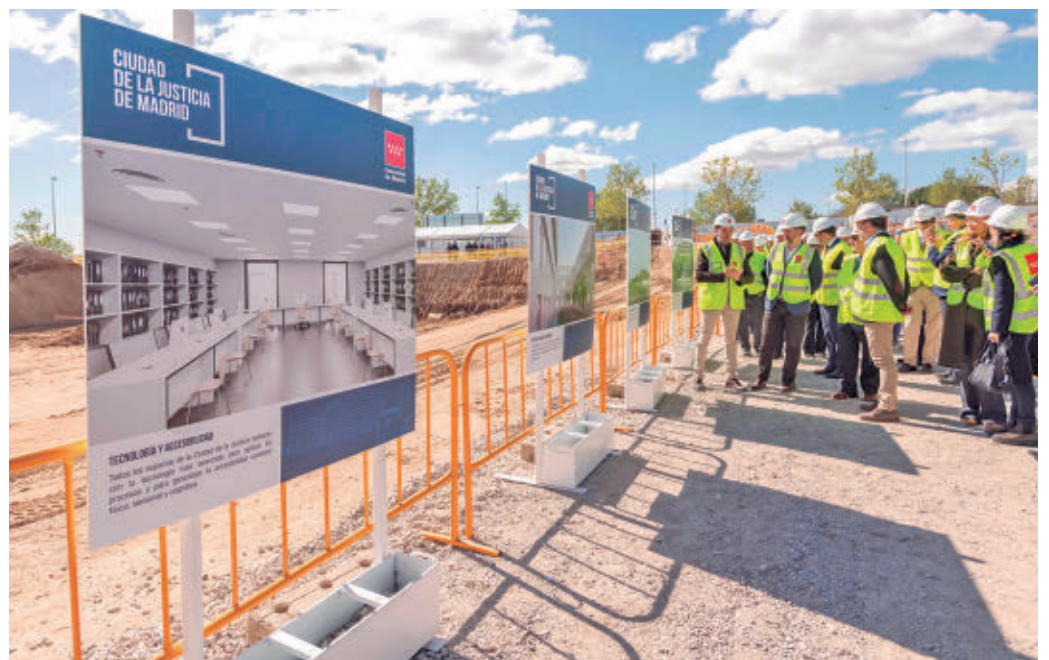
Solar en el que se levantará la Ciudad de la Justicia de la Comunidad de Madrid

La Comunidad de Madrid invertirá 653 millones de euros para construir la Ciudad de la Justicia de la capital en Valdebebas, con un ahorro previsto de 80 millones anuales para las arcas públicas entre alquileres y la concentración de contratos de servicios y suministros. En ella se unificarán 26 sedes judiciales repartidas hasta el momento por la ciudad. Tendrá una superficie construida de más de 470.000 metros cuadrados, lo que representa un aumento del 61% respecto a la suma de toda el área destinada a estos organismos en la actualidad.