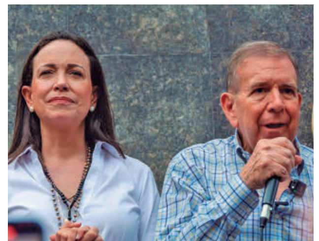
María Corina Machado y Edmundo Fernández

El encuentro se celebrará a las 17:30 horas y estará presente todo el Gobierno regional. Durante la reunión, se abordará especialmente su "lucha por la libertad del pueblo venezolano", en un contexto marcado por la situación política que atraviesa el país.