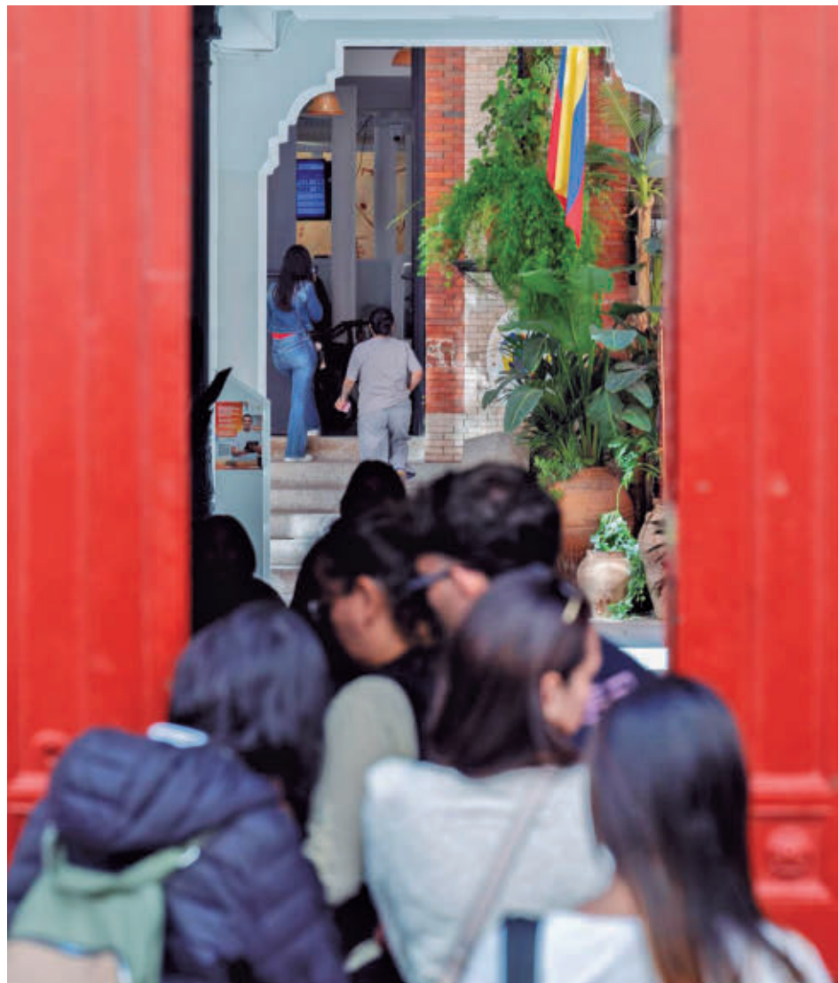
Colas en la embajada de Colombia para tramitar documentación EUROPA PRESS

Podrán participar en este proceso los migrantes que se encuentren en España en situación irregular y solicitantes de protección internacional antes del 1 de enero de 2026 y hayan permanecido en España al menos cinco meses seguidos, siempre que carezcan de antecedentes penales. Se podrá acreditar la estancia en España con cualquier documento público, privado o combinación de ambos verificables. El certificado de empadronamiento es válido pero no obligatorio. Todos los documentos deberán ser nominativos.