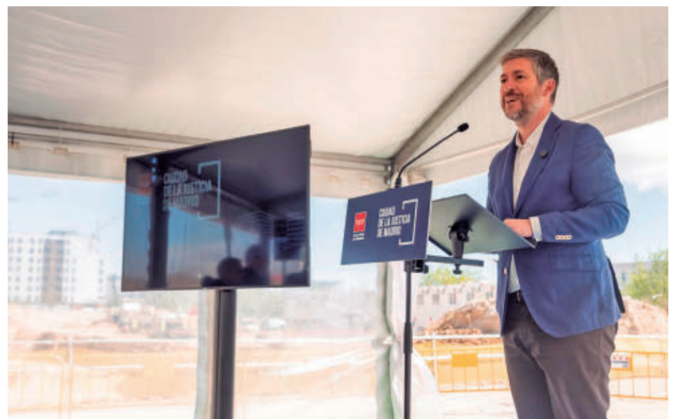
El portavoz regional visitó las obras esta semana

LA PLAZA DE LA JUSTICIA SERÁ CASI TAN GRANDE COMO LA PUERTA DEL SOL