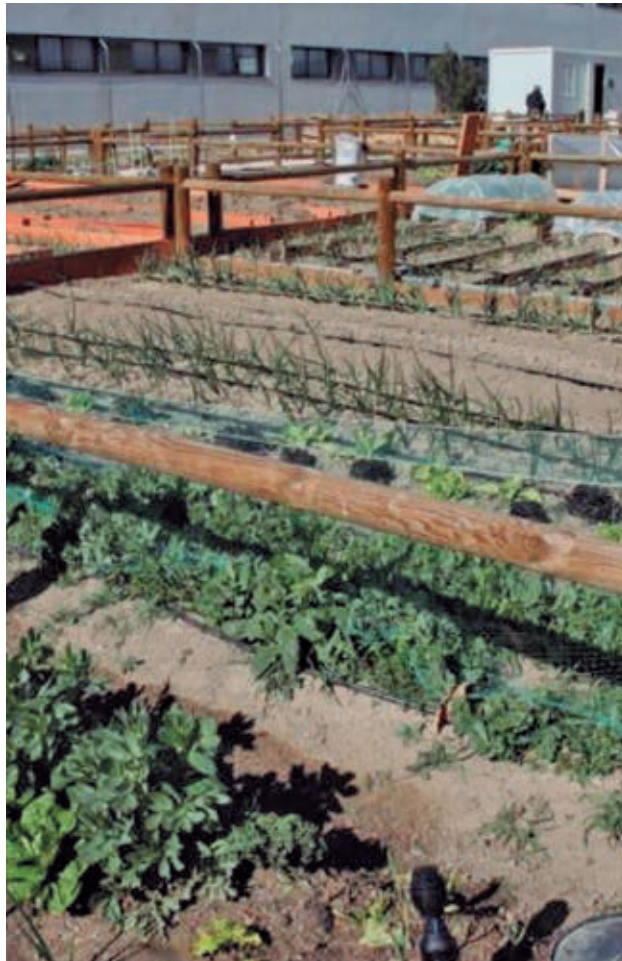
Huertos urbanos en Getafe

LA ORDENANZA AMPLÍA LA CONCESIÓN HASTA LOS CUATRO AÑOS