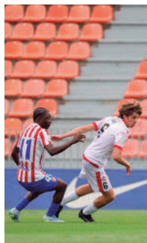
El Atlético C, más líder

Otro de los choques destacados de la jornada se vivirá en El Soto (domingo, 11:45 horas), donde un CD Móstoles URJC en crisis recibirá al Leganés B, tercero con solo un punto de ventaja respecto a su próximo rival.