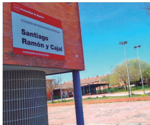
Uno de los colegios que participa