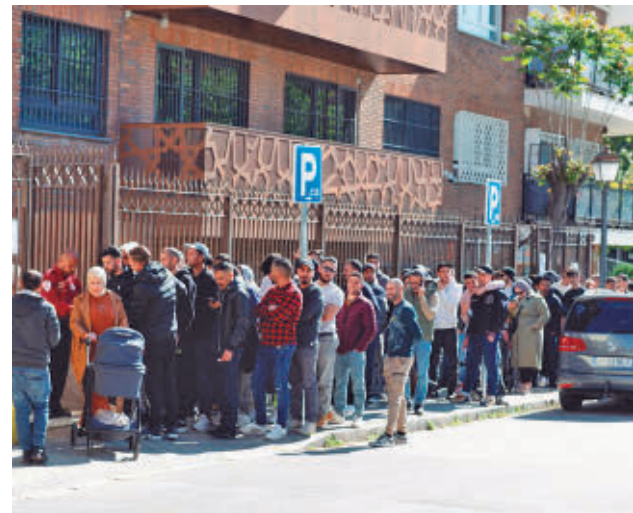
Colas en la embajada de Marruecos