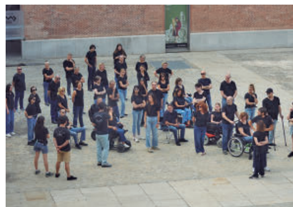
Un momento del rodaje

momento quise colocarnos como víctimas porque somos luchadores y luchadoras; vivir con una discapacidad es un trabajo de superhéroes”. En este vídeo Gutiérrez transmite que “cada día tenemos que enfrentarnos en la vida con un