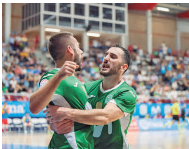
Los torrejoneros son terceros en la tabla