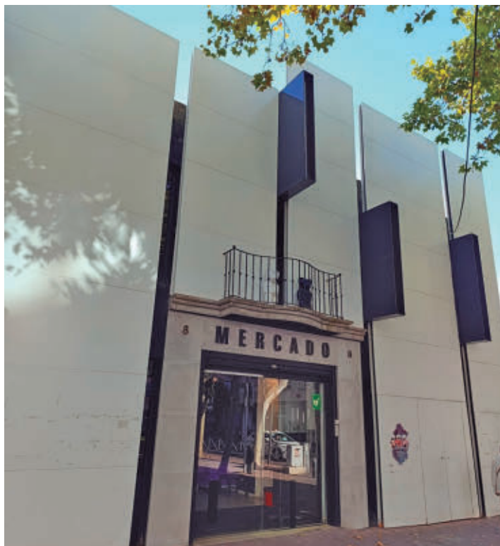
El Espacio Mercado acoge buena parte de la programación cultural

fomento de la lectura. Además, entre los actos previstos más destacados figura 'La rabia se volvió poesía'. Se trata de un particular homenaje al fallecido músico Robe Iniesta, líder de Extremoduro, que tendrá lugar el próximo viernes 24 de abril a las 18:30 horas, en el Centro Cívico de La Alhóndiga. El programa