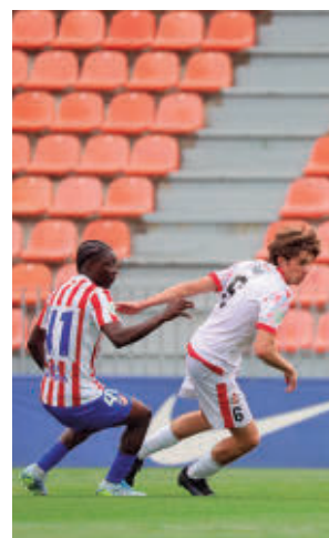
El Atlético C, más líder

Otro de los choques destacados de la jornada se vivirá en El Soto (domingo, 11:45 horas), donde un CD Móstoles URJC en crisis recibirá al Leganés B, tercero con solo un punto de ventaja respecto a su próximo rival.