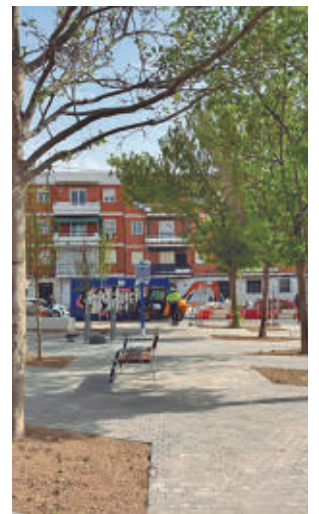
Los trabajos en la zona