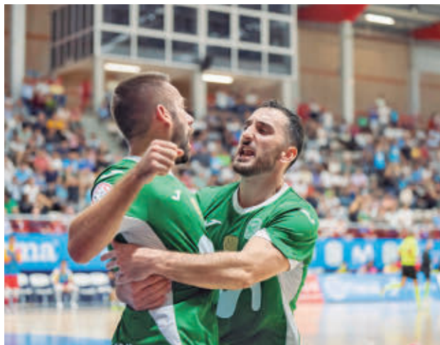
Los torrejoneros son terceros en la tabla

ficarse para el 'play-off' por el título. En el caso de sacar adelante el compromiso de este sábado (17:30), el equipo de Alberto Riquer metería presión a sus rivales por la tercera plaza, aprovechando dos duelos directos: Cartagena-Palma y Valdepeñas-Manzanares.