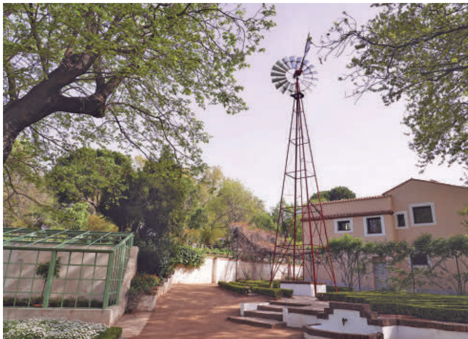
La Casa del Reloj, tras la remodelación realizada por el Ayuntamiento de Madrid

Esta actuación se unirá a la primera fase ejecutada en 2024, dotada de 420.000 euros, que consistió en la sustitución de los lucernarios de la cubierta, en la ejecución de una nueva red de saneamiento de aguas pluviales y en la creación de dos pasarelas en el interior del pabellón.