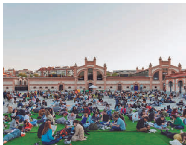
La Plaza de Matadero, acondicionada con césped artificial