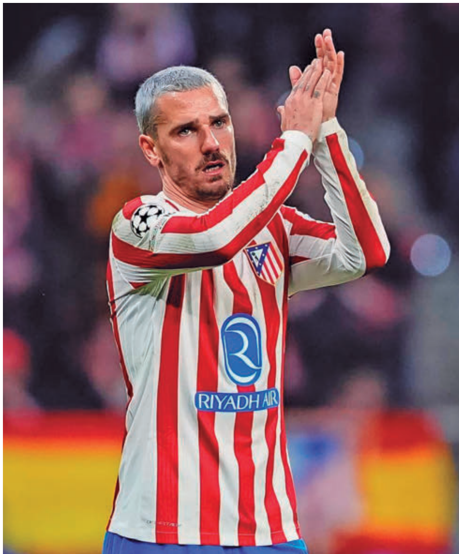
Griezmann está viviendo un final de temporada muy positivo

Sabe bien lo que es vestir ambas camisetas uno de los jugadores llamados a ser protagonistas sobre el césped. A sus 35 años, Antoine Griez-