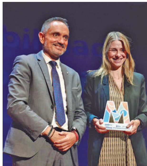
La XXXIV edición de los premios tuvo récord de participación

El plazo de inscripción ya está abierto y permanecerá activo hasta el 4 de mayo. Podrán participar comercios, emprendedores, pymes, micropymes, startups y autónomos que desarrollen su actividad en el municipio, mediante un formulario sencillo