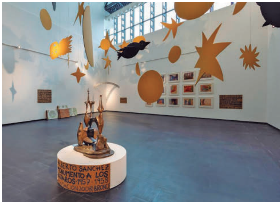
Podrá visitarse en el CA2M de la Comunidad de Madrid hasta finales de verano