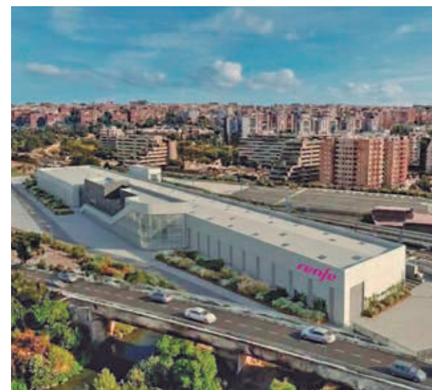
La licitación tiene un presupuesto de 42,7 millones de euros

La actuación, impulsada a través de Renfe, cuenta con un presupuesto de 42,7 millones de euros y un plazo de ejecución de 18 meses. Dará servicio a los trenes Stadler de gran capacidad que se incorporarán progresivamente a lo largo de este año. Se trata de unidades de la serie 453, con capacidad para más de 500 viajeros, accesibilidad