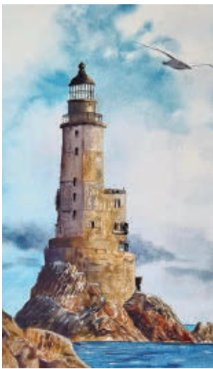
En el CSC Caleidoscopio