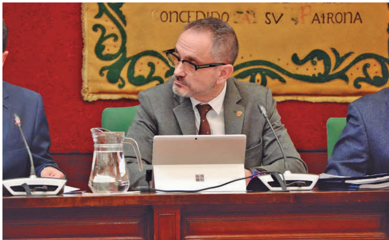
La querrela fue interpuesta el 17 de febrero y no se ha ordenado "ninguna diligencia de ningún tipo" ni se ha citado a las partes