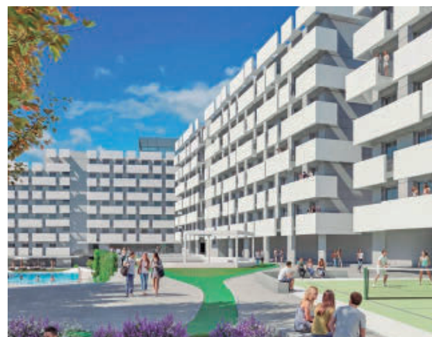
La apertura del alojamiento está prevista para 2028

El desarrollo contará con la participación de Rinkelberg Capital como socio inversor y se convertirá en el