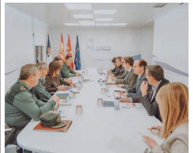
La reunión de la Junta Local de Seguridad