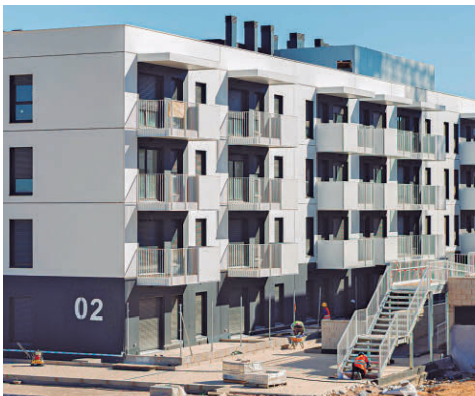
La nueva promoción situada en la zona de Valenoso

En la reunión se repasó también la evolución de los datos de criminalidad durante los primeros meses de 2026 en comparación con 2025. Estas cifras arrojan un descenso de la criminalidad en infracciones penales, un 3,41%, y contra el patrimonio, un 3,57%.