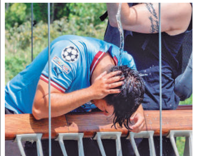
Un hombre se refresca en una fuente