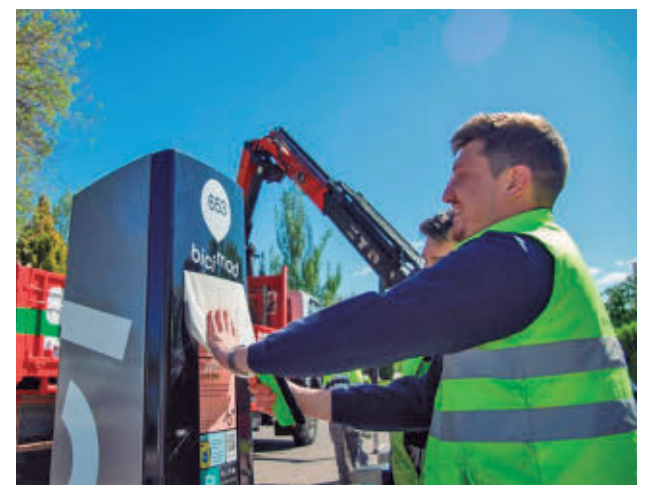
Instalación de una estación de Bicimad

Para que la prestación del servicio sea una realidad, los ayuntamientos de ambas localidades han firmado un convenio que establece que Pozuelo se encargará de la inversión y el mantenimiento y Madrid de la gestión. También se garantiza la interoperabilidad plena del servicio. De este modo, los usuarios podrán utilizar Bicimad sin barreras operativas entre ambos municipios, lo que permite planificar y realizar desplazamientos interurbanos de forma sencilla y flexible.