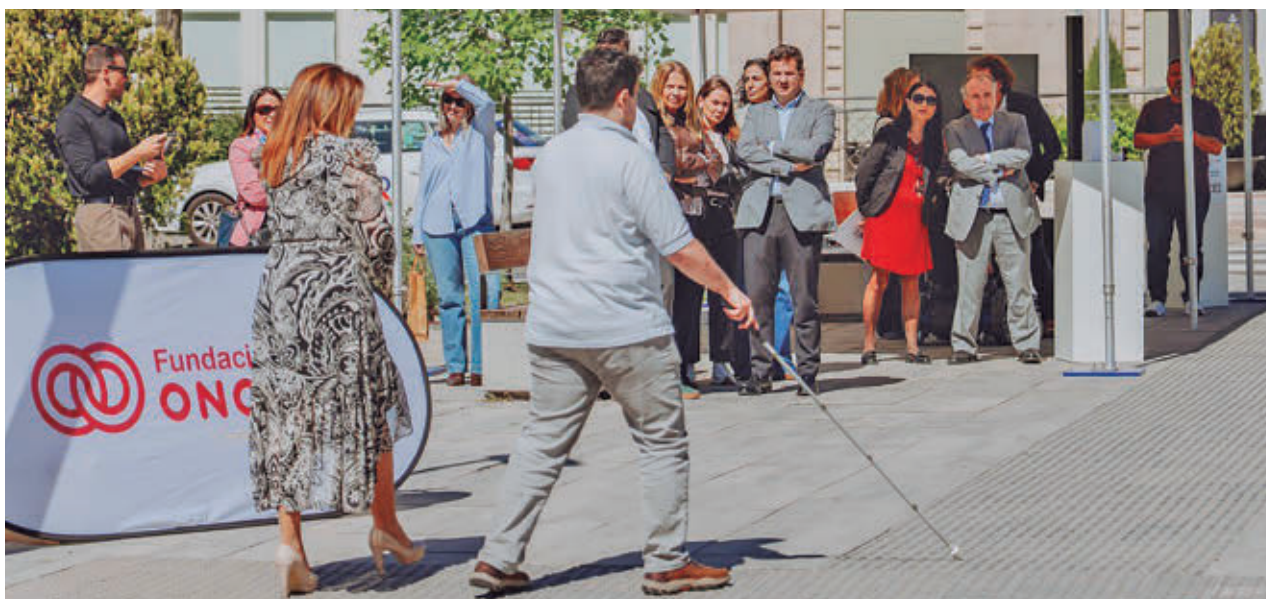
La iniciativa se presentó en el cruce en que se va a probar los próximos dos meses y medio