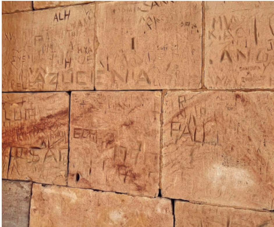
Algunas de las inscripciones que dañan los arcos del Templo de Debod

ESTE ENCLAVE TIENE VIGILANCIA 24 HORAS AL DÍA DURANTE TODA LA SEMANA