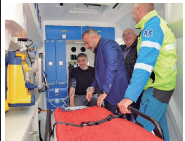
El alcalde entró en el vehículo

Su puesta en marcha permitirá un ahorro global de 900 horas al día a los viajeros, según el estudio realizado por el Ministerio de Transportes y Movilidad Sostenible. Su diseño se ha proyectado como un ejemplo de arquitectura sostenible, con una estructura envolvente, en forma de costillas, que actuará como protección y canalizador.