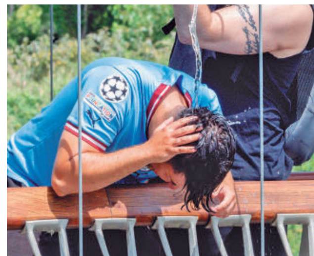
Un hombre se refresca en una fuente