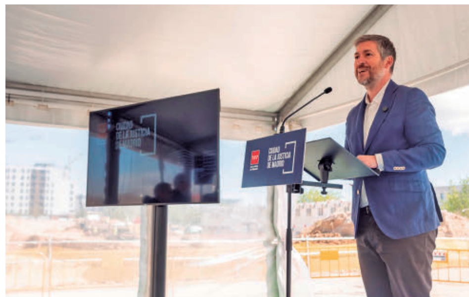
El portavoz regional visitó las obras esta semana

LA PLAZA DE LA JUSTICIA SERÁ CASI TAN GRANDE COMO LA PUERTA DEL SOL