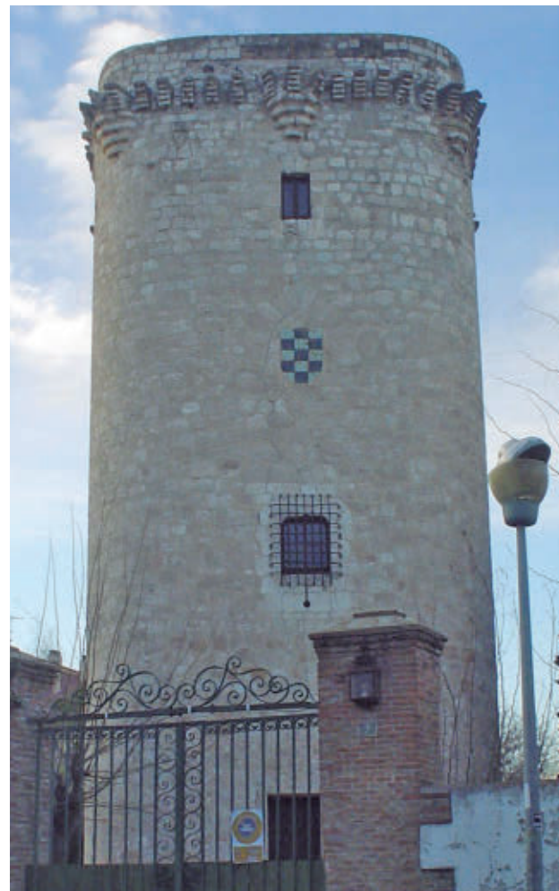
Torre de Éboli en Pinto

La programación se completa con otros dos eventos. El primero de ellos será la conferencia sobre Ruy Gómez de Silva, marido de Ana de Mendoza y conocido como el príncipe de Éboli, un personaje desconocido a día de hoy pero que llegó a ocupar grandes puestos en la Corte de la época. La charla tendrá lugar el viernes 24 en la Casa de la Cadena. El segundo es la