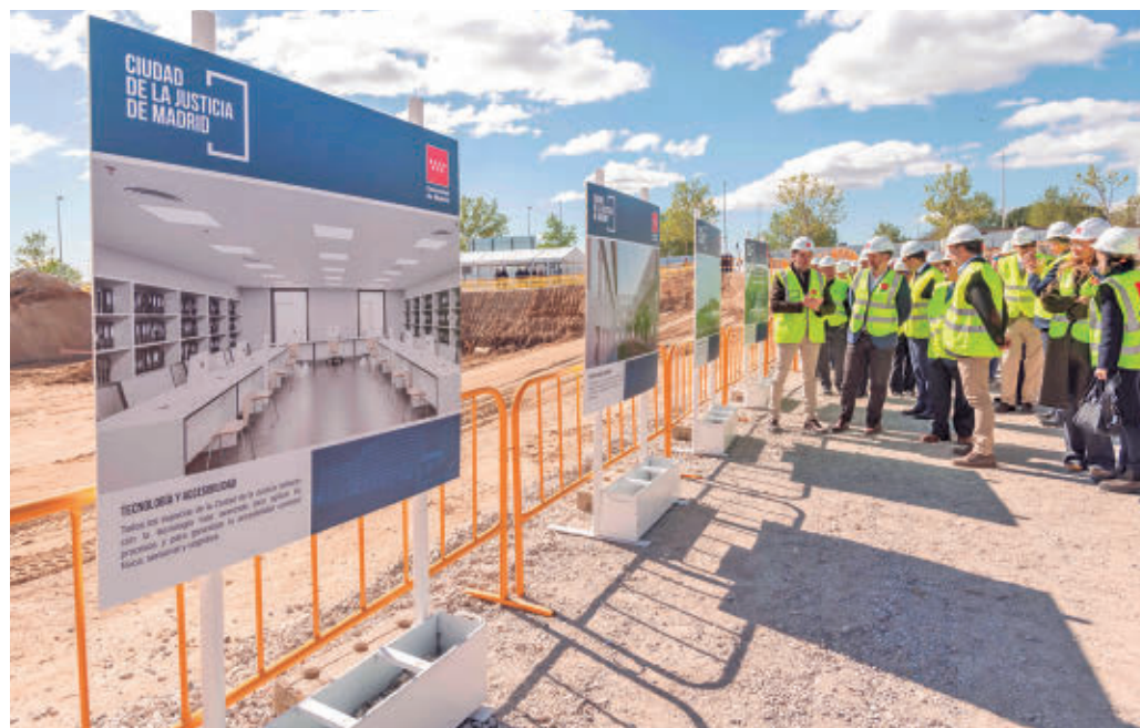
Solar en el que se levantará la Ciudad de la Justicia de la Comunidad de Madrid

La Comunidad de Madrid invertirá 653 millones de euros para construir la Ciudad de la Justicia de la capital en Valdebebas, con un ahorro previsto de 80 millones anuales para las arcas públicas entre alquileres y la concentración de contratos de servicios y suministros. En ella se unificarán 26 sedes judiciales repartidas hasta el momento por la ciudad. Tendrá una superficie construida de más de 470.000 metros cuadrados, lo que representa un aumento del 61% respecto a la suma de toda el área destinada a estos organismos en la actualidad.