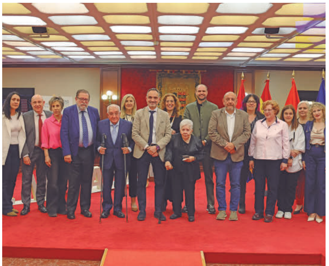
Los ganadores de la XIII de los Premios Mostoleños recibirán el premio en un acto institucional

Pop/Rock' con La Pegatina o la fiesta urbana con La Zowi. También habrá un concierto de la cantante Isabel Aaiún.