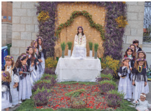
Una de las Mayas de Colmenar Viejo

Uno de los lugares en los que más asentada está la tradición de la Fiesta de la Maya es Colmenar Viejo, donde comenzará este sábado 2 de mayo a las 12 horas con un concierto de la Banda Sinfónica de Colmenar Viejo en la Plaza del Pueblo. A partir de las 17 horas empezará la ex-