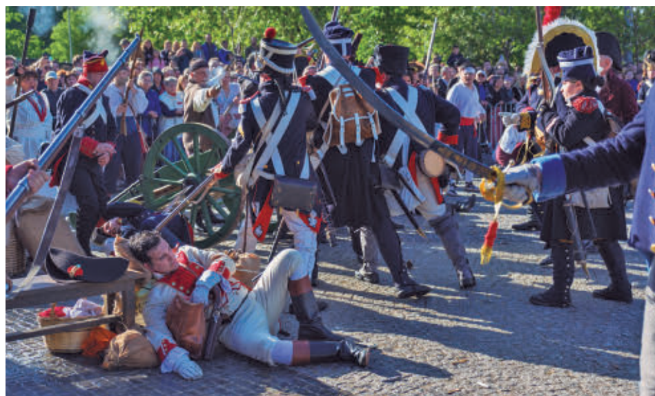
Recreadores caracterizados durante una de las escenificaciones CAM

LA ASOCIACIÓN HISTÓRICO-CULTURAL VOLUNTARIOS DE MADRID 1808-1814: Se trata de una entidad sin ánimo de lucro, declarada de utilidad pública por el Ayuntamiento de Madrid, que reúne a personas de todas las edades y recrea desde hace más de dos décadas los dos Regimientos de Voluntarios de Madrid, constituidos en 1808.