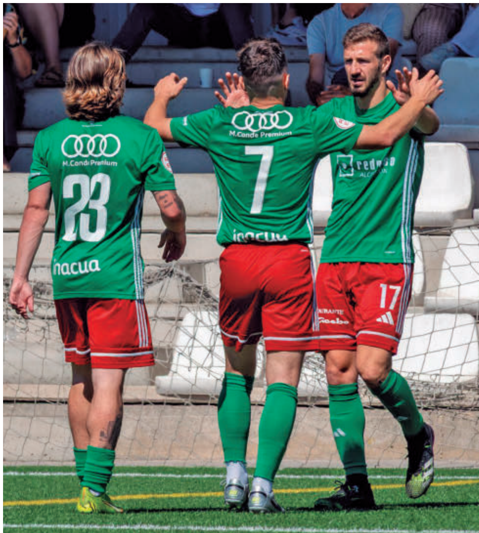
Los jugadores del Trival Valderas celebran un gol TRIVAL VALDERAS

La última plaza para jugar ese play-off está ahora mismo en poder del Leganés B (51 puntos), que este fin de semana