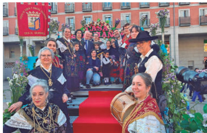
Uno de los altares de Las Mayas de Leganés

EN LEGANÉS LA FESTIVIDAD TENDRÁ LUGAR EL SÁBADO 9 DE MAYO