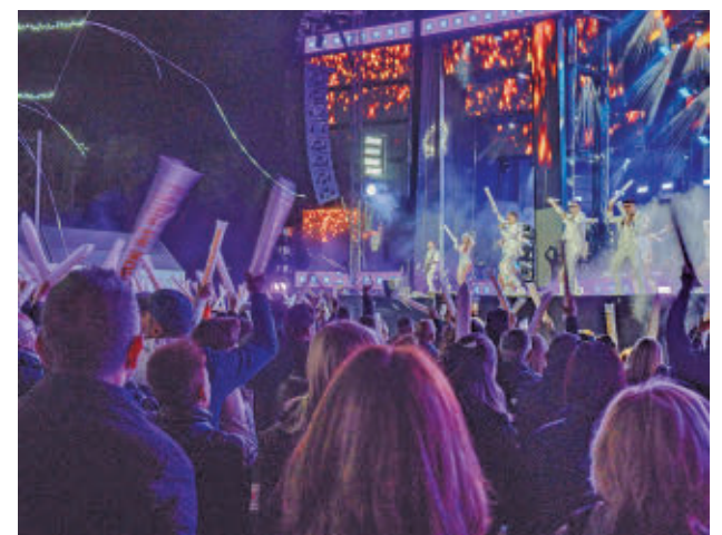
La música será otro de los grandes reclamos de esta edición