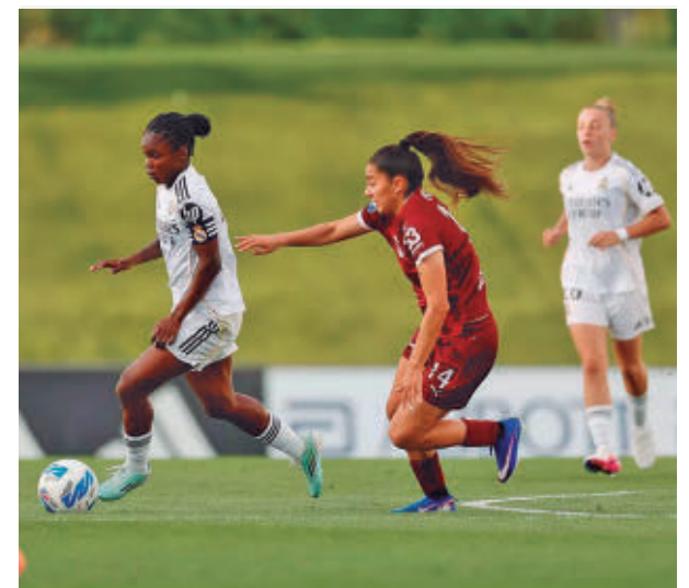
Último partido liguero del Real Madrid REAL MADRID

En el extremo opuesto se encuentra el otro equipo de la región, el Madrid CFF, que acumula cinco partidos sin ganar y no suma tres puntos de una tacada desde su victoria ante el Alhama el 21 de febrero. El sábado 2 a las 16:30 horas visita el campo del Dux Logroño.