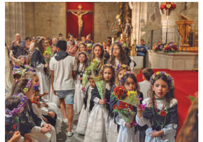
Ofrenda floral en la Basílica de Colmenar