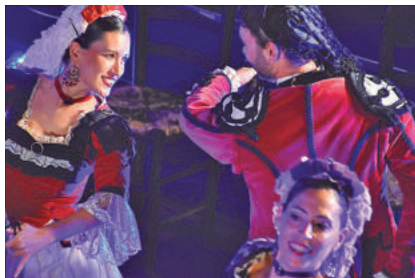
Se recuperan canciones y danzas populares

La cita reunirá a agrupaciones de distintas comunidades autónomas: