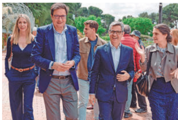
Celebración del PSOE-M del pasado año.

El año pasado el PSOE organizaba una fiesta en la Rosaleda del Parque del Oeste por el Dos de Mayo como respuesta a la negativa del Gobierno de Isabel Díaz Ayuso de invitar a ningún miembro del