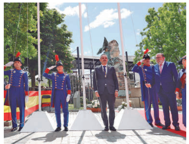
La programación se desarrollará hasta el domingo 3 de mayo