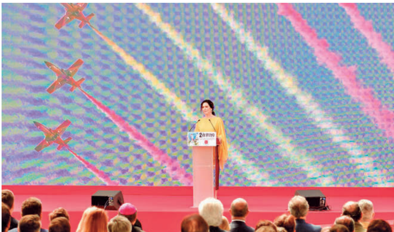
Isabel Díaz Ayuso, durante una celebración del Dos de Mayo en la Puerta del Sol.