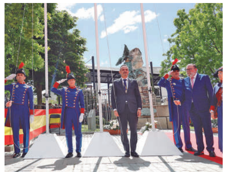
La programación se desarrollará hasta el domingo 3 de mayo

los gustos. Destacan las actuaciones de David Otero, que cerrará las fiestas el domingo 3 de mayo, junto a citas como 'La Noche