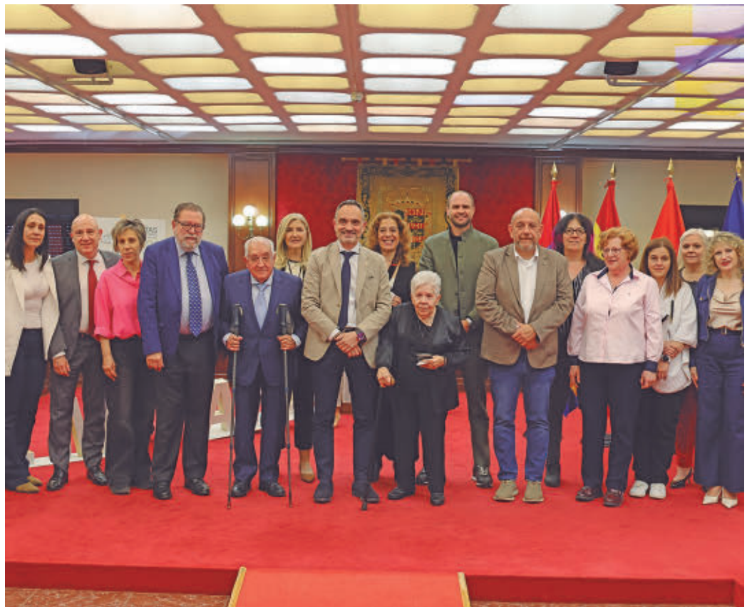
Los ganadores de la XIII de los Premios Mostoleños recibirán el premio en un acto institucional