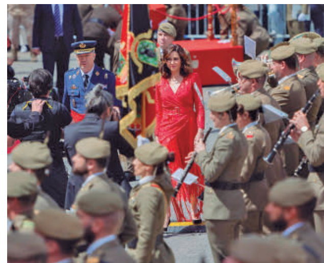
Última parada militar en la Puerta del Sol

COMUNIDAD ESTE: ALCALÁ | COSLADA | TORREJÓN | SAN FERNANDO | ARGANDA | RIVAS