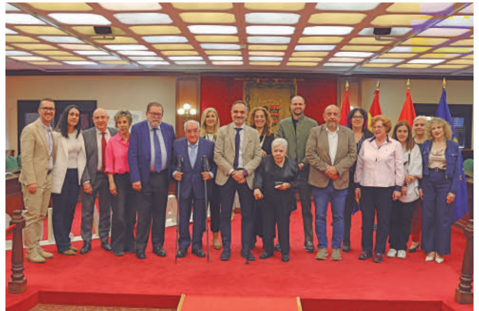
Los ganadores de la XIII de los Premios Mostoleños recibirán el premio en un acto institucional

‘LA LIBERTAD SE CELEBRA’, LEMA DEL 2 DE MAYO