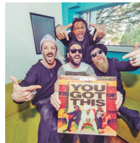
Skindred presentará su nuevo disco