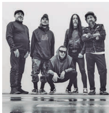
Hamlet hace doblete: Viña y Extremúsika