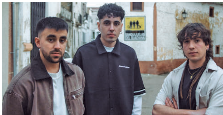
SANGUIJUELAS DEL GUADIANA: Una de las bandas extremeñas con mayor proyección del momento se define como "una mezcla de lo rural con lo contemporáneo" y llevará su propuesta a varios escenarios en este puente, con presencia en festivales como el Extremúsika y el Warm Up.

Por su parte, Rocanrola, en Alicante, reúne a más de un centenar de artistas del ámbito del hip hop y el rap, como Kase.O, Nach, Delaossa o Hijos de la Ruina, en un recinto con cinco escenarios diferenciados. El evento incluye actividades paralelas en la zona Living Park, como grafiti en vivo, baloncesto freestyle o competiciones urbanas, además de lanzaderas gratuitas para facilitar el acceso desde distintos puntos del entorno.