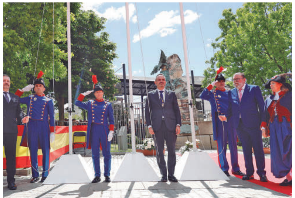
La programación histórico-cultural y festiva se desarrollará hasta el domingo 3 de mayo