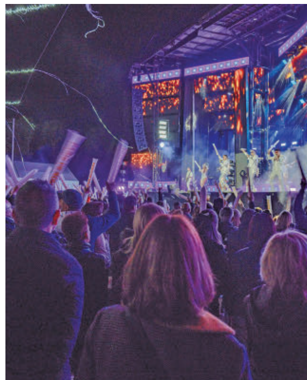
La música será otro de los grandes reclamos de esta edición

tóricos y la entrega de los Premios Mostoleños 2026.