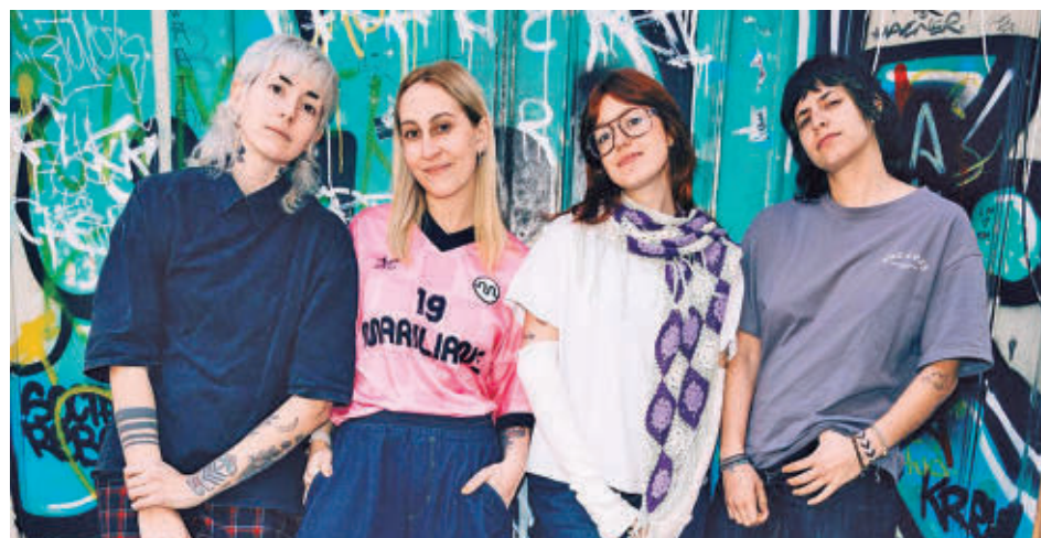
La banda Ginebras, con nuevo trabajo este 2026, estará este viernes en el Warm Up