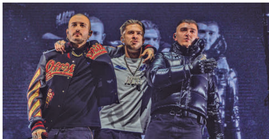
Hijos de la Ruina, formado por Natos y Waor junto a Recycled, pisará el escenario del Rocanrola