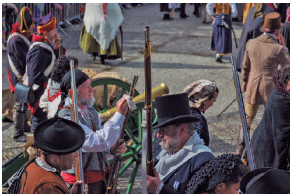
LA ASOCIACIÓN HISTÓRICO-CULTURAL VOLUNTARIOS DE MADRID 1808-1814: Se trata de una entidad sin ánimo de lucro, declarada de utilidad pública por el Ayuntamiento de Madrid, que reúne a personas de todas las edades y recrea desde hace más de dos décadas los dos Regimientos de Voluntarios de Madrid, constituidos en 1808.