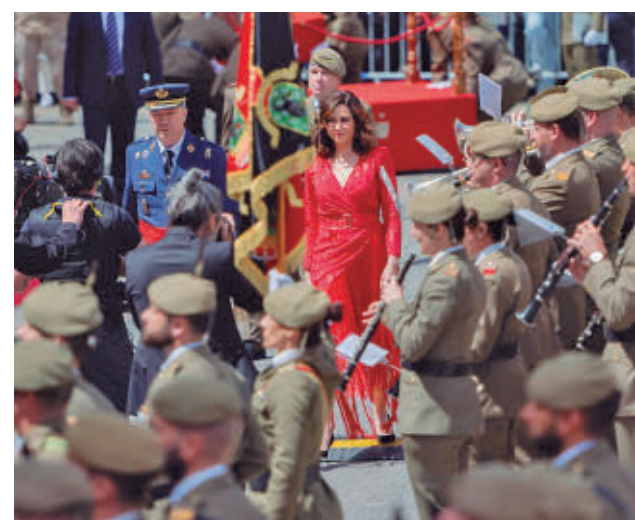
Última parada militar en la Puerta del Sol.

La Asociación Histórico-Cultural Voluntarios de Madrid 1808-1814 organiza varias recreaciones históricas a lo largo del fin de semana para recordar la reacción popular de los madrileños a la invasión napoleónica. Este viernes 1 de mayo estarán en Torrejón de Ardoz y en el distrito de Vicálvaro, mientras que el sábado 2 se trasladarán al centro de la capital para recordar los episodios más destacados.