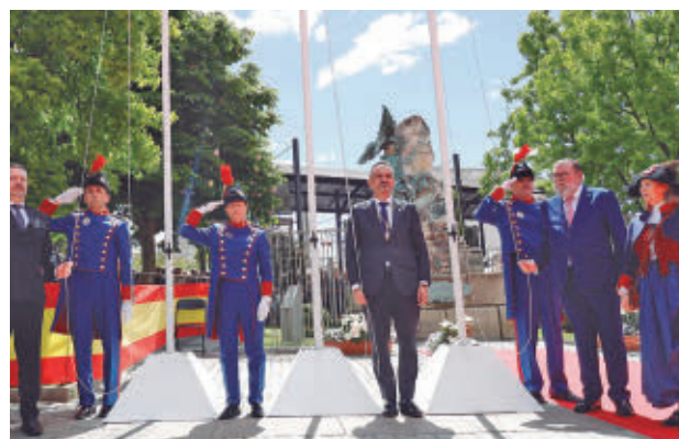
La programación festiva se desarrollará hasta el 3 de mayo

se celebrarán actos como la imposición de la corona de laurel en distintos puntos históricos y la entrega de los Premios Mostoleños 2026.