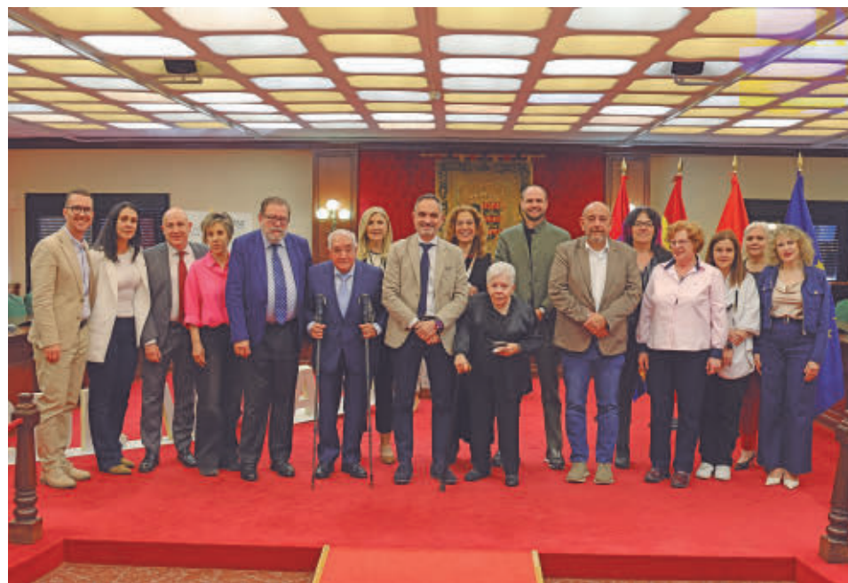
Los ganadores de la XIII de los Premios Mostoleños recibirán el premio en un acto institucional