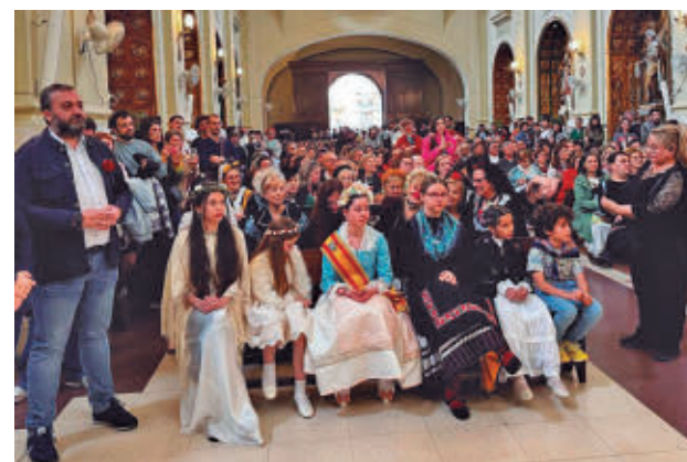
TAMBIÉN EN LA CAPITAL: Lavapiés es el barrio de Madrid donde más se celebra la Fiesta de la Maya. Será el domingo 10 en los alrededores de la plaza de Lavapiés, donde habrá música y baile y se repartirán rosquillas y vinos de la región.

menzará este sábado 2 de mayo a las 12 horas con un concierto de la Banda Sinfónica de Colmenar Viejo en la Plaza del Pueblo. A partir de las 17 horas empezará la exposición de las seis Mayas con sus respectivos grupos de niñas, que se repartirán por varios emplazamientos del casco urbano, como la propia Plaza del Pueblo, la calle Feria o la calle Marqués de Santillana. A las 19 horas, las niñas se dirigirán a la Basílica de