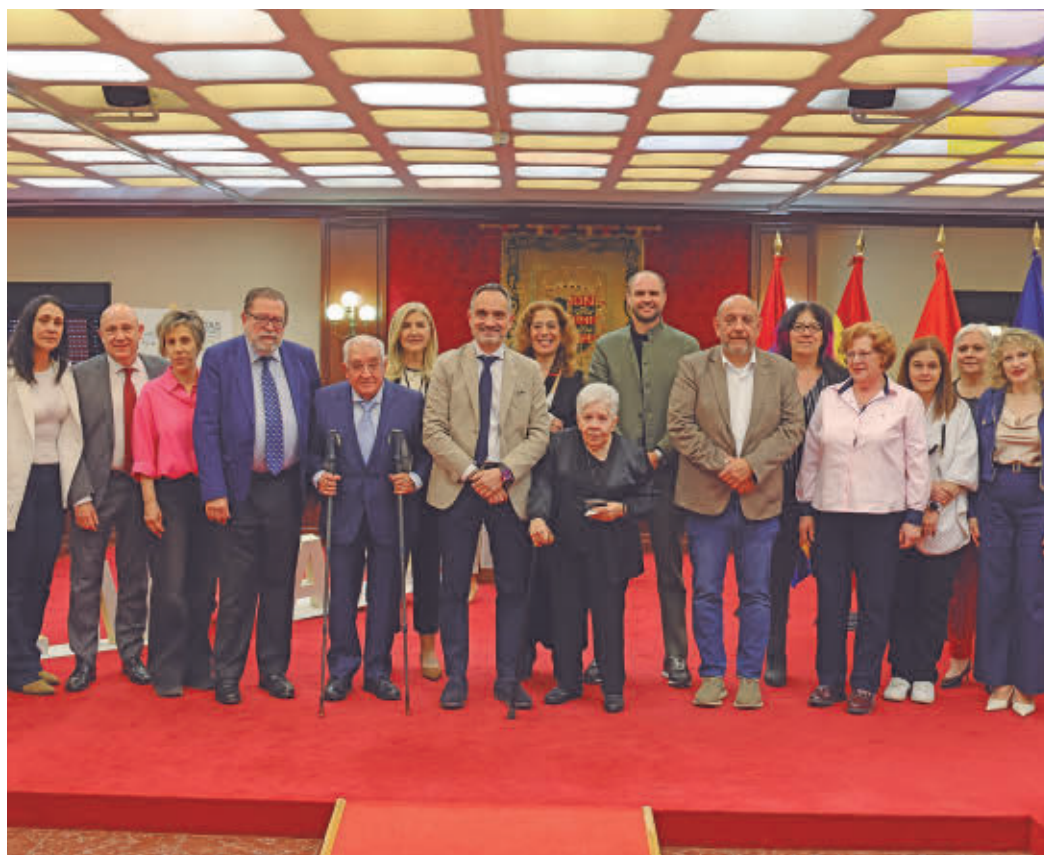
Los ganadores de la XIII de los Premios Mostoleños recibirán el premio en un acto institucional