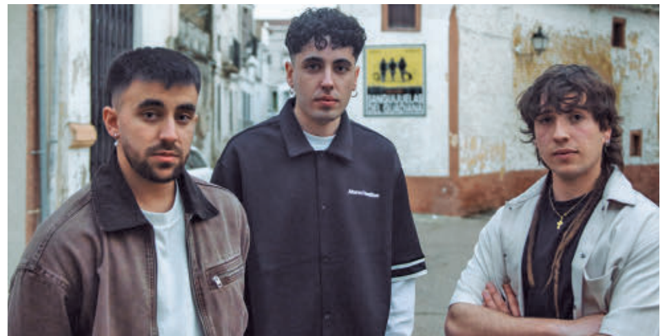
SANGUIJUELAS DEL GUADIANA: Una de las bandas extremeñas con mayor proyección del momento se define como "una mezcla de lo rural con lo contemporáneo" y llevará su propuesta a varios escenarios en este puente, con presencia en festivales como el Extremúsika y el Warm Up.

Por su parte, Rocanrola, en Alicante, reúne a más de un centenar de artistas del ámbito del hip hop y el rap, como Kase.O, Nach, Delaossa o Hijos de la Ruina, en un recinto con cinco escenarios diferenciados. El evento incluye actividades paralelas en la zona Living Park, como grafiti en vivo, baloncesto freestyle o competiciones urbanas, además de lanzaderas gratuitas para facilitar el acceso desde distintos puntos del entorno.