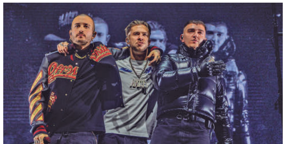
Hijos de la Ruina, formado por Natos y Waor junto a Recycled, pisará el escenario del Rocanrola