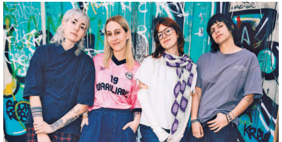
La banda Ginebras, con nuevo trabajo este 2026, estará este viernes en el Warm Up C. LUJÁN/E.P