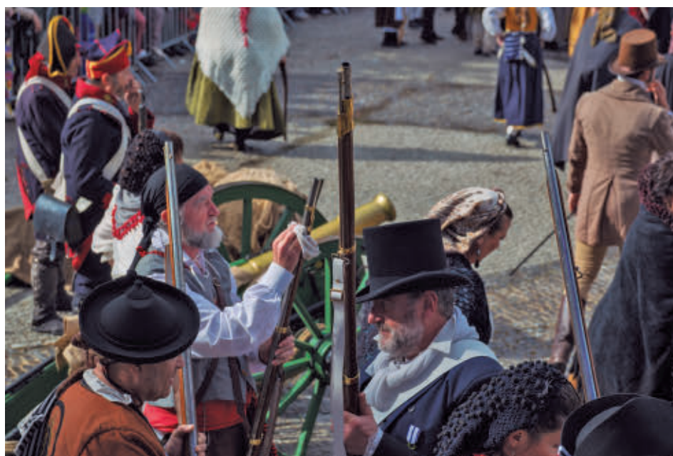
LA ASOCIACIÓN HISTÓRICO-CULTURAL VOLUNTARIOS DE MADRID 1808-1814: Se trata de una entidad sin ánimo de lucro, declarada de utilidad pública por el Ayuntamiento de Madrid, que reúne a personas de todas las edades y recrea desde hace más de dos décadas los dos Regimientos de Voluntarios de Madrid, constituidos en 1808.