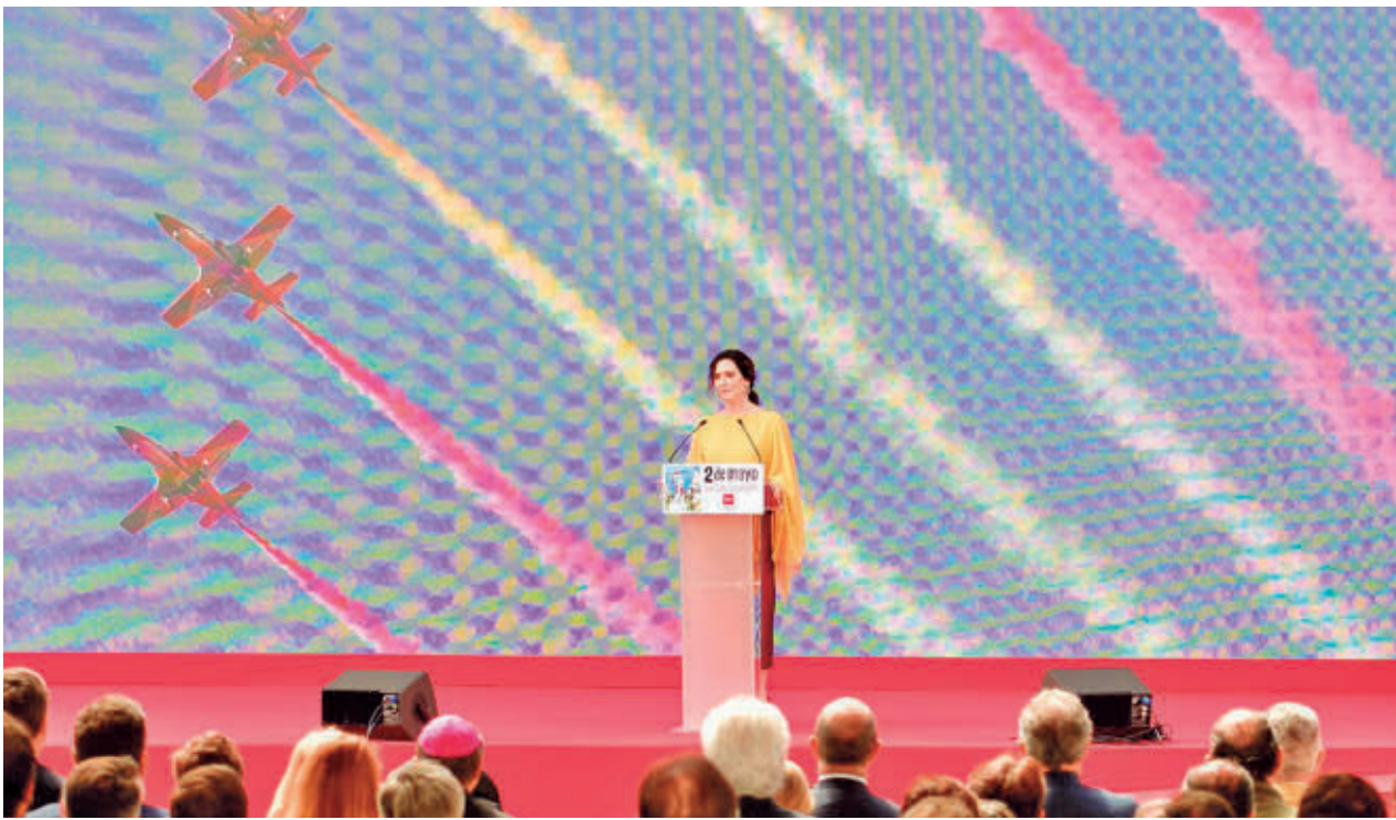
Isabel Díaz Ayuso, durante una celebración del Dos de Mayo en la Puerta del Sol