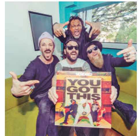
Skindred presentará su nuevo disco