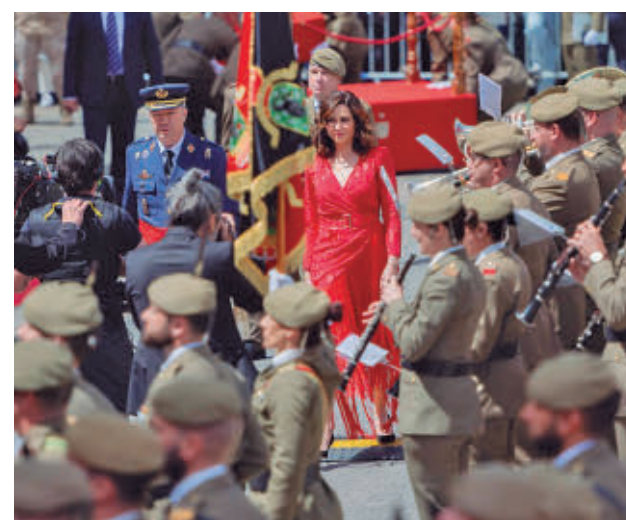
Última parada militar en la Puerta del Sol

Con el Atlético de Madrid C ya ascendido a Segunda RFEF, el grupo VII celebra este fin de semana su penúltima jornada con la mirada puesta en la parte alta de la clasificación