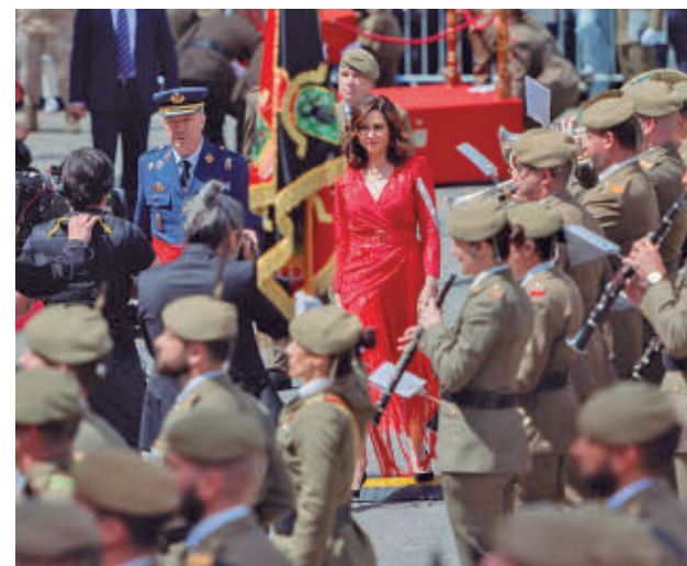
Última parada militar en la Puerta del Sol

Con el Atlético de Madrid C ya ascendido a Segunda RFEF, el grupo VII celebra este fin de semana su penúltima jornada con la mirada puesta en la parte alta de la clasificación