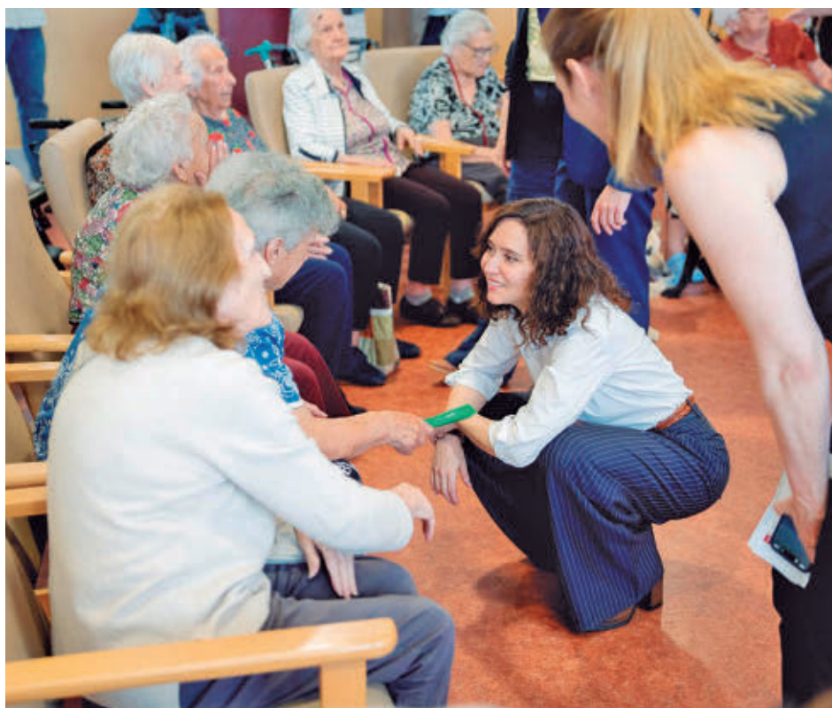
Isabel Díaz Ayuso, durante la presentación

La primera residencia estará en Las Rosas, en el distrito de San Blas, y el segundo proyecto se construirá en Vicálvaro, en concreto en El Cañaveral. Los centros se ubicarán en 13 distritos de Madrid y 18 municipios de la región. En concreto, se podrán encontrar en Hortaleza, Fuencarral, Carabanchel, Moncloa-Aravaca, Usera, Villaverde, Villa de Vallecas, Moratalaz, Barajas, Puente de Vallecas y Ciudad Lineal. Más allá de Madrid capital, se ubicarán en Lega-