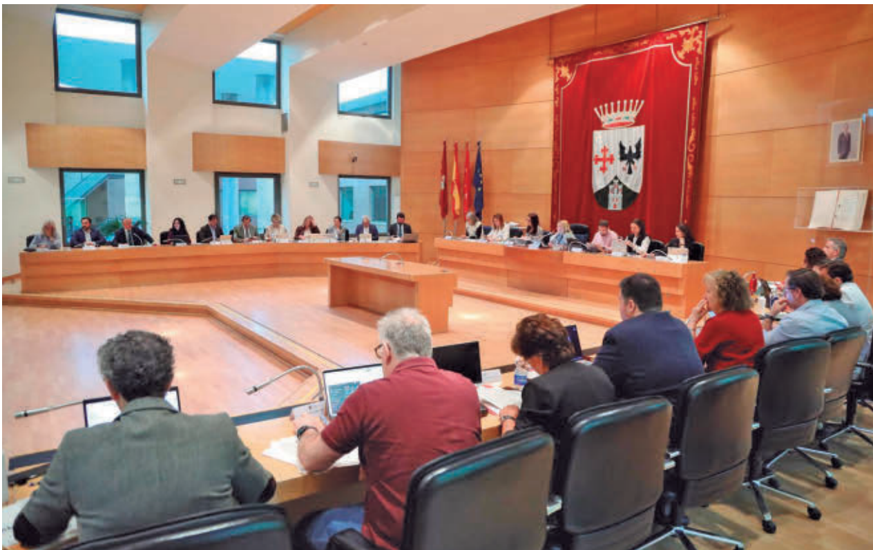
Un momento de la sesión celebrada el pasado 30 de abril AYUNTAMIENTO DE ALCOBENDAS