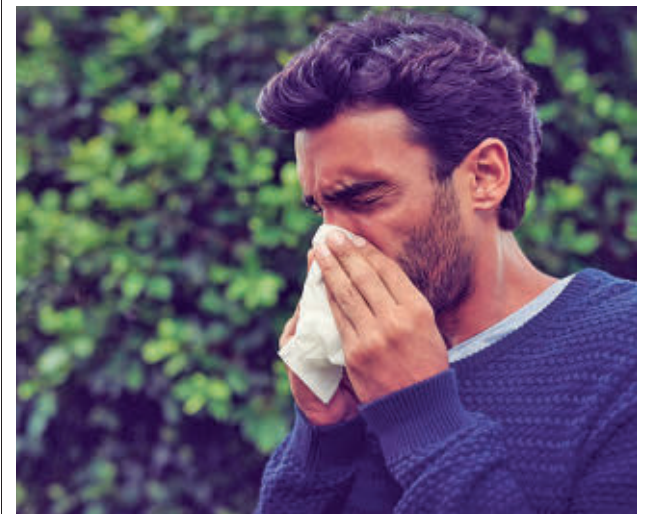
El Gobierno regional se prepara para las alergias