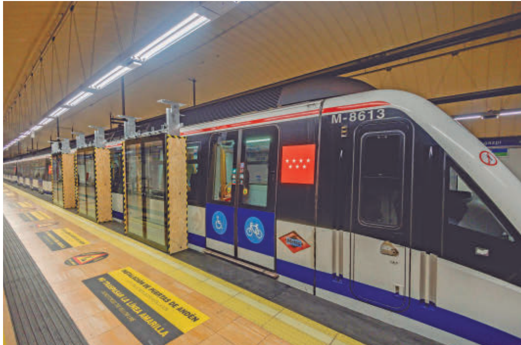
Actuación en los andenes de la Línea 6 de Metro

Esta semana se ha adjudicado el contrato, que contará con un plazo de ejecución de diez meses. Las obras permitirán ajustar la altura de los andenes en todas las estaciones de la L6 para poder