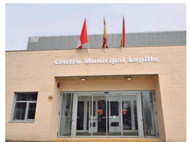
Fachada del Centro Municipal Lopillo

Hay que recordar que el arbitraje de consumo es una institución jurídico-procesal que permite resolver, de forma vinculante y ejecutiva, los conflictos que puedan surgir evitando la vía judicial ordinaria.