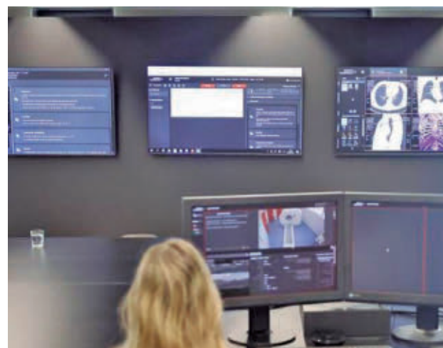
La tecnología, al servicio de la salud

Palinocam funciona desde 1993, con diez captadores volumétricos en distintos puntos de la región: Alcalá de Henares, Alcobendas, Aranjuez, Collado Villalba, Coslada, Getafe, Las Rozas de Madrid, y tres ubicaciones en Madrid capital (Barrio de Salamanca, Arganzuela y Ciudad Universitaria).