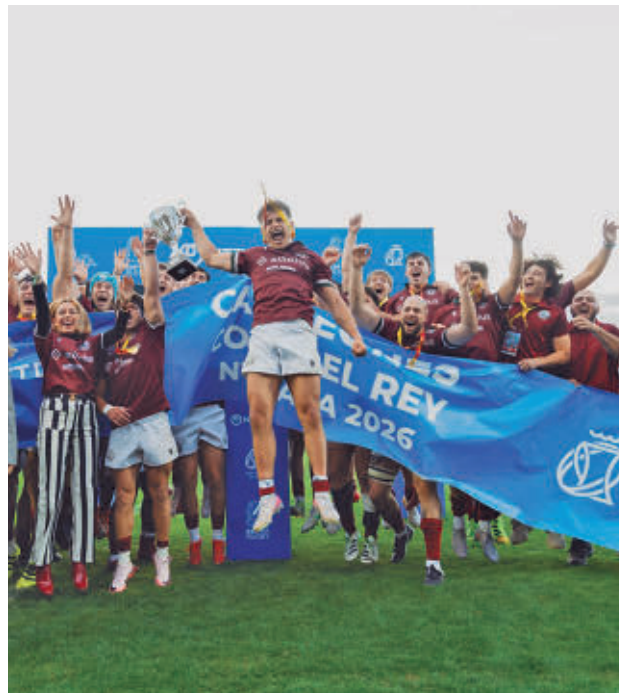
Celebración del Silicius Alcobendas Rugby

El primer fin de semana de mayo fue sinónimo de éxitos para el rugby madrileño. El estadio Ontime Butarque se convirtió en el epicentro nacional de este deporte el pasado sábado 2 de mayo acogiendo las finales de la Copa del Rey y de la Copa de la Reina, dos competiciones que acabaron marchándose a las vitrinas de dos equipos de la