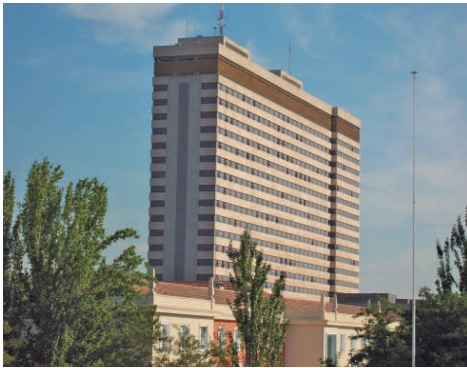
Hospital de la Defensa Gómez Ulla

aeropuerto de Torrejón de Ardoz, desde donde se desplazarán al Hospital Gómez Ulla del distrito de Carabanchel. En este centro sanitario serán de nuevo examinados y pasarán una cuarentena cuyo tiempo de duración se determinará en función de su estado. El Ministerio de Sanidad ha habilitado y aislado una planta entera del centro para que no tengan contacto con ningún otro paciente.