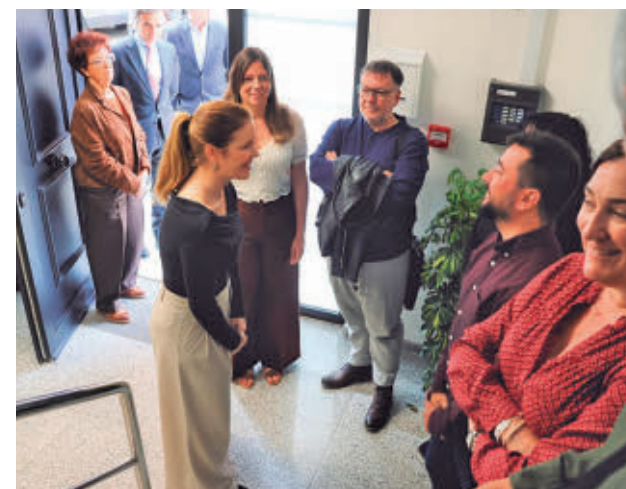
Visita de la consejera al nuevo centro

Los servicios sanitarios atienden cada año a una media de 100 hombres víctimas de violaciones y agresiones sexuales, en su mayoría en el contexto del 'chemsex'. Este centro está destinado a ofrecer continuidad a la atención sanitaria para este tipo de situaciones, así como a otros perfiles, como varones en situación de prostitución que han sido víctimas de violencia sexual.