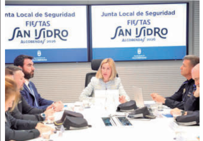
Junta Local de Seguridad

Estas botellas se repartirán hasta fin de existencias en todos los centros municipales, en el mercadillo municipal los miércoles 13 y 27 de mayo y en las zonas cercanas a pipicanes, el 11 de mayo en la calle Monte Perdido, el día 14 en la calle Teide, el 18 en la avenida Hayedo de Montejo, y el 25 en la calle Alonso Zamora.