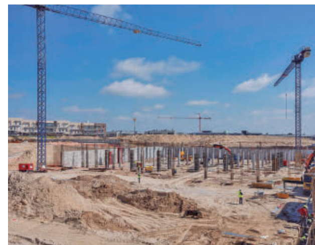
Viviendas en construcción

Se estima que esta colaboración generará hasta 900 millones de euros de inversión inmobiliaria en terrenos ya preparados para edificar y que iniciarán su construcción en los próximos dos años.