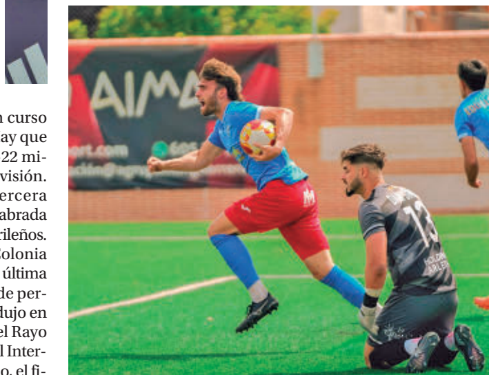
Los temidos arrastres: Los tres descensos de equipos madrileños desde Segunda Federación condicionan a su vez al Grupo 7 de Tercera, donde podrían doblarse el número de equipos que caerán a Autonómica: de los 3 iniciales podría llegarse a 6.

en Segunda Federación tras la agónica salvación del año pasado en el campo del Guadalajara.