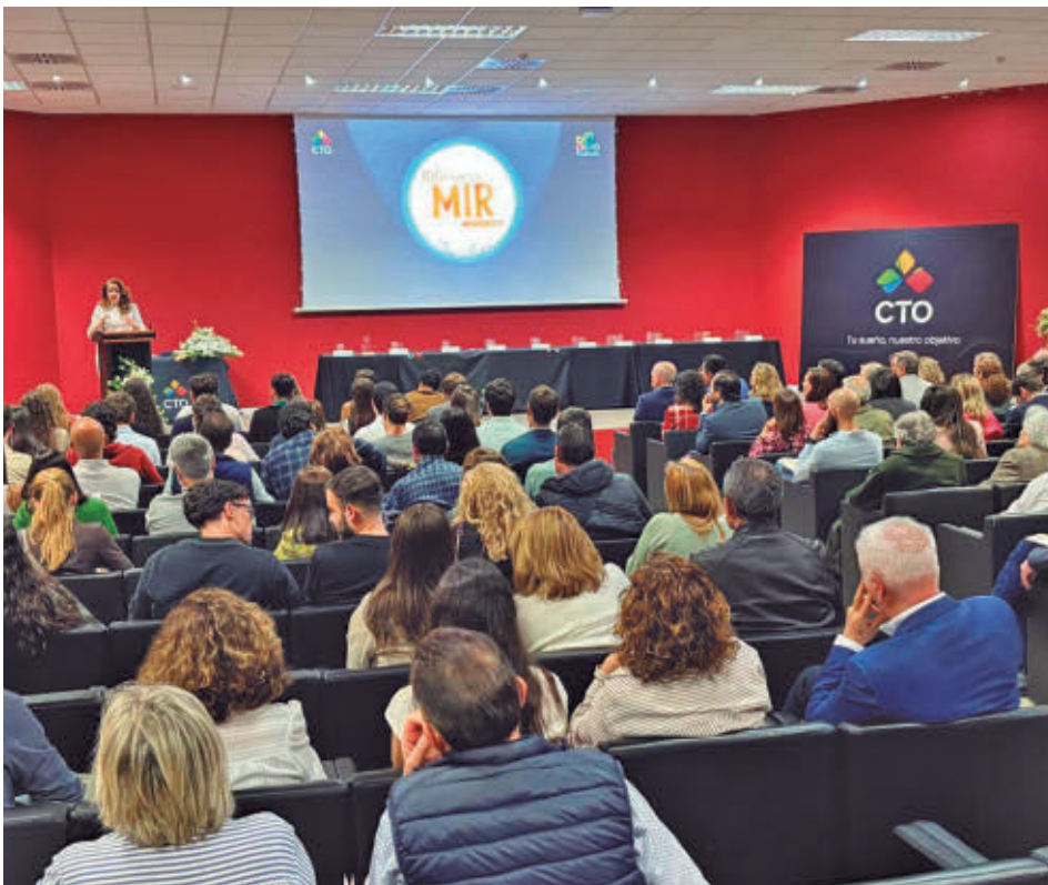
Acto de reconocimiento a los médicos que han hecho el MIR