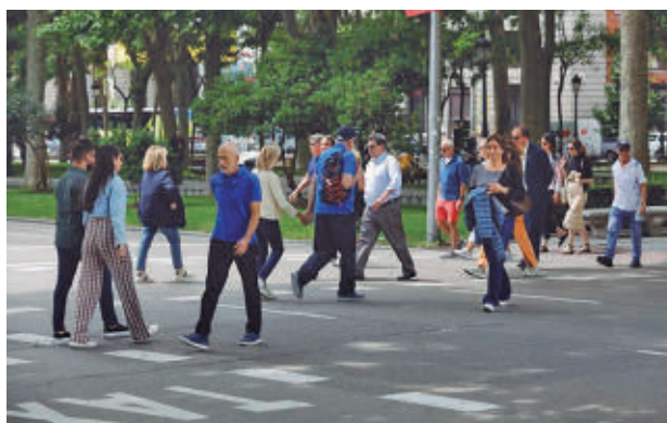
Varios viandantes cruzan el paseo del Prado

Tras el máximo histórico alcanzado el año anterior, la población se situó en 3.497.277 habitantes, lo que supone una reducción de 30.647 vecinos (-0,87%) res-