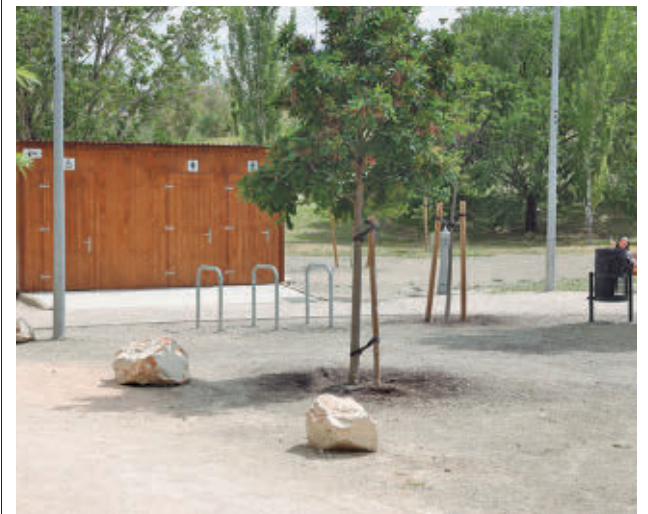
Los nuevos baños realizados en madera

El punto y final lo pondrá la actuación de Diego Guerrero, dos veces nominado al Premio Latin Grammy al Mejor Álbum de Música Flamenca (domingo 24, 20 h.)