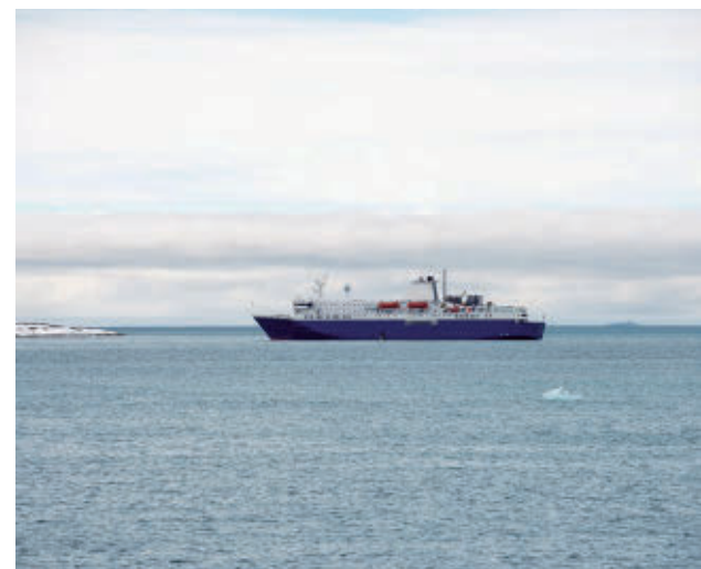
Crucero en el que se ha detectado el brote