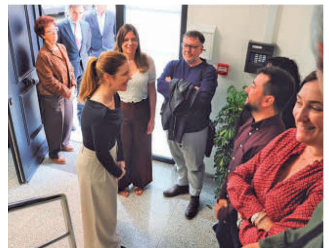
Visita de la consejera al nuevo centro

Los servicios sanitarios atienden cada año a una media de 100 hombres víctimas de violaciones y agresiones sexuales, en su mayoría en el contexto del 'chemsex'. Este centro está destinado a ofrecer continuidad a la atención sanitaria para este tipo de situaciones, así como a otros perfiles, como varones en situación de prostitución que han sido víctimas de violencia sexual.