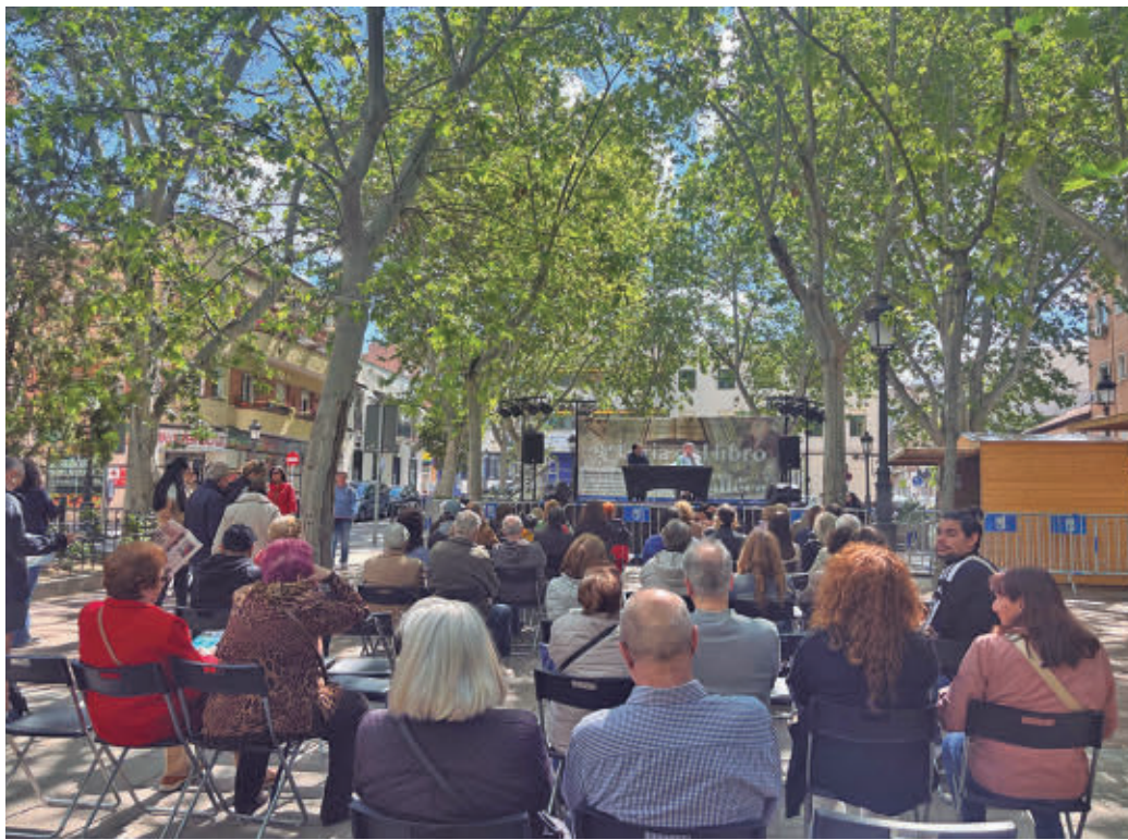
Una de las presentaciones llevadas a cabo el año pasado en el escenario principal L.J.