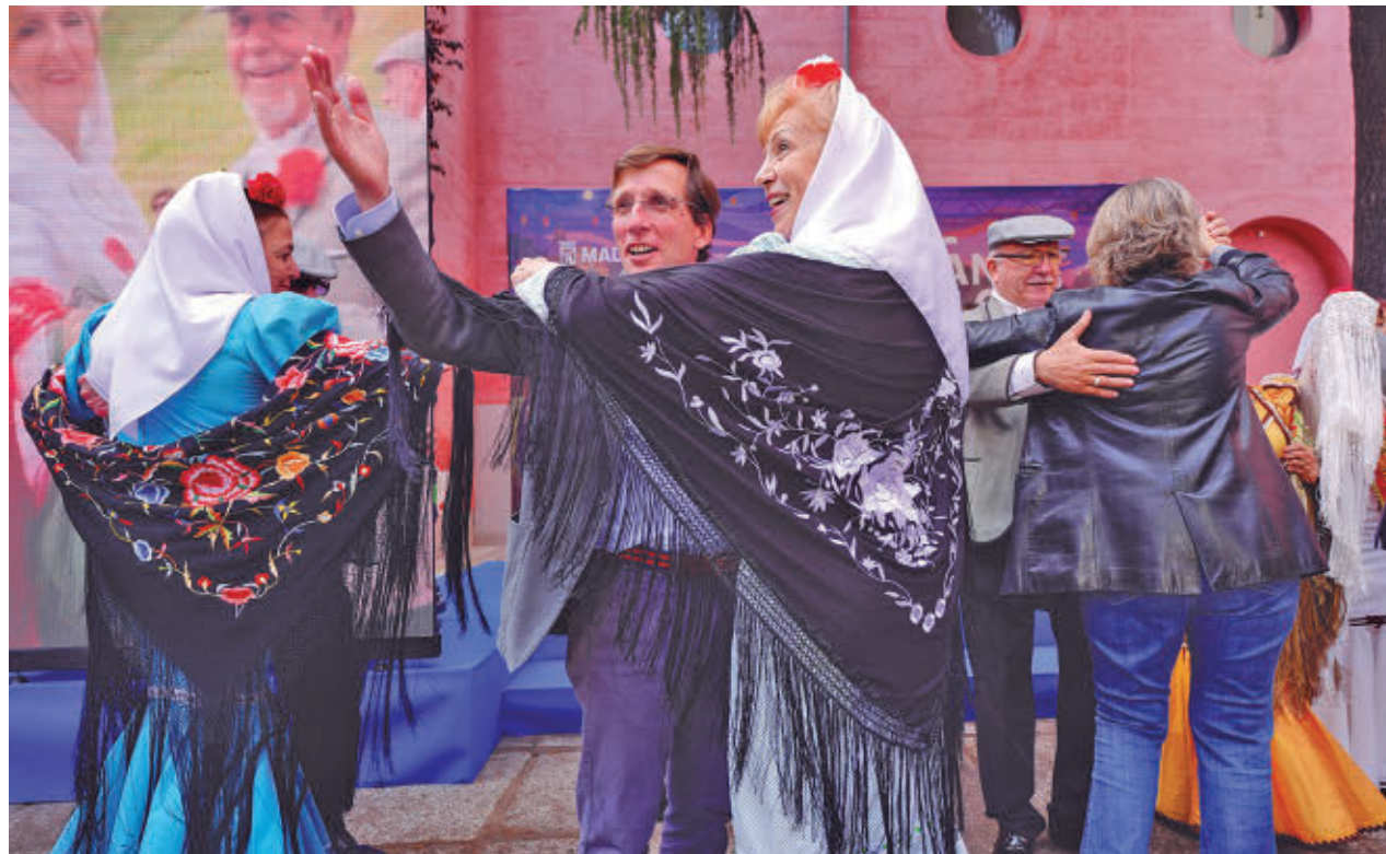
El alcalde bailó un jota en la presentación de la programación de las fiestas