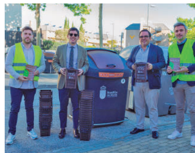
Presentación de la campaña

rán el viernes 8 de 10 a 19 horas y el sábado 9 de 9 a 14 horas. En ellas se hace entrega a los vecinos de un cubo-cesta para la separación de residuos orgánicos en el domicilio y un folleto informativo con indicaciones sobre qué residuos deben depositarse en el contenedor de la fracción orgánica. El contenedor marrón está destinado exclusivamente a residuos orgáni-