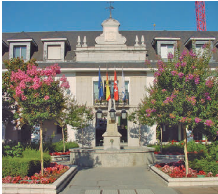
La sede del Ayuntamiento de Majadahonda

En el primero de los barrios, con una superficie supe-