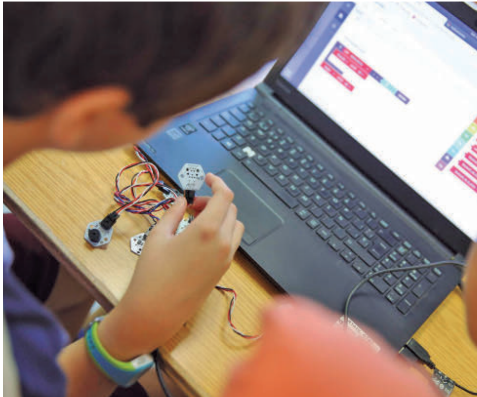
Los jóvenes de Las Rozas tendrán un Club de Robótica e IA

Como punto de partida, el Ayuntamiento ha programa-