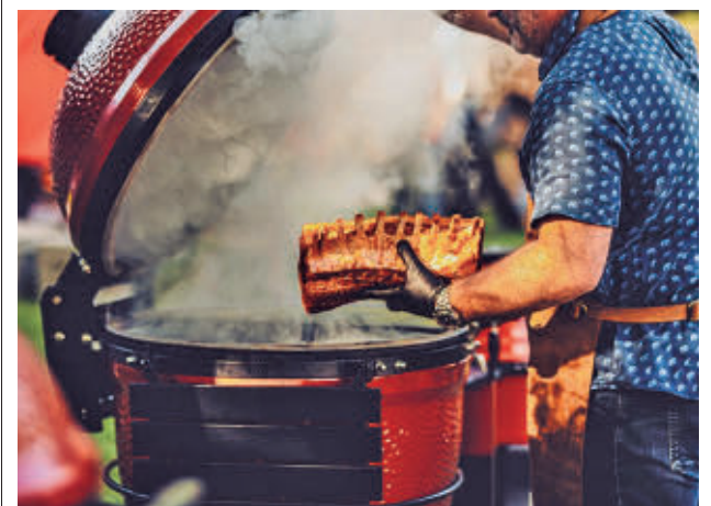
El evento culinario repartirá 30.000 euros en premios

GenteMadrid.es Consulte la actualidad regional y local en nuestra página web