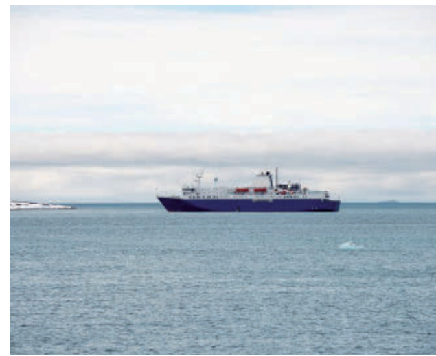
Crucero en el que se ha detectado el brote