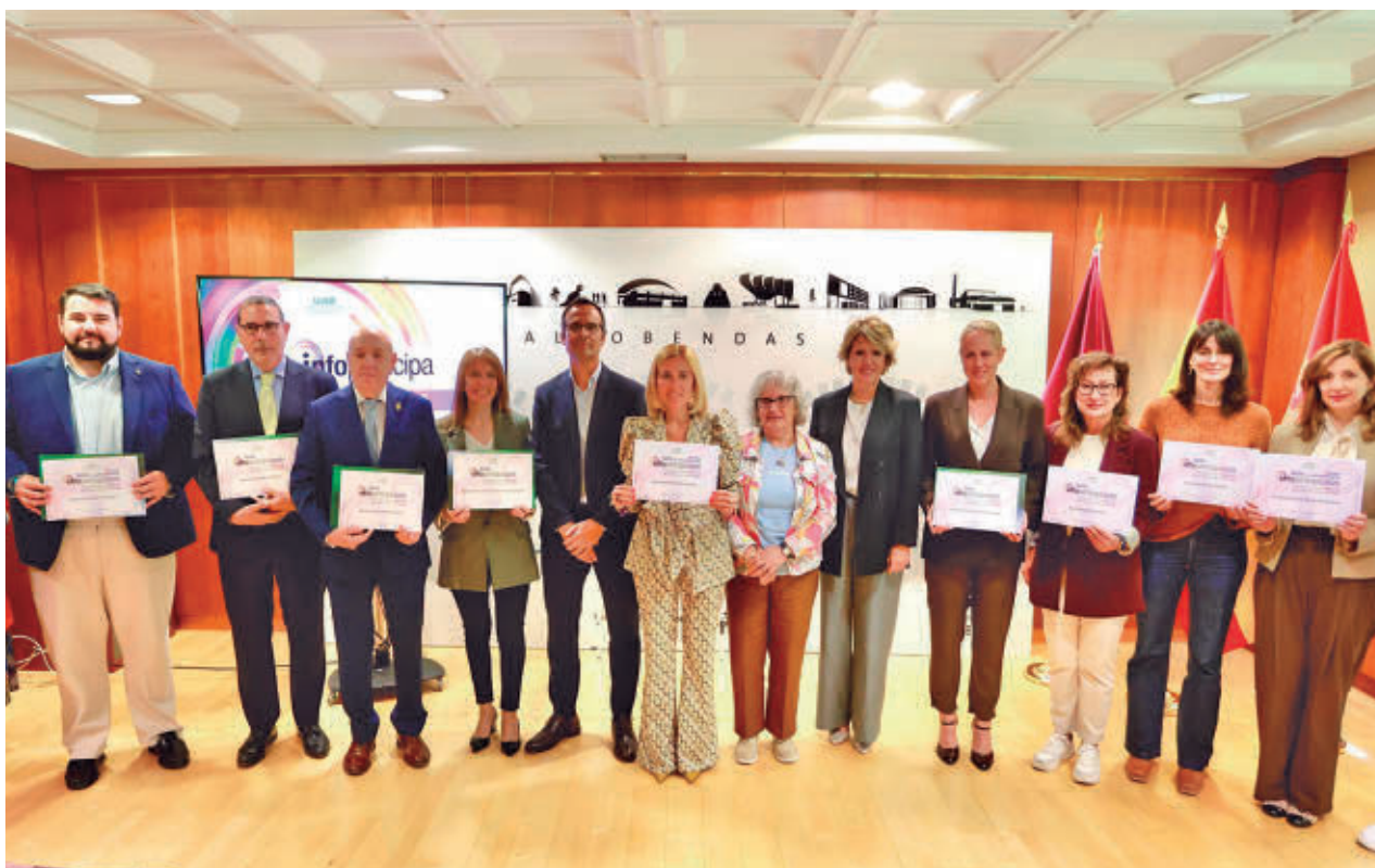
La alcaldesa de Alcobendas, Rocío García Alcántara, junto a otros representantes municipales