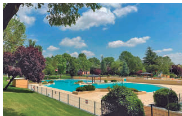
Piscinas del polideportivo municipal

A través de un comunicado, el Consistorio afirma que mantendrá los mismos precios que en los últimos tres