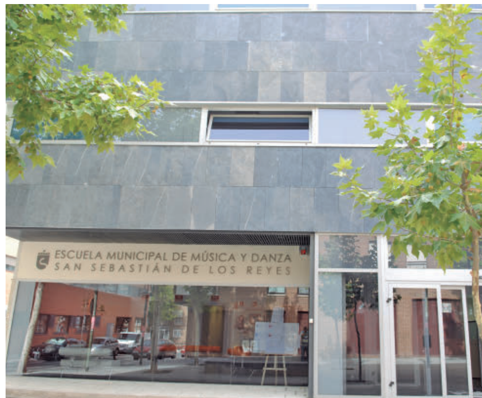
Fachada de la Escuela Municipal de Música y Danza

Consulte la actualidad regional y local en nuestra página web