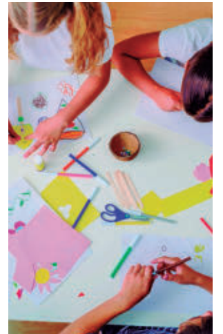
Hay varias modalidades

El plazo de inscripción finaliza el próximo 26 de mayo, mientras que 'Las tardes de junio' se desarrollará entre el 1 y el 19 de junio. Hay diferentes modalidades: una hora sin merienda (46,50 euros) y