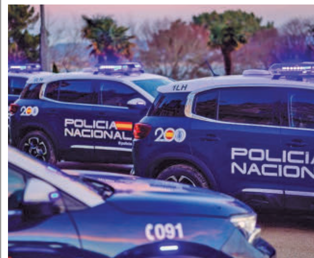
Coches de la Policía Nacional POLICÍA NACIONAL