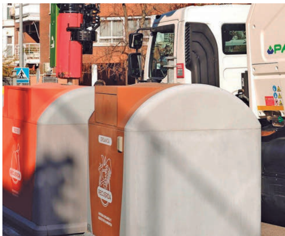
El uso del contenedor marrón continúa creciendo tras su implantación integral AYTO DE ALCORCÓN

El aviso de la empresa de vigilancia activó la respuesta policial y dio inicio a una persecución tanto por la A-5 como por la M-40. Sin embargo, la velocidad de los vehículos permitió a los sospechosos perder a los agentes y desaparecer antes de ser interceptados. La Policía Nacional mantiene abierta la investigación para identificar a los autores del asalto.