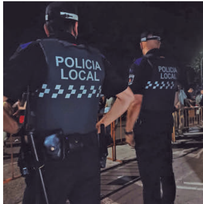
Agentes durante el dispositivo festivo en la ciudad

Desde la organización recuerdan la importancia de acudir a estos espacios ante cualquier situación de acoso o violencia. La regulación incluye también normas específicas para el acceso al recinto de conciertos. No estará permitido entrar con envases de vidrio ni objetos peligrosos, así como pancartas o símbolos que fomenten conductas violentas o discriminatorias. La organización podrá denegar la entrada si considera que existe riesgo.