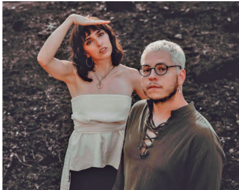
La banda Merino serán los primeros en actuar