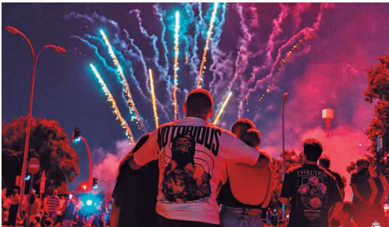
AYTO S.F DE HENARES