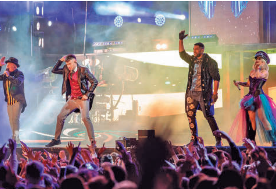
La Orquesta Panorama, San Fernando de Henares será una de las citas imprescindibles