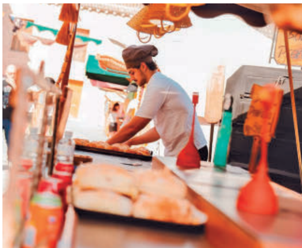
El Mercado vuelve, como cada año AYTO DE S.H DE HENARES