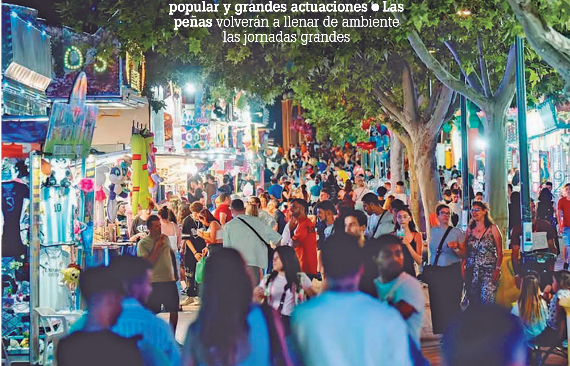
El Recinto Ferial, uno de los puntos de encuentro para vecinos y visitantes

Las fiestas combinarán tradición popular y grandes actuaciones • Las peñas volverán a llenar de ambiente las jornadas grandes