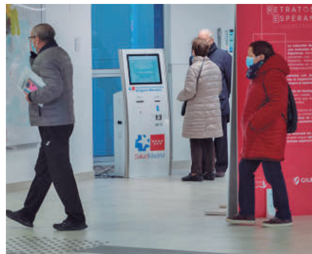
Centro sanitario de la Comunidad de Madrid