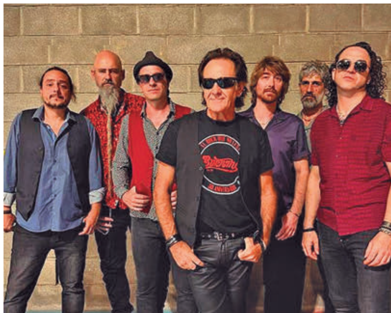
Burning encabezan el cartel del festival 'Sanfer Suen a Rock' BURNING

calle con jornadas de puertas abiertas para mostrar los trabajos realizados durante el curso. A ello se sumarán el concierto de Rocío Durán, el homenaje a personas voluntarias, el reparto de limonada y el baile con la orquesta Vórtice. Para los más pequeños, el domingo 24 de mayo se celebrará el Día de la Infancia y la Juventud en el parque Dolores Ibárruri, con