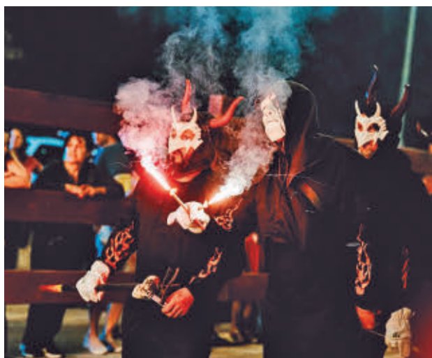
Tras el éxito del año pasado, Correfoc vuelve al municipio

LAS ORQUESTAS VOLVERÁN A MARCAR LAS NOCHES GRANDES