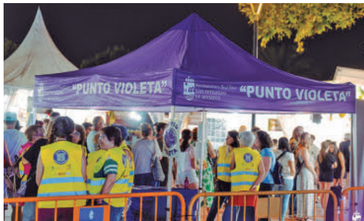
Contempla dos Puntos Violeta y otro itinerante AYTO DE SF DE HENARES