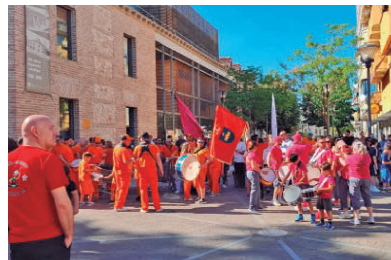
Las Peñas son el alma de la fiesta de San Fernando de Henares

BURNING SERÁ UNO DE LOS GRANDES RECLAMOS DEL CARTEL