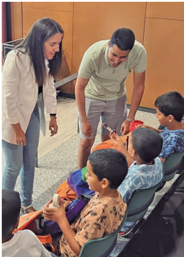
La colaboración con la FCURJC amplía la cobertura sanitaria

HABRÁ EMPASTES, FLÚOR Y LIMPIEZAS SIN COSTE PARA LOS MENORES