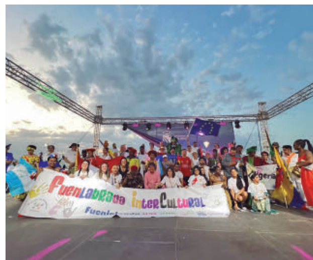
Las asociaciones mostrarán proyectos y tradiciones