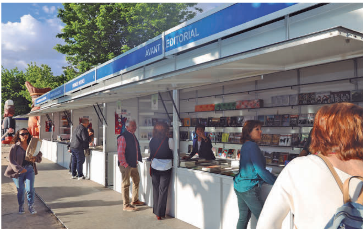
Imagen de una edición anterior de la feria AYTO DE FUENLABRADA