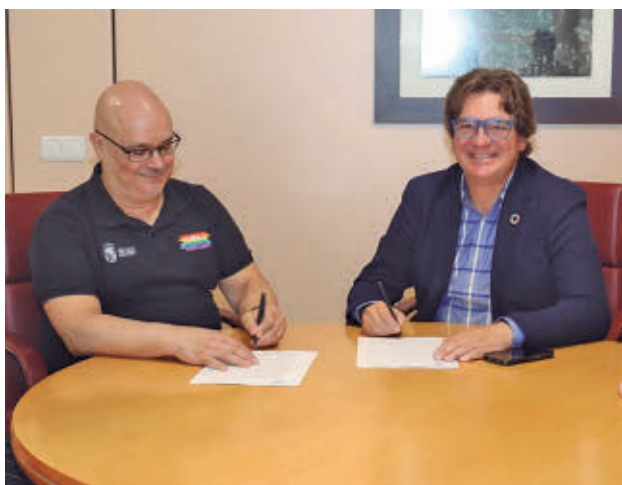
El acuerdo permitirá desarrollar nuevas acciones

El alumnado seleccionado ha realizado su primer rodaje en el mundo laboral en los servicios de Pediatría, Farmacia Hospitalaria, Cardiología, Medicina Intensiva, Radiodiagnóstico, Radioterapia, la Sección de Endocrinología, el Área Quirúrgica y la Unidad de Reanimación, entre otros muchos.