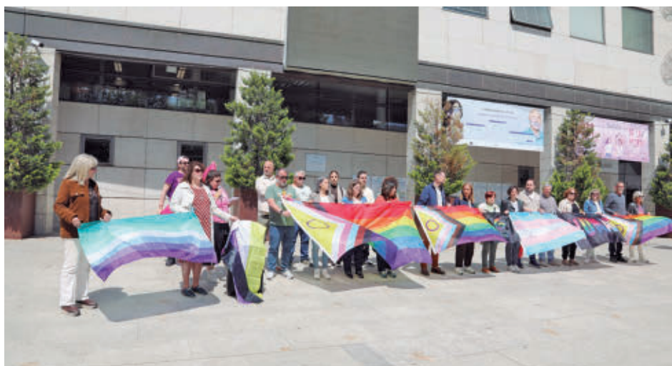
AYTO DE GETAFE

Getafe ha reafirmado este lunes su compromiso con la diversidad, la igualdad y la defensa de los derechos humanos durante la lectura del Manifiesto contra la LGTBIQ+fobia, un acto celebrado junto a integrantes de la Mesa LGTBIQ+ y representantes del Gobierno local.