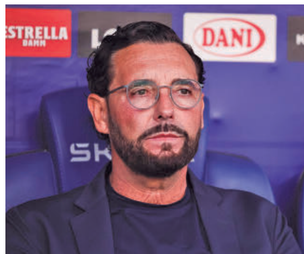
Jose Bordalás, entrenador del Getafe CF