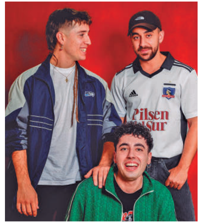
Los miembros del grupo Sanguijuelas del Guadiana