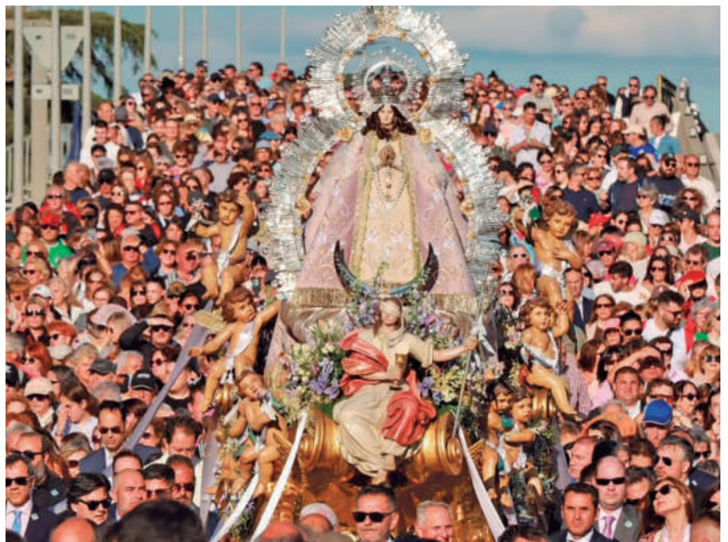
Unos 50.000 vecinos acompañaron a la Virgen en la tradicional bajada desde el Cerro de los Ángeles

La Plaza de la Constitución recupera además protagonismo con orquestas, copla, zarzuela y bailes regionales, buscando un ambiente más cercano y familiar. El Parque Lorenzo Azofra volverá a ser territorio Cultura Inquieta y el Espacio Joven en el Polideportivo Juan de la Cierva mantendrá la actividad hasta la madrugada con DJs y sesio-