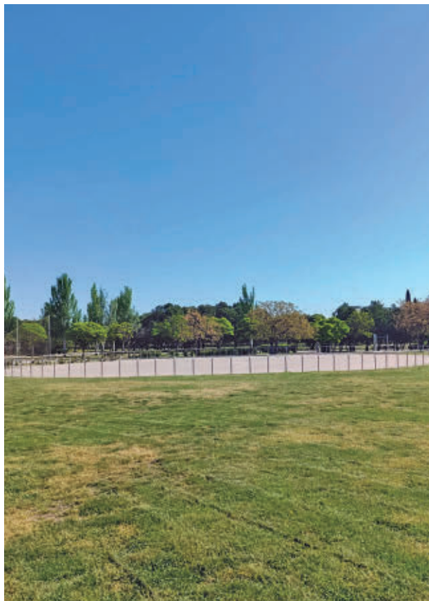
El Parque Andalucía-Ciudad de los Niños GENTE

DESDE CULTURA DESTACAN LA BUENA RESPUESTA VECINAL