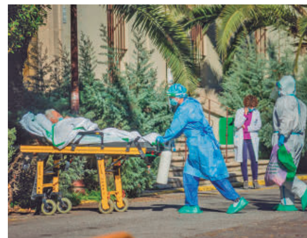
Traslado de un paciente de covid E. P.

El documento subraya que otra pandemia afectaría a un mundo más dividido, más endeudado y con menor capacidad para proteger a su población