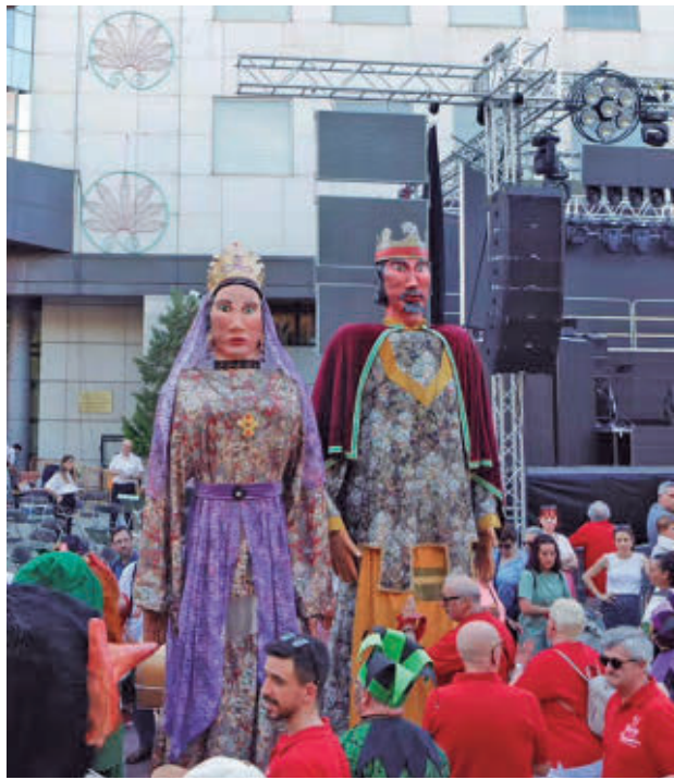
Un imprescindible, el pasacalles de gigantes y cabezudos