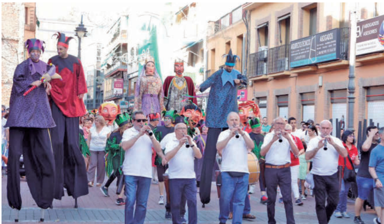
AYTO DE GETAFE