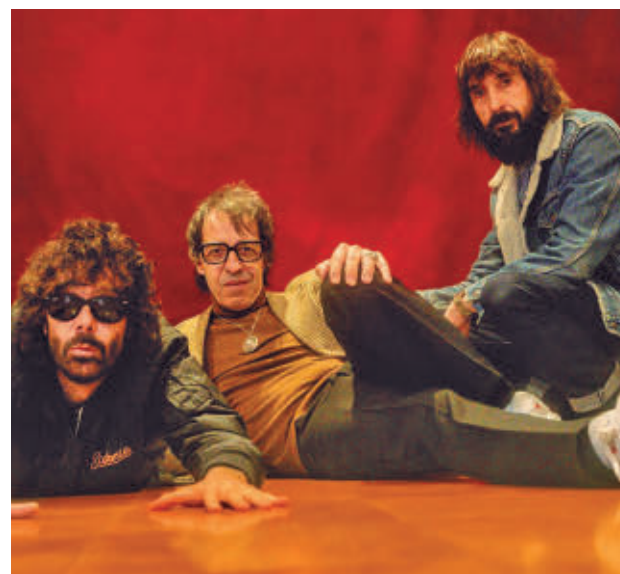
Los barceloneses Sidonie forman parte del cartel de este 2026

nes para el público más joven. Entre el tradicional pasacalles de gigantes y cabezudos del sábado 23, limonadas populares, hinchables, el desfile de carrozas del sábado 30 y los fuegos artificiales del viernes 29, las fiestas preparan otra edición pensada para vivir casi sin descanso hasta la gran quema final de la Chamá del 31 de mayo, horas después de acompañar a su patrona la Virgen de los Ángeles de vuelta al Cerro.