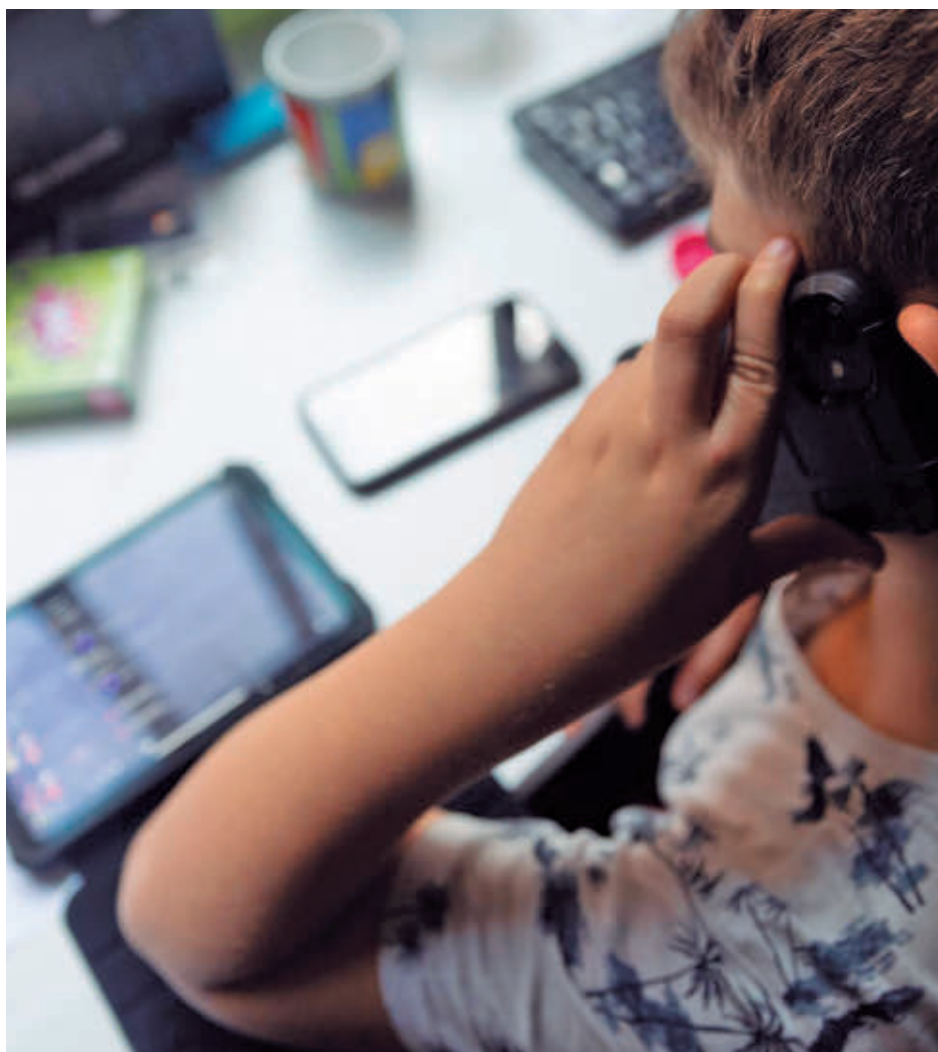
Las pantallas están muy presentes en la vida de los menores