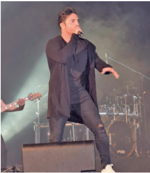
Bustamante se subirá al escenario del Recinto Ferial