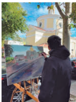
Un participante del certamen

cripción estará abierto hasta el próximo lunes 25. El objetivo de este año es que los participantes plasmen en sus obras algún paisaje, espacio natural, monumento o escena cotidiana del barrio de San Nicasio, con estilo y técnica libres. Cada participante deberá ir provisto del ma-