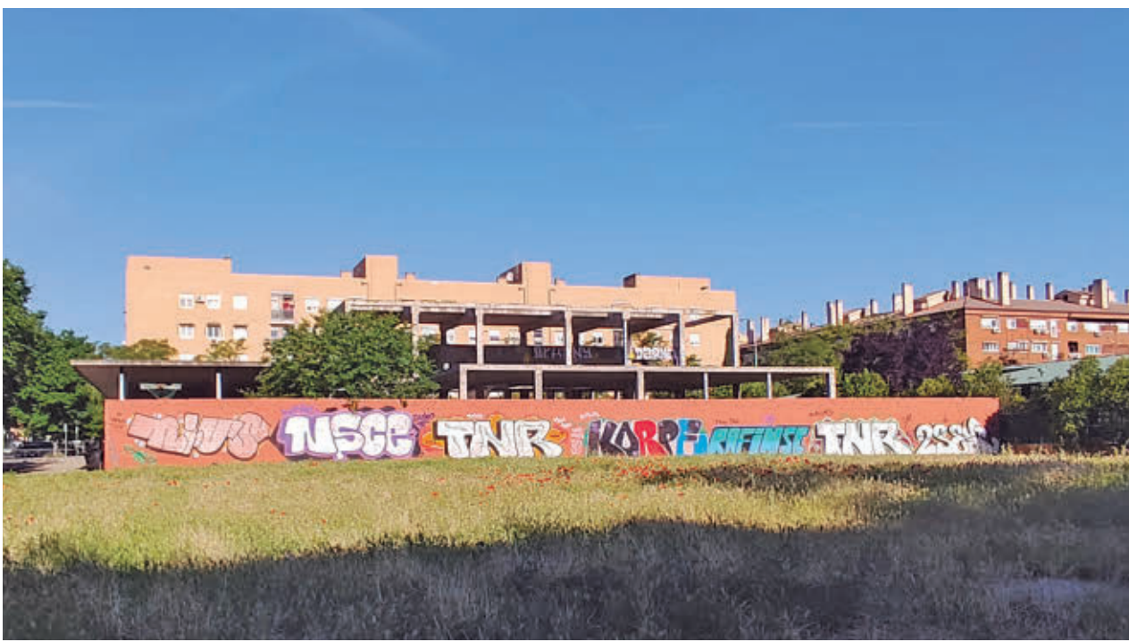
Obra inacabada del centro cívico de Leganés Norte