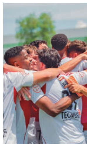
Celebración del Sanse

Enfrente estará una UD Logroñés que viene de apejar al Getafe B y que acabó tercera en el Grupo 2.