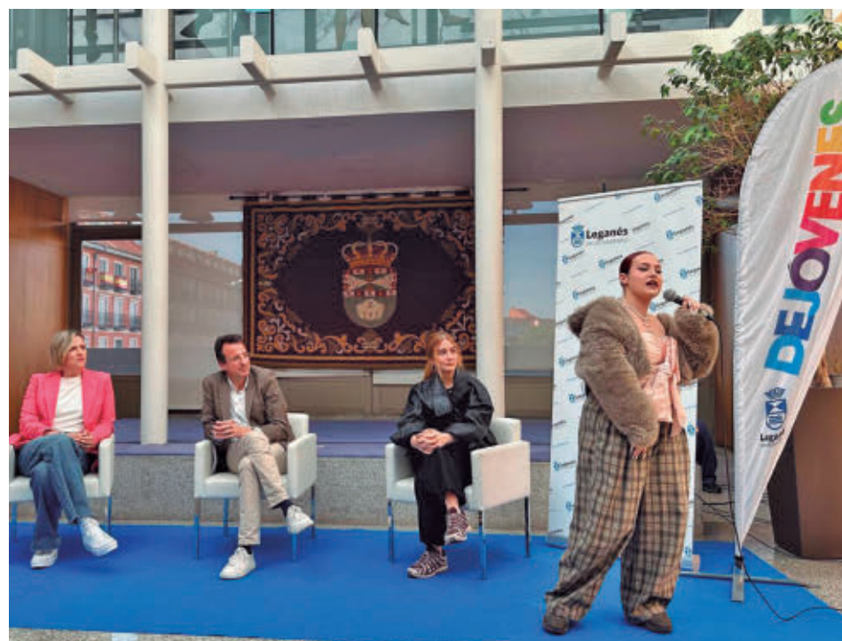
Durante la presentación hubo una actuación musical

“Además, contaremos con un sorteo de una cesta de productos certificados de la Comunidad de Madrid entre todos los vecinos que realicen alguna compra y habrá actuaciones de dos escuelas de danza locales como Artefusión y Sueña a Compás”, explicó el edil leganense.