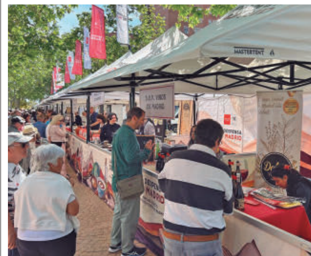
Pasada edición de La Despensa de Madrid

GenteMadrid.es Consulte la actualidad regional y local en nuestra página web