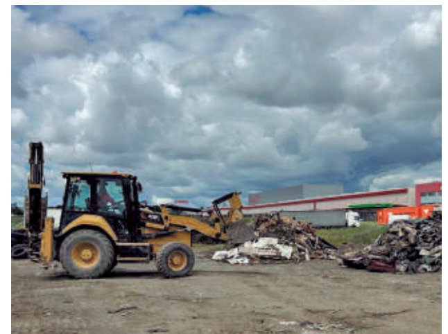
Máquinas actuando en la zona afectada

Un estudio de Ecologistas en Acción del año 2022 alertaba de que Leganés era la ciudad de la Comunidad de Madrid con más puntos de vertidos incontrolados, con un total de 360.