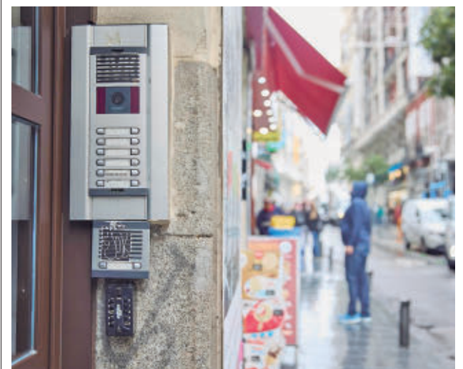
El telefonillo de un portal de viviendas del Centro de la capital

Desde Cibeles explican que se han aprovechado las obras para instalar un nuevo paso de peatones semaforizado en la confluencia de la avenida de la Reina Victoria y la calle de General Ibáñez de Ibero, una iniciativa que parte de los presupuestos participativos Decide Madrid.