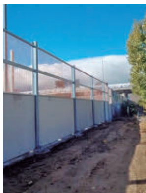
Pantallas en la A-6

la autovía A-6 a su paso por Moncloa-Aravaca a través de la mejora de las pantallas acústicas. Las obras se llevarán a cabo en el tramo comprendido entre los kilómetros 12,600 y 13, que salió a licitación el pasado mes de octubre. Desde Transportes explican que se ha constatado