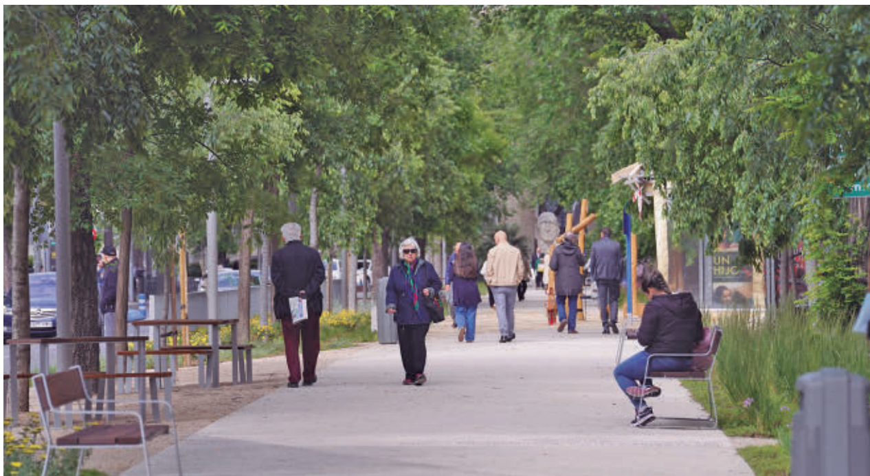
El remozado bulevar de Reina Victoria

El informe que ha sido elaborado a partir del cruce de datos estadísticos y comprobaciones a pie de calle, critica la falta de medios de inspección, control y sanción para garantizar el cumplimiento de la normativa. En este sentido, advierte de que resulta "imposible" frenar la proliferación de pisos turísticos en zonas saturadas sin un reglamento específico, un régimen sancionador y recursos para labores de inspección y restauración de la legalidad.