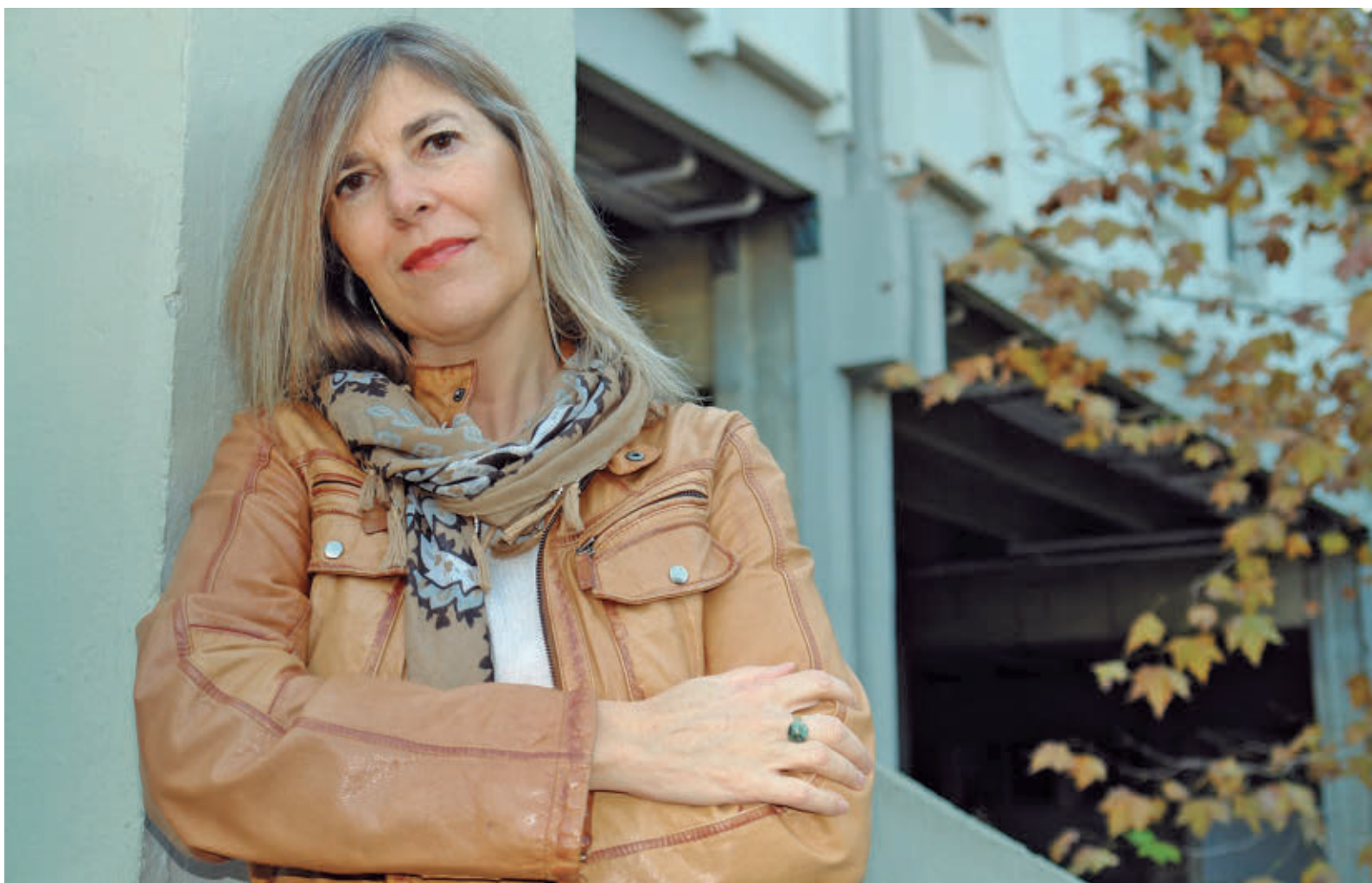
Anglarill tiene una dilatada carrera como guionista, documentalista, presentadora y reportera en TVE