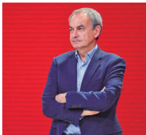
El expresidente, en el ojo del huracán

EL PERIÓDICO GENTE NO SE RESPONSABILIZA NI SE IDENTIFICA CON LAS OPINIONES QUE SUS LECTORES Y COLABORADORES EXPONGAN EN SUS CARTAS Y ARTÍCULOS