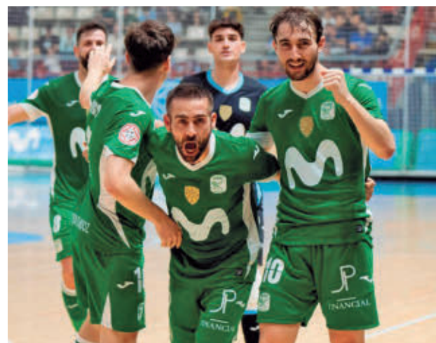
Goleada ante Noia (4-1) para cerrar la fase regular

Tras acabar en quinta posición, su rival en cuartos de final será el Jimbee Cartagena, curiosamente el mismo equipo con el que se vio las caras en esta ronda la pasada temporada. Entonces, Movistar Inter daba un golpe de autoridad en el primer partido al ganar por 6-1, pero el conjunto melonero igualó la serie en Cartagena (3-2) y terminó sellando su pase a semifinales al imponerse en el tercer y definitivo choque,