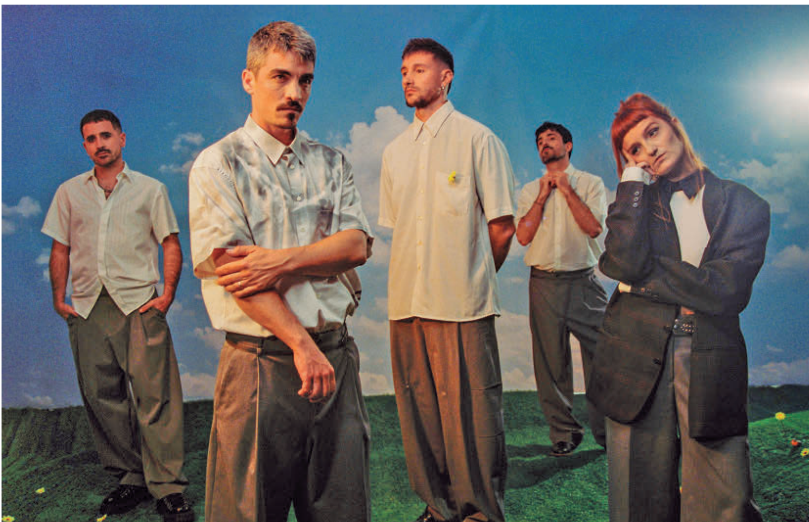
Los miembros de este grupo tuvieron un recorrido previo en formaciones como Mafalda o Funkiwis