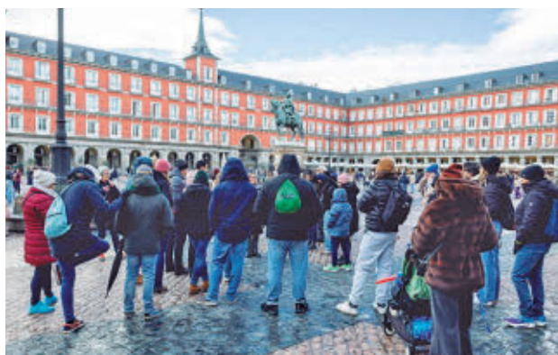
Turistas en la Plaza Mayor de Madrid

"Techo no hay. En Madrid el turismo fluye de manera natural y fluye de manera ordenada porque tenemos una estrategia", señaló el consejero.