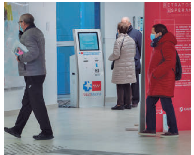
Centro sanitario de la Comunidad de Madrid