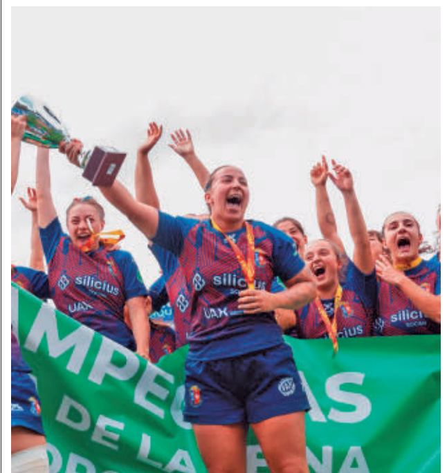
El equipo majariego ya conquistó la Copa

Así, con un 2-0 adverso, el conjunto de Iñaki Martín llega al Fernando Martín sin margen de error. Este viernes 22 (21 horas) se disputará el tercer encuentro. Si hubiera triunfo fuenlabreño, el domingo 24 (19 horas) se disputaría el cuarto partido de esta serie.