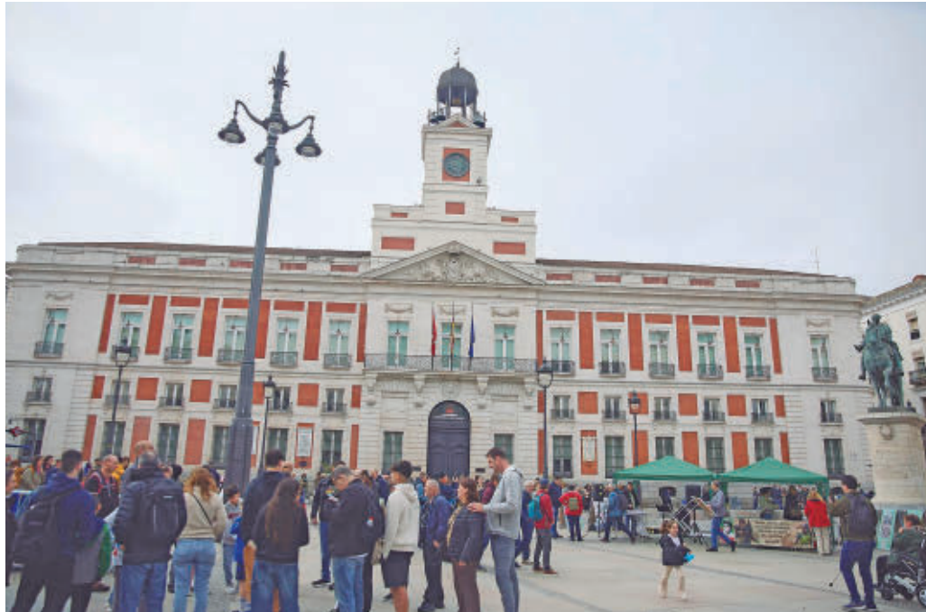
Real Casa de Correos en la Puerta del Sol

Los magistrados consideran que "no puede afirmarse de forma categórica que la imagen de la sede de la Presidencia pueda sufrir un menoscabo irreversible, pero sí