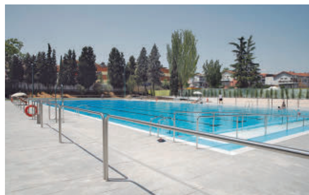
La piscina de verano del polideportivo Moscardó

Una de las novedades de este año será la puesta en