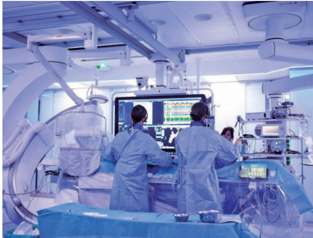
Intervención quirúrgica en un hospital de la Comunidad de Madrid

A la hora de comparar su cifras con las de la media del