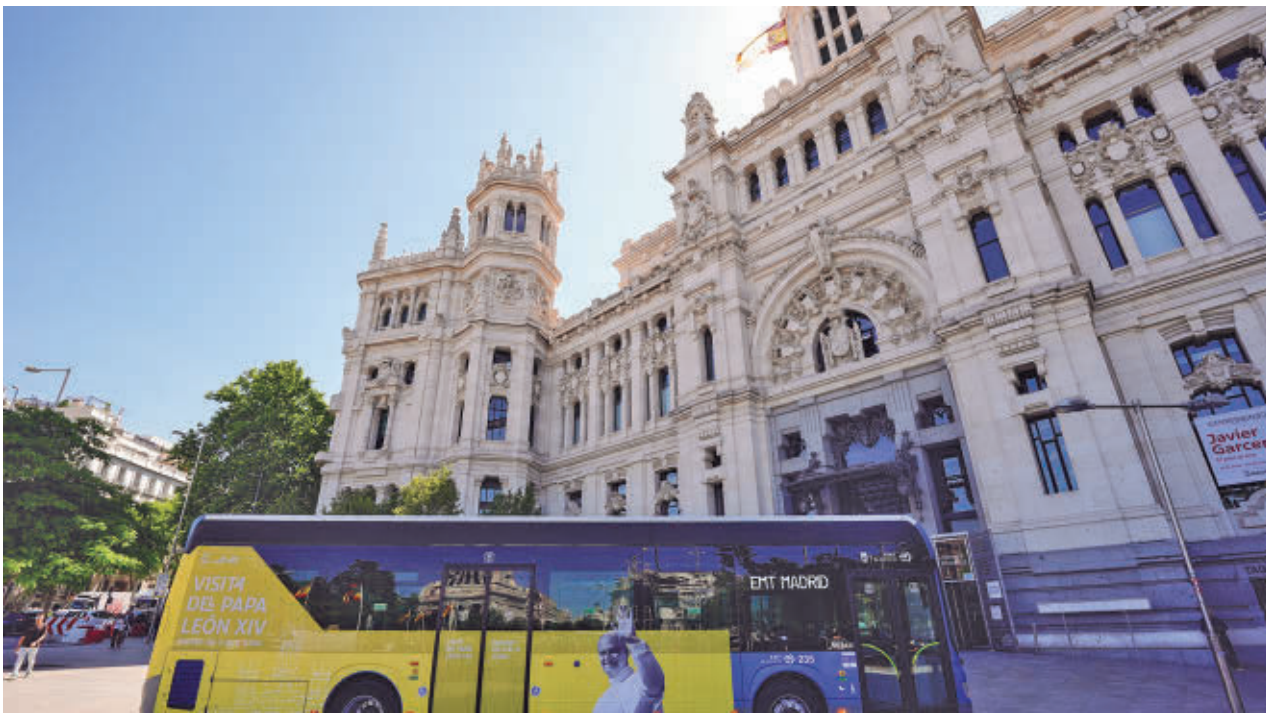
Uno de los autobuses urbanos con vinilos con la figura de Robert Francis Prevost, en la plaza de Cibeles