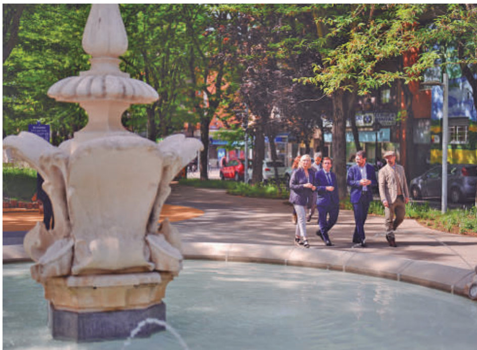
Un momento de la visita del alcalde de Madrid, José Luis Martínez-Almeida

De igual modo, los trabajos también mejorarán el entorno de la Escuela de Educación Infantil VeoVeo, donde se ampliarán las zonas de espera y estancia para favorecer recorridos más seguros y confortables.