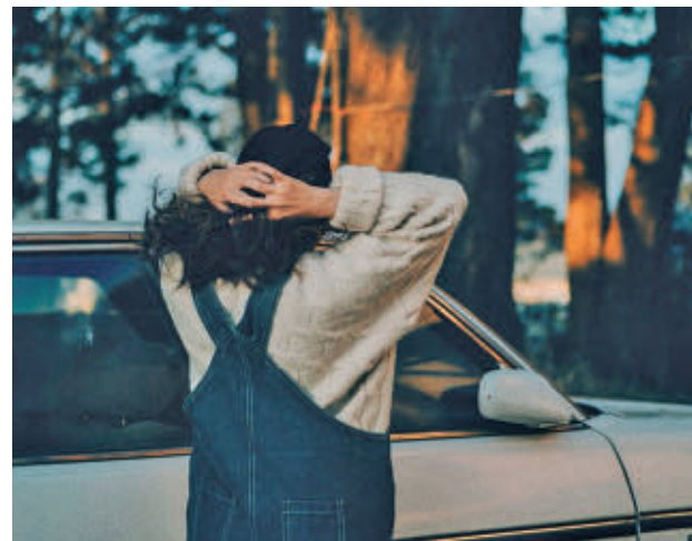
Los compradores no conocen los daños previos E. P.

Según datos de Carfax, el 51% de los vehículos presenta al menos un factor de riesgo asociado, desde daños previos o irregularidades en el kilometraje hasta cuestiones meramente informativas, como importaciones o uso previo como vehículo de alquiler. Si se extrapolan estos datos al conjunto del parque móvil español, se estima que