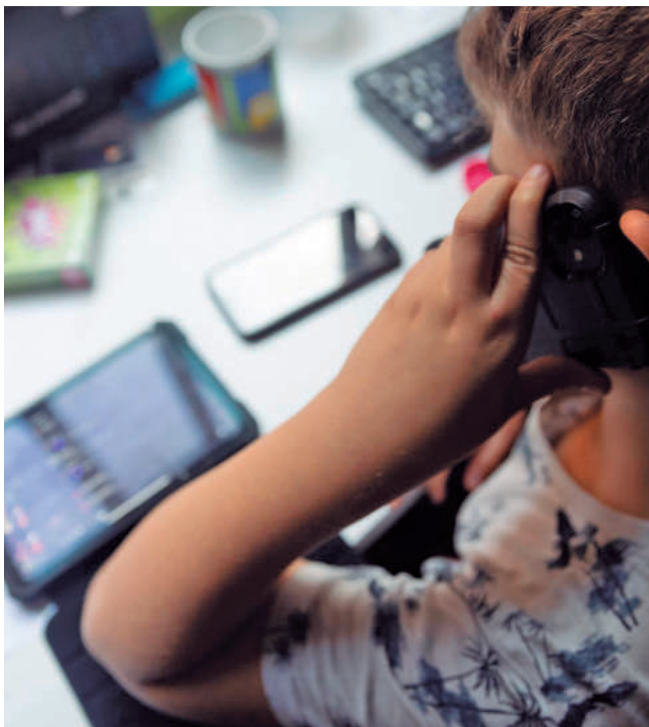
Las pantallas están muy presentes en la vida de los menores