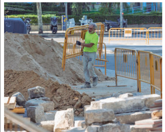
El proyecto reordenará el estacionamiento