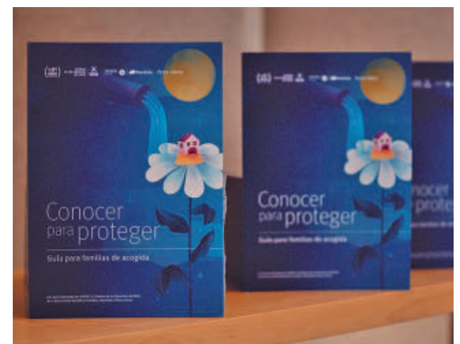
La guía presentada esta semana

Actualmente hay cerca de 20.000 niños y niñas tutelados viviendo en centros, de los cuales más de 1.200 son menores de seis años.