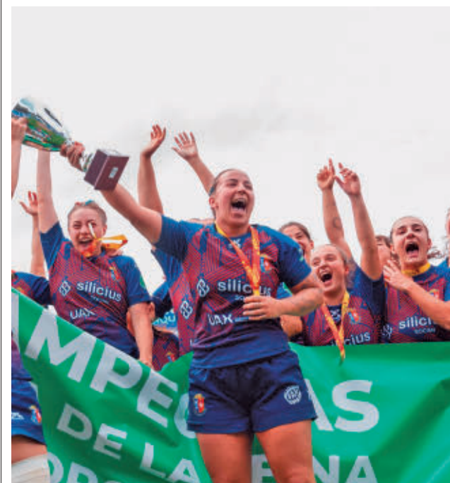
El equipo majariego ya conquistó la Copa