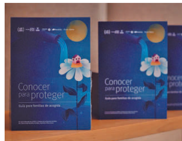
La guía presentada esta semana

Actualmente hay cerca de 20.000 niños y niñas tutelados viviendo en centros, de los cuales más de 1.200 son menores de seis años.