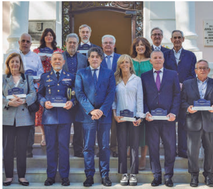
Los premios de la tercera edición