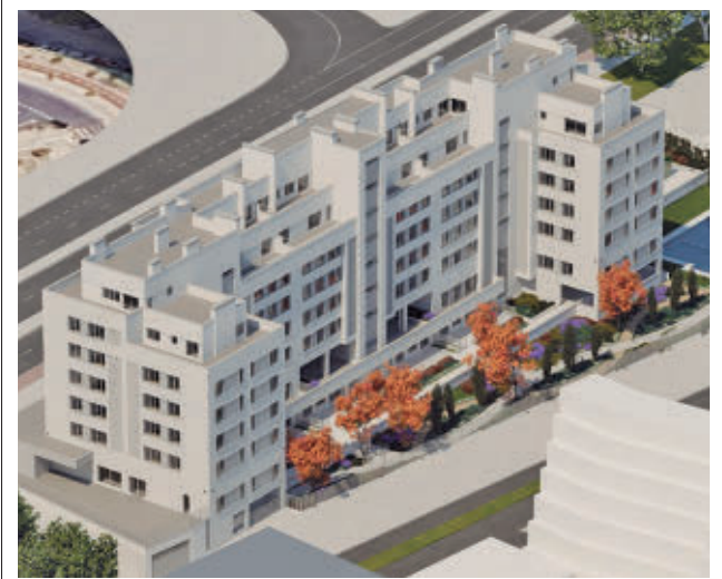
Una recreación del proyecto