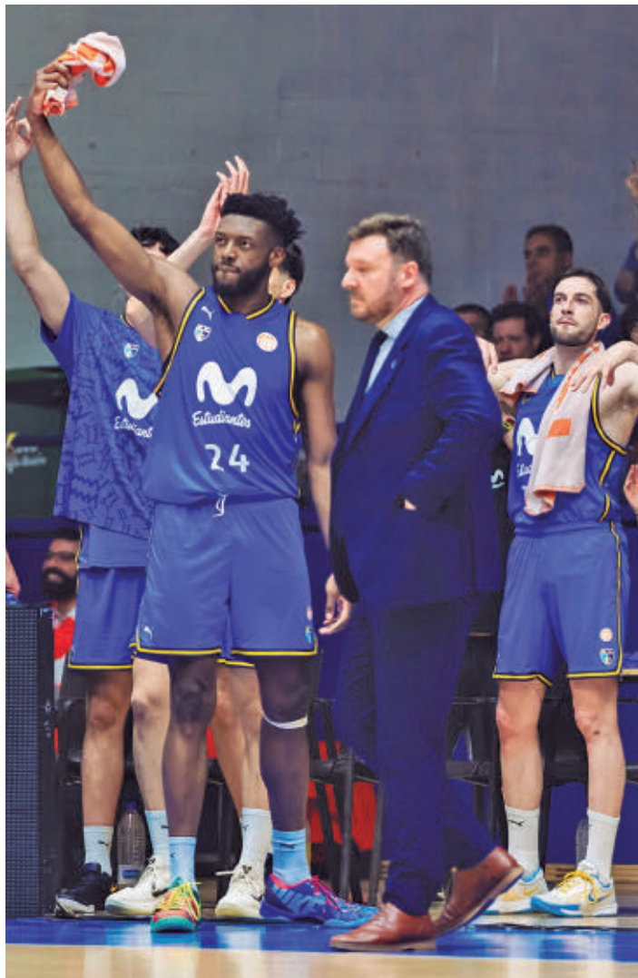
Magariños vibró el jueves 14 con su equipo MOVISTAR ESTUDIANTES

pesar de su irregular broche en la fase regular, el Estudiantes salió con una gran intensidad al primer choque de la serie, como demuestra el hecho de que al descanso ya gozara de una importante ventaja: 50-34. El 93-77 final refleja esa superioridad, con el galardón de MVP para Sergi García Calvo, quien aportó