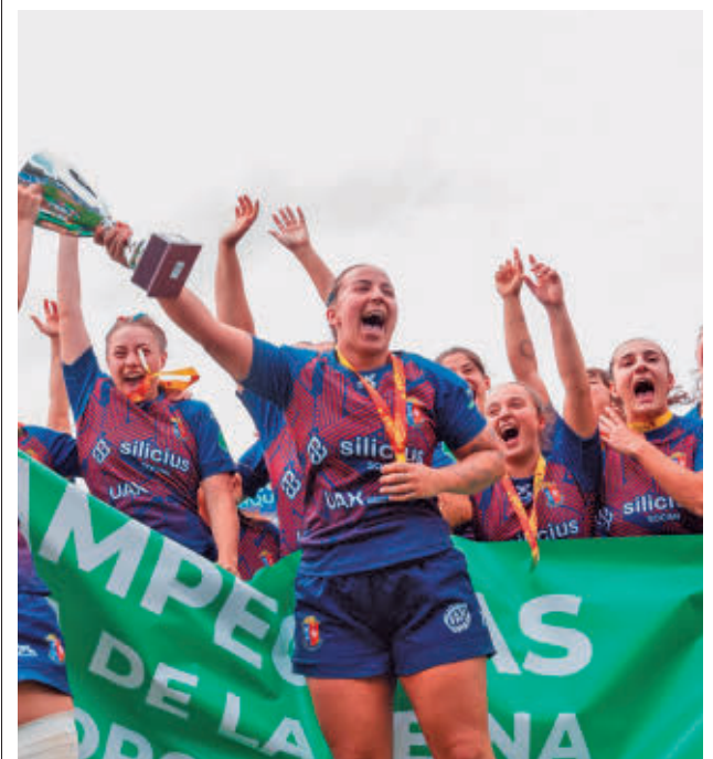
El equipo majariego ya conquistó la Copa

Así, con un 2-0 adverso, el conjunto de Iñaki Martín llega al Fernando Martín sin margen de error. Este viernes 22 (21 horas) se disputará el tercer encuentro. Si hubiera triunfo fuenlabreño, el domingo 24 (19 horas) se disputaría el cuarto partido de esta serie.