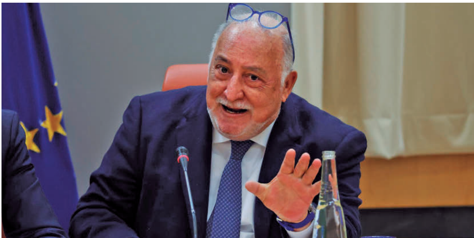
Pere Navarro compareció esta semana en el Congreso de los Diputados