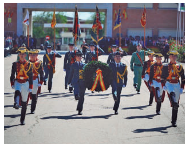
Acto de promoción en la Guardia Civil de Valdemoro