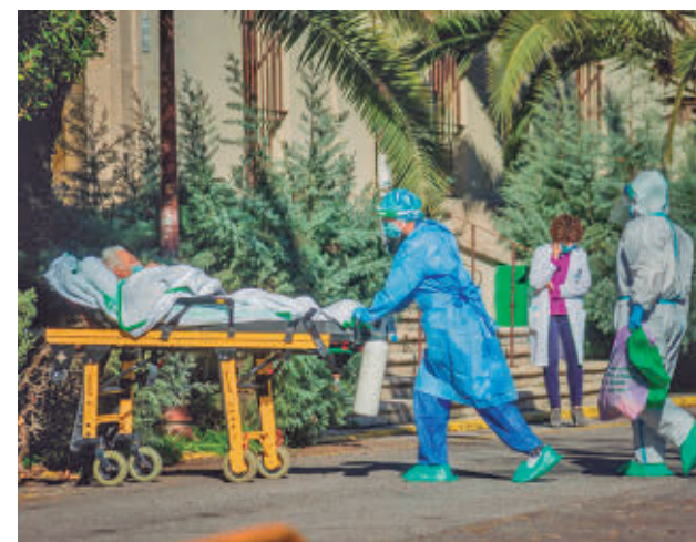
Traslado de un paciente de covid E. P.

El documento subraya que otra pandemia afectaría a un mundo más dividido, más endeudado y con menor capacidad para proteger a su población