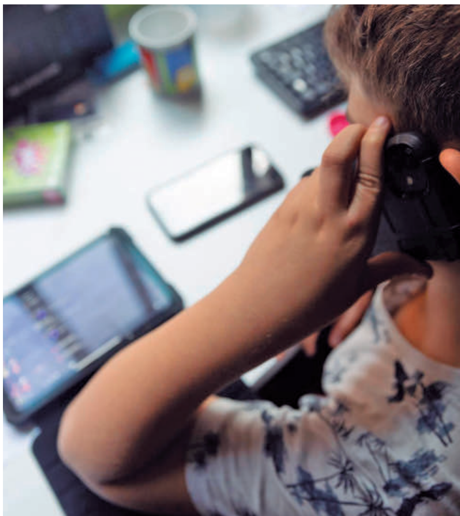
Las pantallas están muy presentes en la vida de los menores