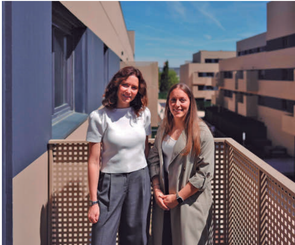
Isabel Díaz Ayuso, con una de las adjudicatarias

La promoción de Pinto ha supuesto una inversión privada cercana a los 38 millones de euros sobre suelo público aportado por la Comunidad de Madrid, reforzando así su