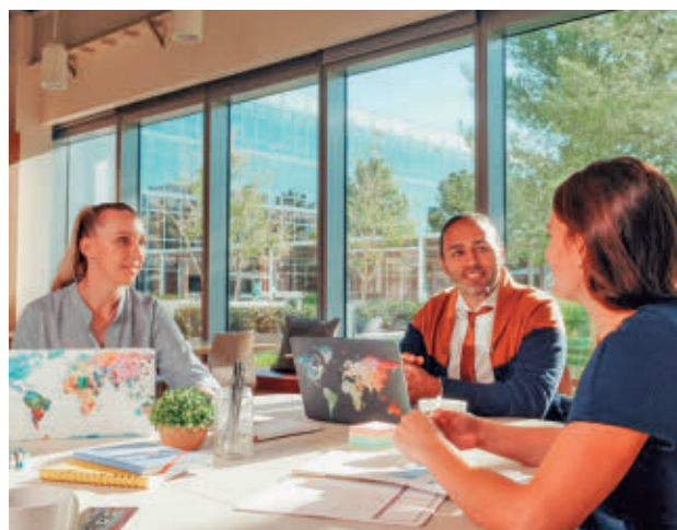
Convocatoria orientada a empresas y emprendedores

Las solicitudes para optar a uno de estos galardones podrán presentarse exclusivamente a través de la sede electrónica municipal ( web.trescantos.es ) hasta el próximo 19 de junio. Con una dotación global de 38.000 euros, estas distinciones contemplan seis categorías.