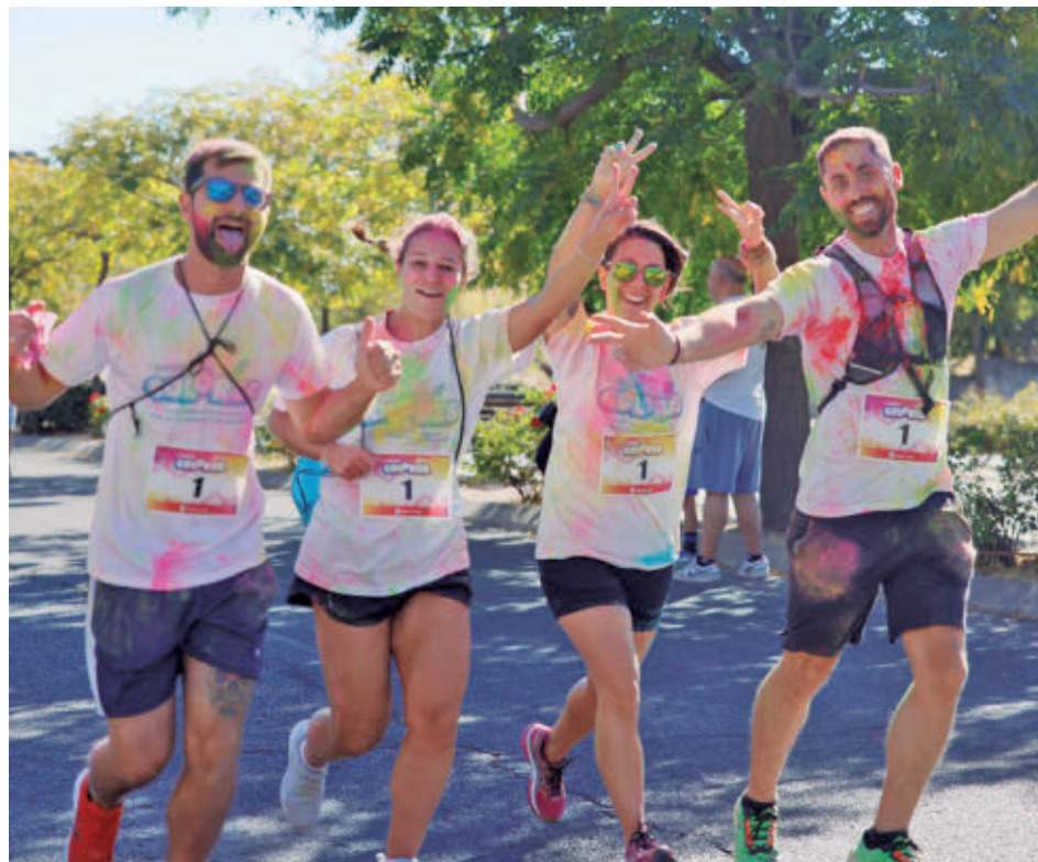
Los polvos de colores, grandes protagonistas de la prueba AYTO DE COLMENAR VIEJO

"EN ESTA CARRERA, CADA PERSONA IMPORTA Y CADA PASO CUENTA"