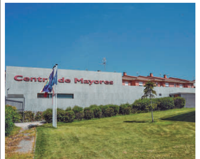
Se celebrarán los días 25, 27 y 29 de mayo

GenteMadrid.es Consulte la actualidad regional y local en nuestra página web