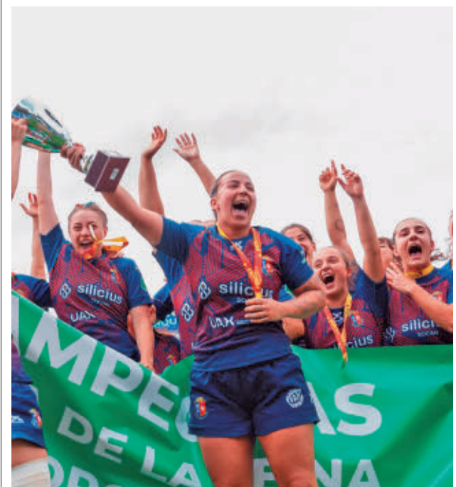
El equipo majariego ya conquistó la Copa