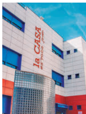
La jornada arranca a las 11:30

El evento tendrá lugar en el Auditorio de La Casa de la Juventud, a partir de las 11:30 horas. Tras la inauguración institucional, en la que parti-