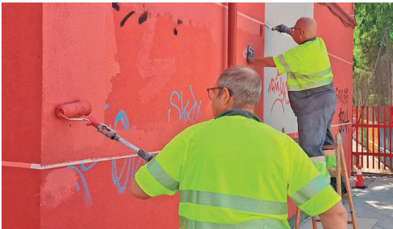
AYTO DE ALCORCÓN