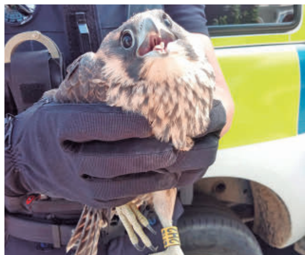
La cría de halcón fue trasladada al CUS POLICÍA DE ALCORCÓN