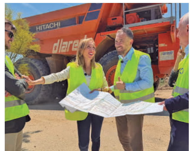
AYTO DE ALCORCÓN