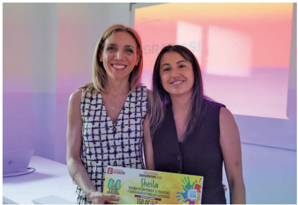
La alcaldesa, Candelaria Testa, comunicó los proyectos ganadores AYUNTAMIENTO DE ALCORCÓN

La alcaldesa, Candelaria Testa, ha defendido que “la escucha activa es un pilar fundamental en la acción de nuestro Gobierno” y ha subrayado que ese compromiso “se demuestra con hechos y con presupuesto”. La actuación más respaldada contempla soluciones naturales y artificiales para reducir el impacto del calor en áreas infan-