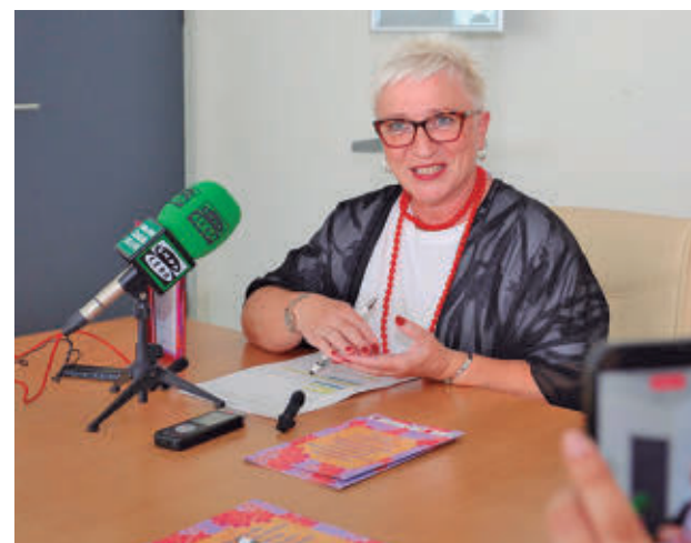
Presentación del programa

El programa se llevará a cabo en los cinco centros municipales de mayores de la ciudad (Ciudad 70, José Luis Sampedro, Primavera, La Rambla y La Cañada) y ofrecerá una amplia variedad de actividades adaptadas a diferentes intereses y niveles, combinando ejercicio físico, actividades culturales, forma-