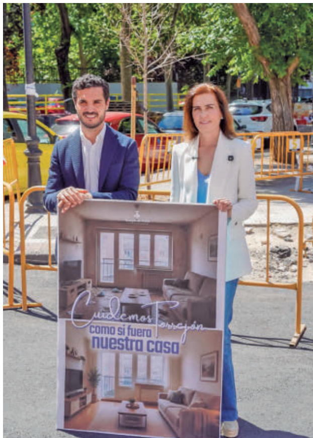
Presentación de la iniciativa municipal

LAS ZONAS Y LAS VIVIENDAS MÁS ANTIGUAS DE LA LOCALIDAD SERÁN PRIORIDAD