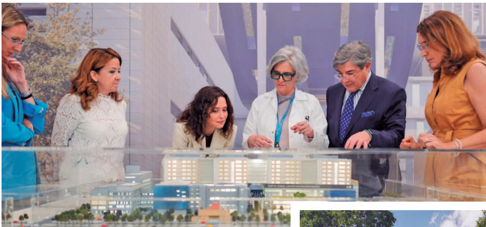
Isabel Díaz Ayuso, en la presentación del proyecto