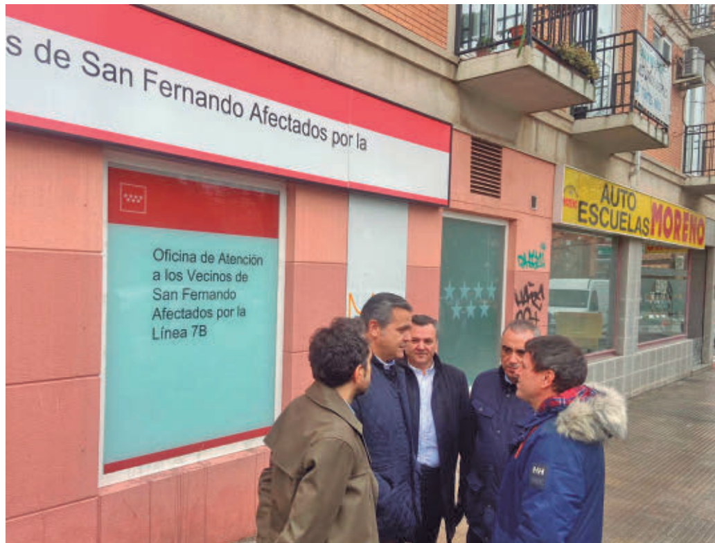
Visita del consejero de Vivienda a San Fernando de Henares.

LA CANTIDAD FINAL SE ELEVA AHORA HASTA LOS 362.000 EUROS