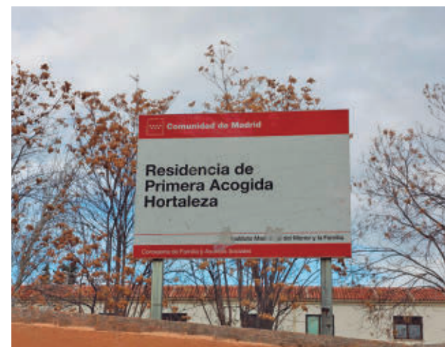
Centro que acoge a menores migrantes E.P.

Por otra parte, la Comunidad de Madrid ha presentado ya un total de 16 denuncias contra adultos migrantes que se hacían pasar por menores por un presunto delito de estafa agravada, al haberse beneficiado "indebidamente de recursos públicos de protección".