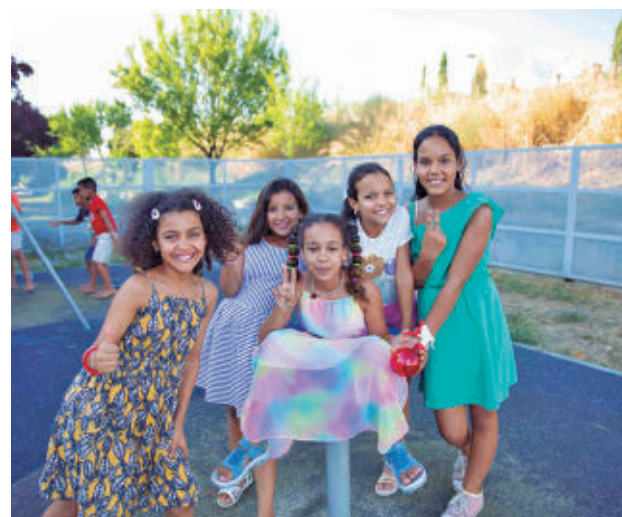
Uno de los proyectos que se van a financiar

GenteMadrid.es Consulte la actualidad regional y local en nuestra página web