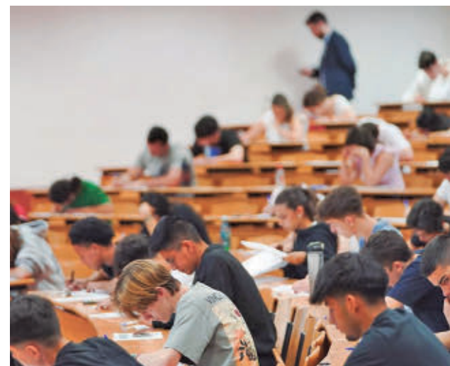
Prueba de Acceso a la Universidad de 2025