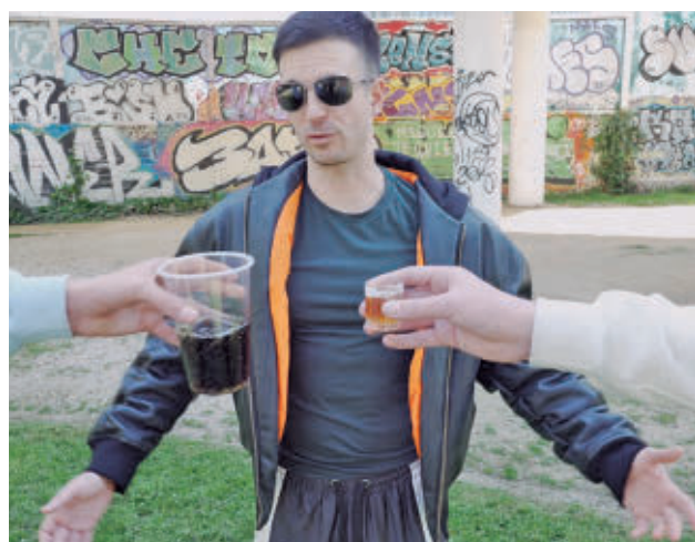
Videó de la campaña

En cuanto al sexo, el 13,5% de los hombres españoles fuma, frente al 11,4% de las mujeres.