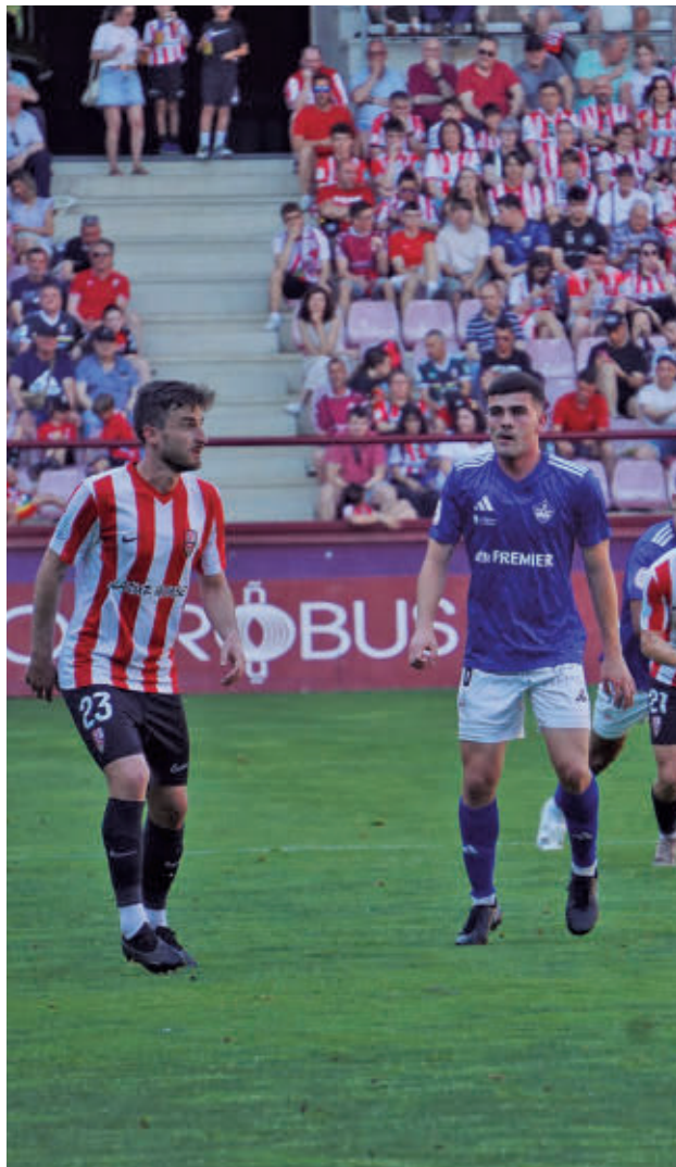
Imagen del partido de Las Gaunas UD SANSE

Lejos de quedar lamiéndose las heridas, el Sanse mira a la cita de este sábado 30 (19 horas) en Matapiñonera con el doble aval que supone su