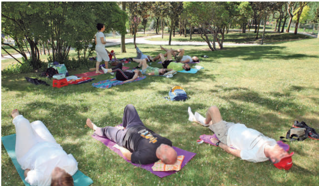
AYTO DE FUENLABRADA