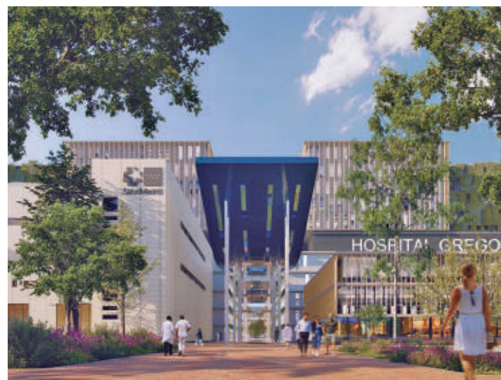
El centro sanitario, en cifras: En el Hospital Gregorio Marañón trabajan en la actualidad 8.000 profesionales que realizan 40.000 intervenciones y procedimientos quirúrgicos al año, más de 300 trasplantes, 250.000 urgencias y un millón de consultas externas.

Díaz Ayuso destacó que estas "instalaciones de vanguardia" ofrecerán la máxima comodidad a pacientes y profesionales".