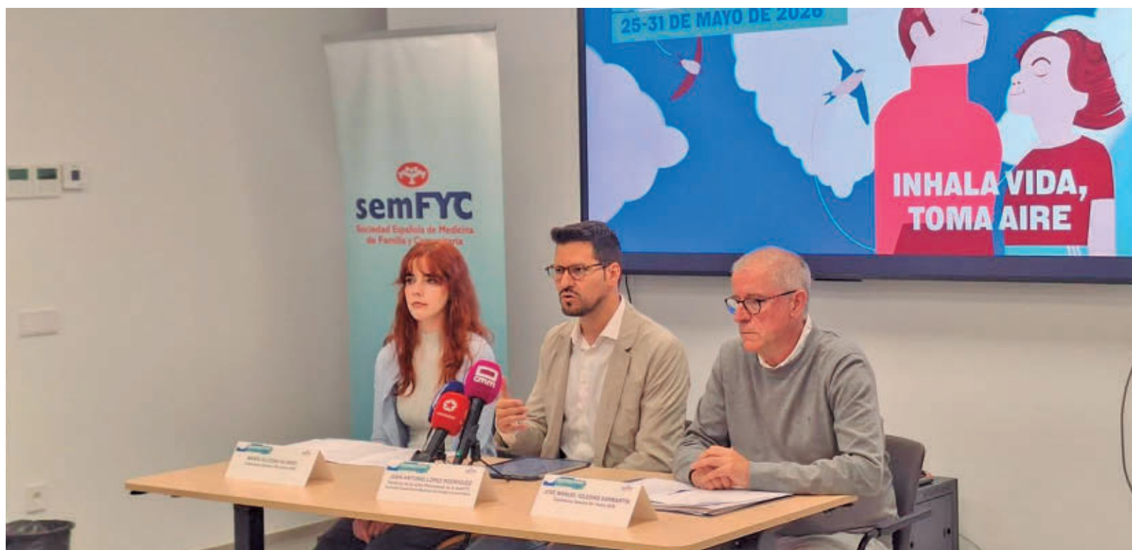
Presentación de la encuesta realizada por la Sociedad Española de Medicina Familiar y Comunitaria