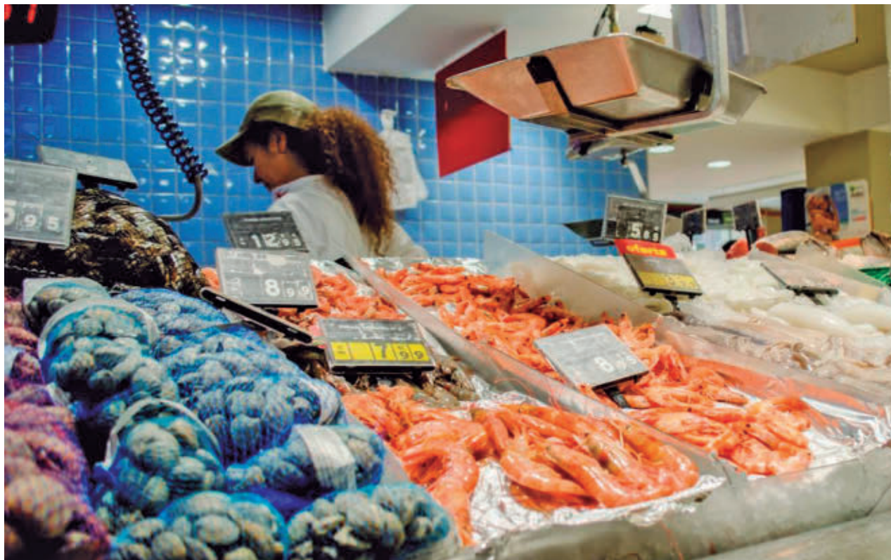
Las pescaderías atendidas están desapareciendo de algunos supermercados EUROPA PRESS

OCU lamenta la progresiva desaparición de la pescadería en los supermercados, ya que elimina el asesoramiento y el servicio personalizado del pescadero, al tiempo que reduce la oferta y aumenta el impacto ambiental generado por el uso de envases. La progresiva sustitución del servicio de pescadería del supermercado en favor de la venta de pescado fresco ya envasado es una tendencia creciente, como demuestra el nuevo modelo de tienda anunciado por Mercadona, que elimi-