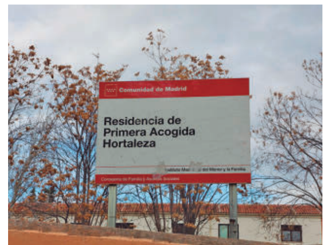
Centro que acoge a menores migrantes

Por otra parte, la Comunidad de Madrid ha presentado ya un total de 16 denuncias contra adultos migrantes que se hacían pasar por menores por un presunto delito de estafa agravada, al haberse beneficiado "indebidamente de recursos públicos de protección".