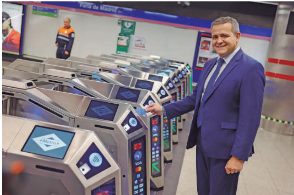
El consejero de Transportes prueba el nuevo pago con tarjeta

Todas las estaciones incorporarán estos dispositivos preparados para validar títulos de transporte mediante códigos QR, ampliando así las opciones de acceso y