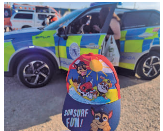
AYTO DE FUENLABRADA

La programación del Encuentro de Culturas incorporó una nueva edición de Expoemergencias en el Parque Ferial, una propuesta dirigida especialmente al público infantil para acercar de forma didáctica y cercana el trabajo que desarrolla el Servicio de Policía Local de Fuenlabrada.