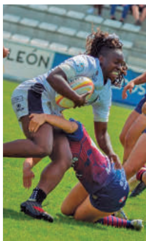
Derrota en Valladolid

te tras conquistar la Copa de la Reina, el cuadro majariego acabó hincando la rodilla en la final del 'play-off' por el título, después de que el Coli-