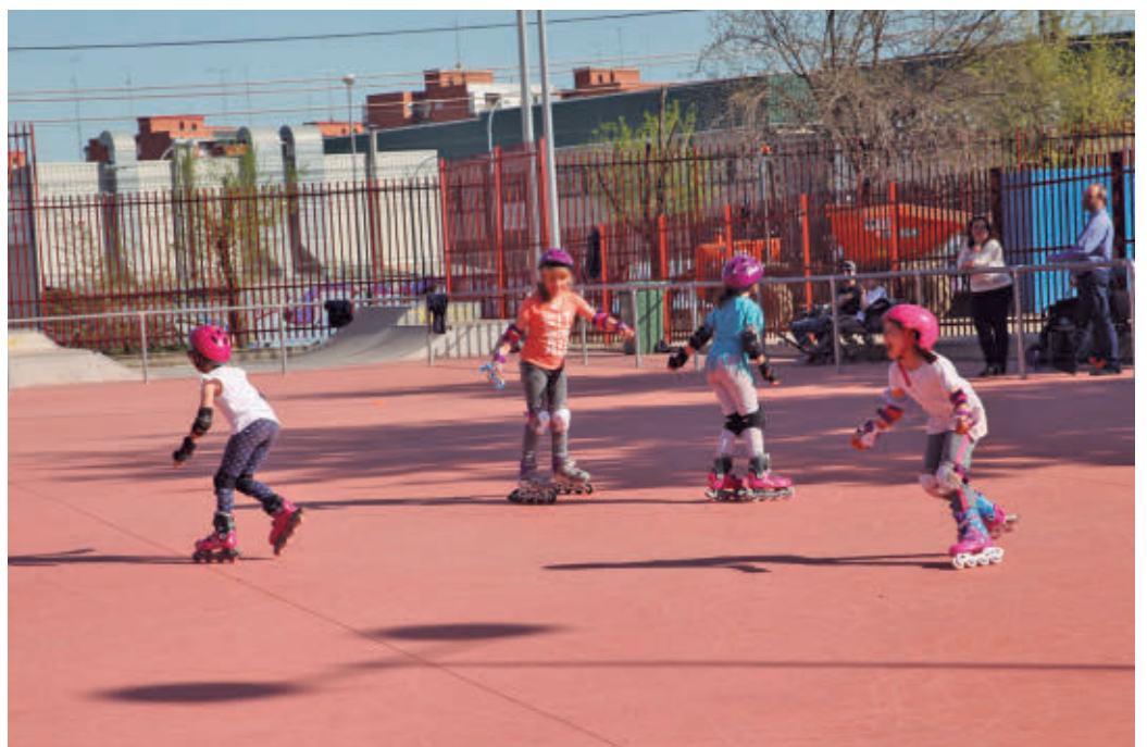
Menores participando en una actividad deportiva organizada el pasado verano