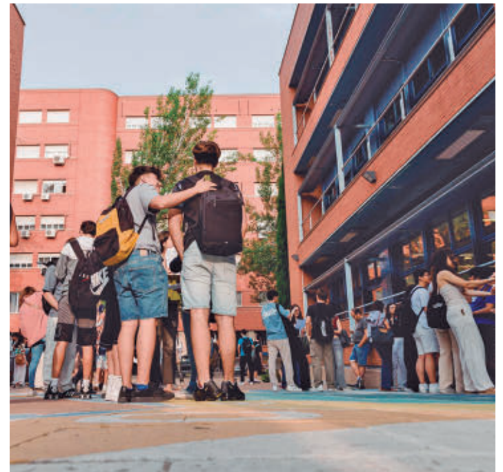
Prueba de Acceso a la Universidad del pasado año

Cada materia presentará un modelo único del ejercicio, aunque se podrán elegir algunos apartados entre varias preguntas. Deberán responderse en un máximo de 90 minutos y podrán ser cerradas, semi construidas o abiertas, siempre y cuando las dos últimas modalidades supongan al menos un 70% del total del examen.