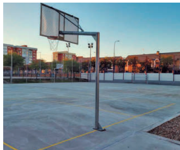
Una pista deportiva de Fuenlabrada AYUNTAMIENTO DE FUENLABRADA

GenteMadrid.es Consulte la actualidad regional y local en nuestra página web