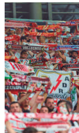
Afición rayista en Leipzig

La fiesta vivida por las calles de Leipzig en las horas previas contrastó con las lágrimas por la derrota, una tristeza que no fue óbice para que la marea rayista arrojara a sus jugadores tras el pitido final. Una de las pancartas exhibidas resume a la perfección esa comunión entre afición y plantilla: “No conocía mayor victoria que contigo en una derrota”.