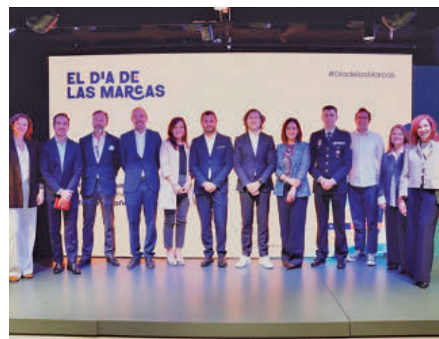
Presentación del informe

Entre las principales conclusiones del estudio, destacan que la IA se ha integrado completamente en el trabajo del marketing y la gestión de la marca, ya que el 85,7% de los profesionales la utiliza