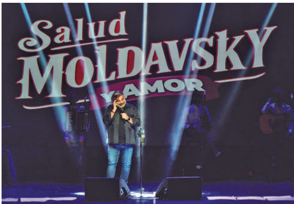
El humorista también actuará en Valencia el jueves 4 y en Barcelona el sábado 6

» Hasta el 1 de junio. Factoría Cultural. Acceso gratuito