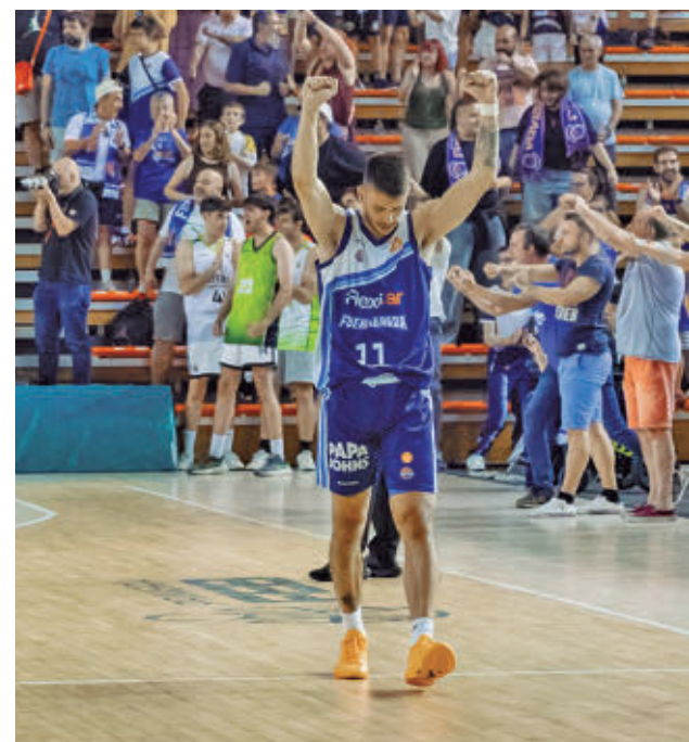
Los fuenlabreños lograron dos triunfos en casa

el Sanse ganara el partido por un solo gol de ventaja, la eliminatoria se iría a la prórroga. Si tras ese tiempo extra el resultado global sigue siendo favorable a los locales por un tanto, el billete a la categoría de bronce sería para la UD Sanse gracias a su mejor clasificación en la fase regular: fue segundo en el Grupo 5 con 70 puntos, mientras que la UD Logroñés acabó tercera en el Grupo 2 con 61 puntos. Ese comodín, sin embargo, no pudo usarse hace dos temporadas, cuando el Sanse se trajo un 1-1 de Zamora en la eliminatoria decisiva pero acabó cayendo por 0-1 en el choque de vuelta.