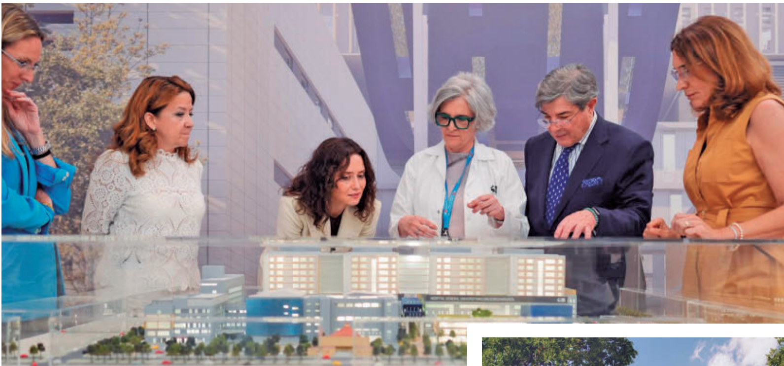
Isabel Díaz Ayuso, en la presentación del proyecto