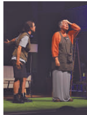
'La casa del mar'

» Sábado 30, 18 horas. Auditorio Joaquín Rodrigo. Precio: 3 euros