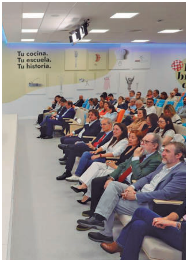
Empresas y expertos participaron en las mesas

Menos teoría y más aplicaciones concretas. Esa ha sido una de las claves de la jornada celebrada en el CIFE para evaluar el proyecto EDINT, 'Datos que transforman ciudades', un encuentro que también ha servido para presentar el futuro Centro de Excelencia en Inteligencia Artificial y Oficina del Dato. La iniciativa sitúa el análisis de datos como herramienta para mejorar la gestión municipal y adaptar las políticas públicas a las dinámicas reales de la