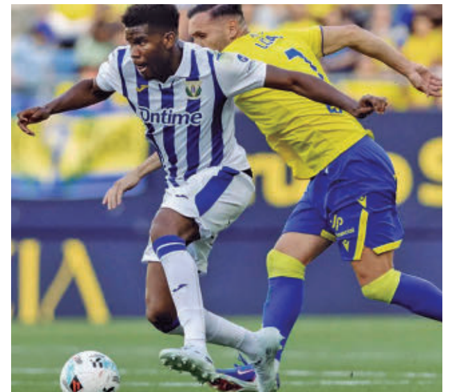
El Leganés perdió en Cádiz CD LEGANÉS

Las cuentas son bastante claras. El CD Leganés se sal-