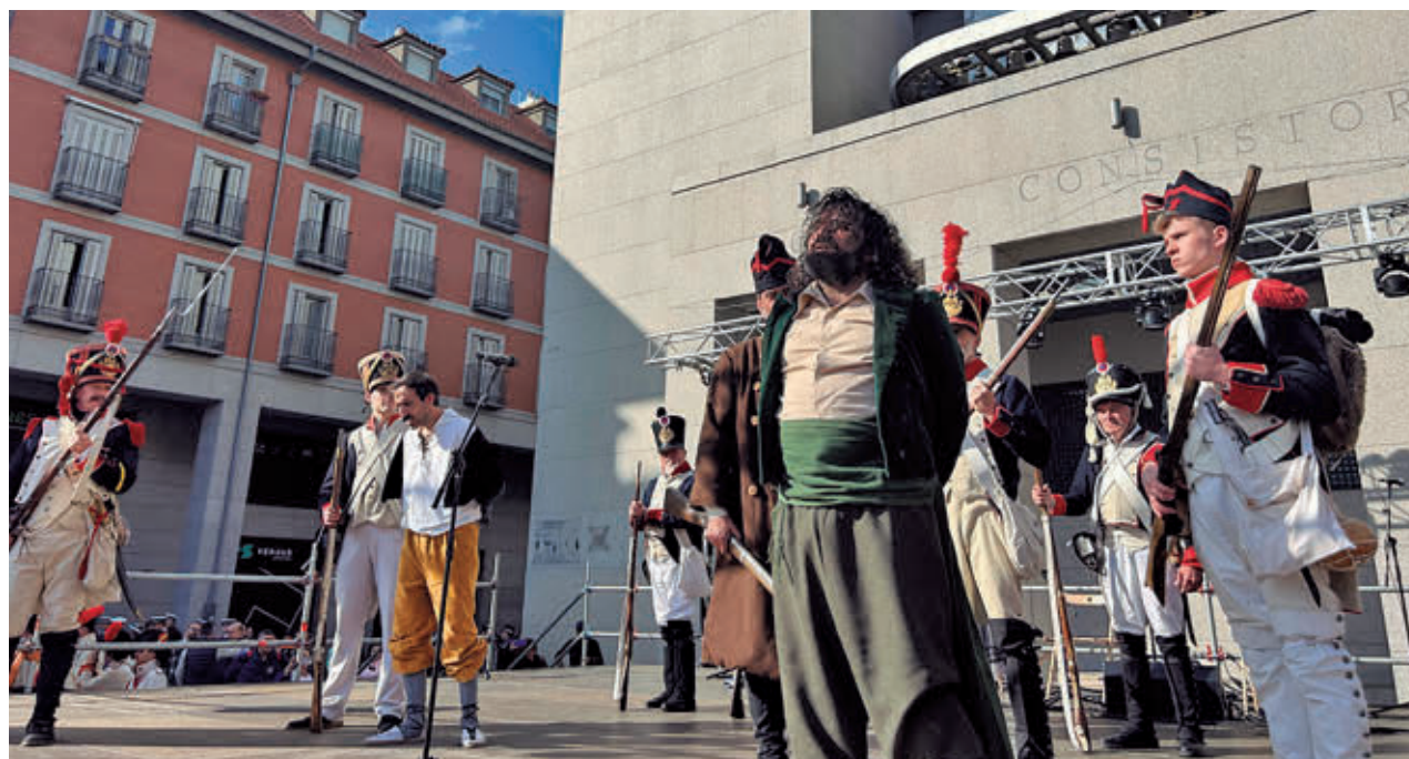
Los Hermanos Rejón se levantaron contra las tropas napoleónicas

El evento central del sábado 30 será el homenaje en forma de recreación histórica a los Hermanos Rejón, héroes del