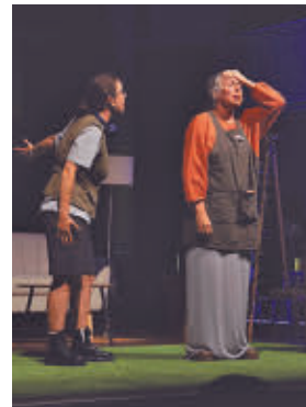
'La casa del mar'

» Sábado 30, 18 horas. Auditorio Joaquín Rodrigo. Precio: 3 euros