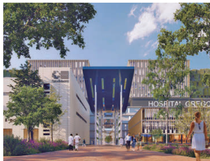
El centro sanitario, en cifras: En el Hospital Gregorio Marañón trabajan en la actualidad 8.000 profesionales que realizan 40.000 intervenciones y procedimientos quirúrgicos al año, más de 300 trasplantes, 250.000 urgencias y un millón de consultas externas.

Díaz Ayuso destacó que estas "instalaciones de vanguardia" ofrecerán la máxima comodidad a pacientes y profesionales".