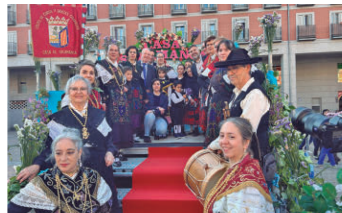
Las Mayas: Tras el homenaje histórico, en torno a las 19 horas del sábado 30, dará comienzo la Fiesta de Las Mayas, en la que niñas ataviadas con trajes tradicionales, presiden altares decorados con flores como “símbolo de la primavera y la fertilidad”.