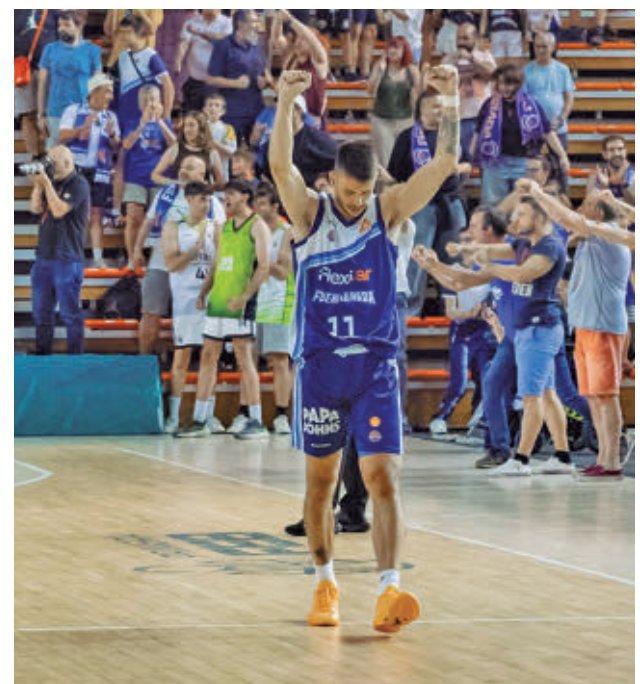
Los fuenlabreños lograron dos triunfos en casa

el Sanse ganara el partido por un solo gol de ventaja, la eliminatoria se iría a la prórroga. Si tras ese tiempo extra el resultado global sigue siendo favorable a los locales por un tanto, el billete a la categoría de bronce sería para la UD Sanse gracias a su mejor clasificación en la fase regular: fue segundo en el Grupo 5 con 70 puntos, mientras que la UD Logroñés acabó tercera en el Grupo 2 con 61 puntos. Ese comodín, sin embargo, no pudo usarse hace dos temporadas, cuando el Sanse se trajo un 1-1 de Zamora en la eliminatoria decisiva pero acabó cayendo por 0-1 en el choque de vuelta.