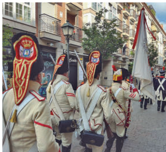
La comitiva recorrerá las calles del Centro