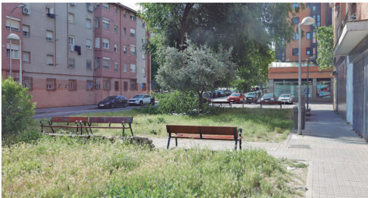
Una de las zonas que será mejorada por el Ayuntamiento de Madrid