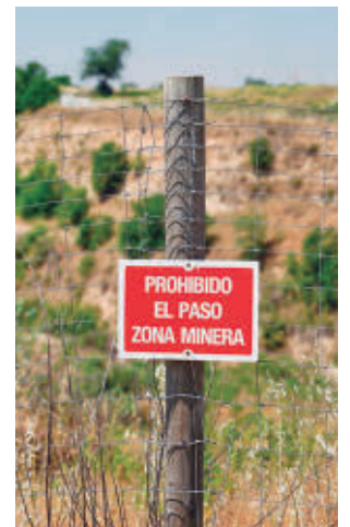
El vallado de la explotación

Fuentes regionales aseguran que el expediente cuenta con todos los informes y ava-