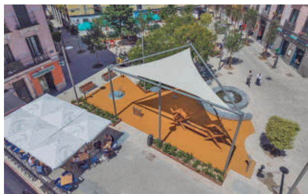
Vista aérea de la plaza, tras su reforma

El proyecto municipal de remodelación, recientemente finalizado, ha supuesto una inversión de 2,3 millones de euros y ha abarcado también