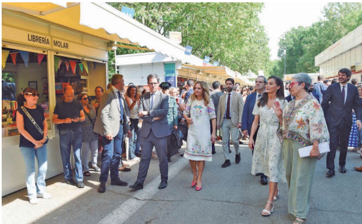
Doña Letizia volverá a inaugurar la feria este viernes 29 de mayo