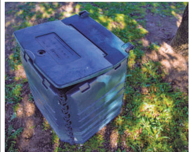
Una de las composteras ya repartidas por el Consistorio

A su vez, los participantes podrán acceder a jornadas de formación semestrales, que se impartirán en las instalaciones municipales del Centro del Medio Ambiente La Talaverona. Aunque se trata de un proceso cómodo y sencillo, sobre el que es fácil encontrar información en diferentes medios, el Ayuntamiento ha elaborado también una pequeña guía para acercar a todos los vecinos el conocimiento de esta técnica de reciclaje y reducción de residuos.