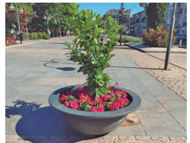
Maceta en la vía pública de Majadahonda