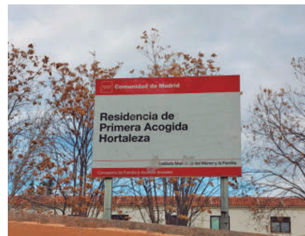
Centro que acoge a menores migrantes

Por otra parte, la Comunidad de Madrid ha presentado ya un total de 16 denuncias contra adultos migrantes que se hacían pasar por menores por un presunto delito de estafa agravada, al haberse beneficiado "indebidamente de recursos públicos de protección".