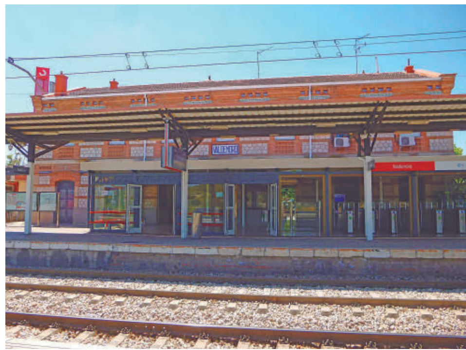
Estación de Cercanías de Valdemoro

nías, Media Distancia y Mercancías, lo que conlleva un nivel de saturación de la línea elevado en ciertas franjas horarias del día y una heterogeneidad de velocidades que dificulta la fiabilidad de la explotación. En el documento se contemplarán todo tipo de