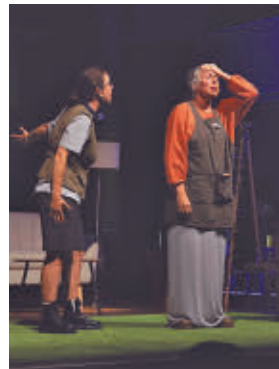
'La casa del mar'

» Sábado 30, 18 horas. Auditorio Joaquín Rodrigo. Precio: 3 euros