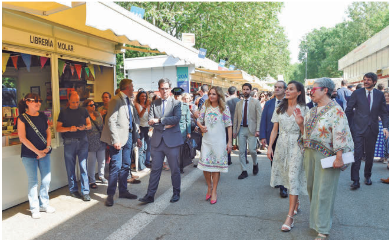
Doña Letizia volverá a inaugurar la feria este viernes 29 de mayo