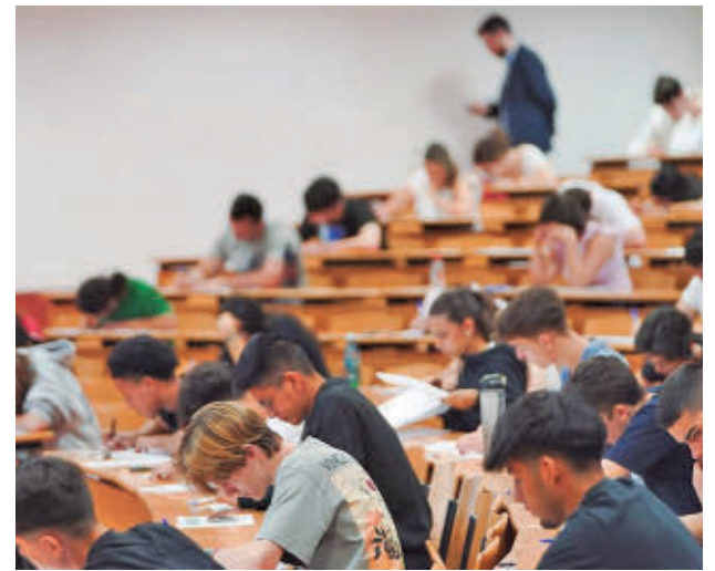
Prueba de Acceso a la Universidad de 2025