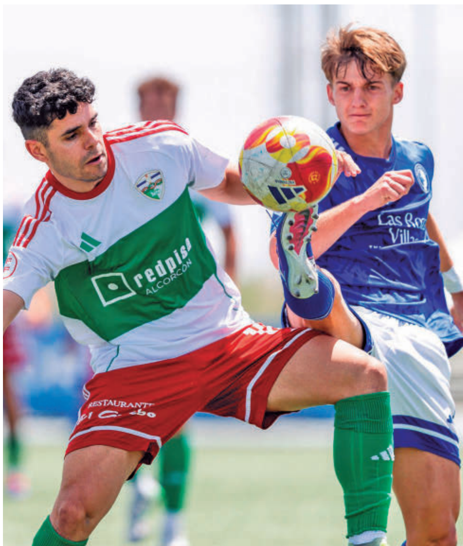
Una acción del partido jugado el 31 de mayo en Navalcarbón TRIVAL VALDERAS

A falta de conocer qué guion dicta esta final regional del 'play-off', ambos equipos encuentran en la estadística motivos para alimentar sus esperanzas. El Trival ha sido el tercer mejor local de la fase regular, con apenas 3 derrotas, además de contar con un