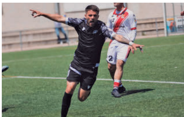
El Rayo Ciudad de Alcobendas, brillante campeón