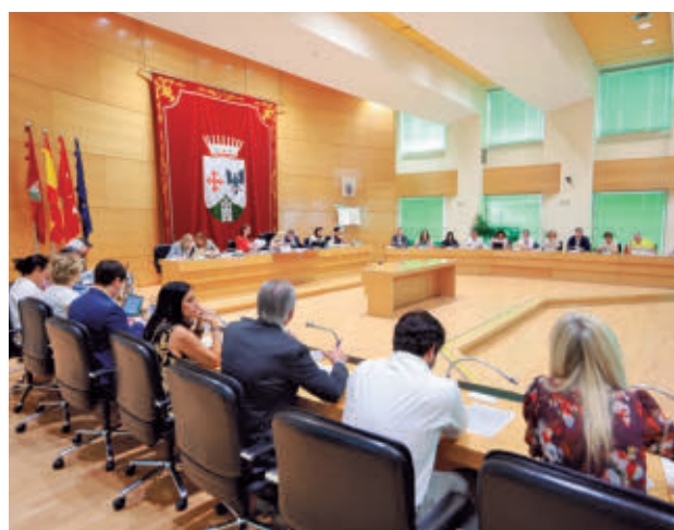
Un momento de la última sesión plenaria