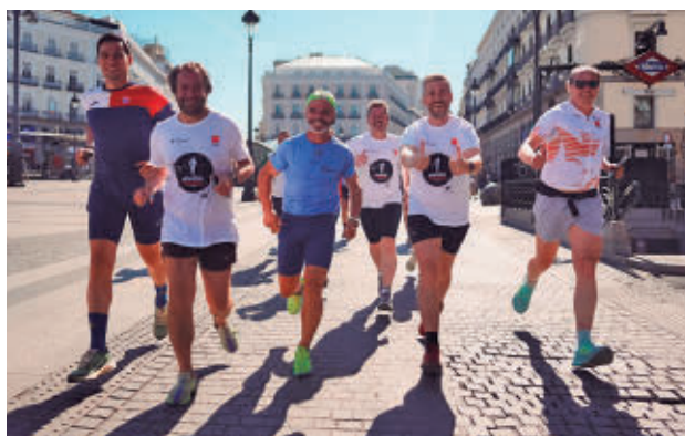
Domínguez recorre los últimos metros en Sol

Este bombero del Ayuntamiento de Madrid explicó que el reto consistía en alcanzar de forma simbólica los 3.953 kilómetros, cifra que representa el número de personas fallecidas por suicidio