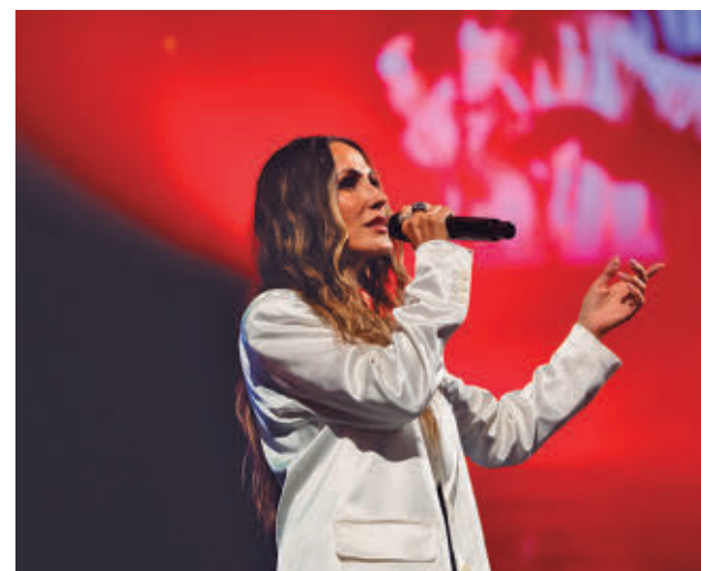
La cantante madrileña está de gira