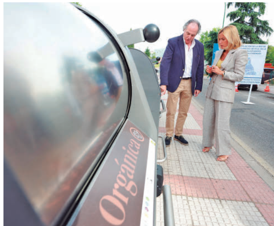
La alcaldesa conoce el funcionamiento de los buzones AYTO DE ALCOBENDAS

EL CONSISTORIO INVIERTE 6,9 MILLONES DE EUROS EN ESTOS TRABAJOS