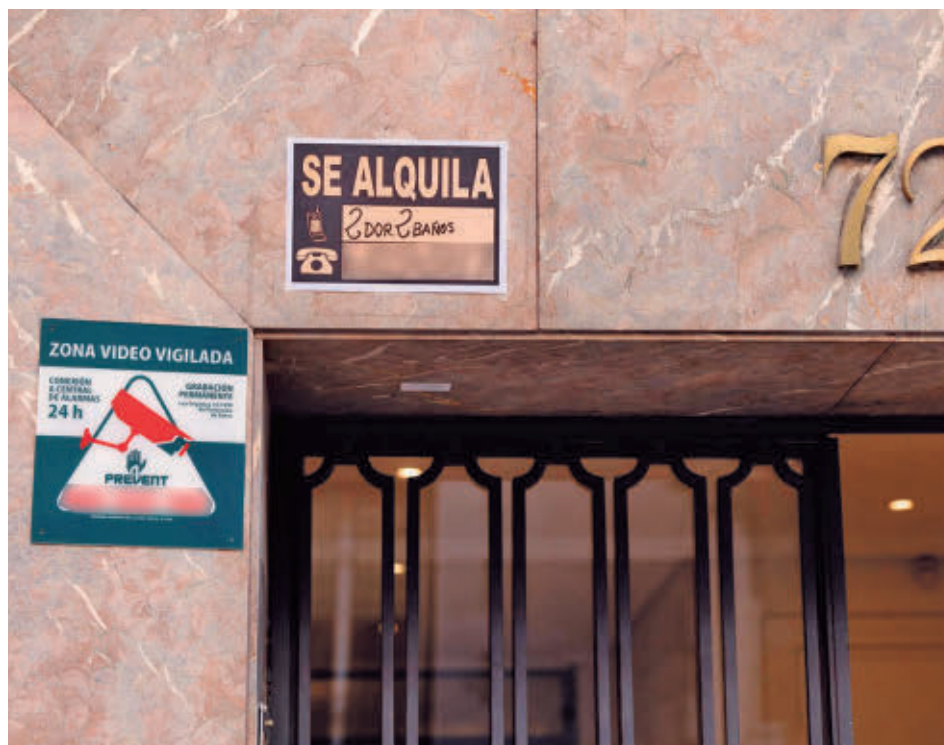
Anuncio de una vivienda de alquiler en Madrid

El precio de la vivienda en alquiler en Madrid cerró el año 2025 con un descenso anual del 1,4% y situó el precio en diciembre en 20,33 euros por metro cuadrado al mes, mientras que el salario bruto medio era de 27.680 euros (2.307 euros brutos