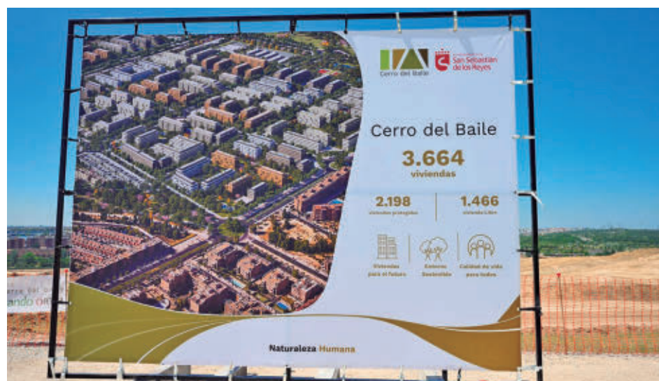
Cartel informativo sobre este desarrollo urbanístico

yecto que busca "satisfacer toda esa demanda residencial de vivienda que tienen los vecinos de San Sebastián de los Reyes", según afirmó la regidora, quien se congratuló de que Cerro del Baile vaya quemando etapas, ya que "los últimos desarrollos que he-