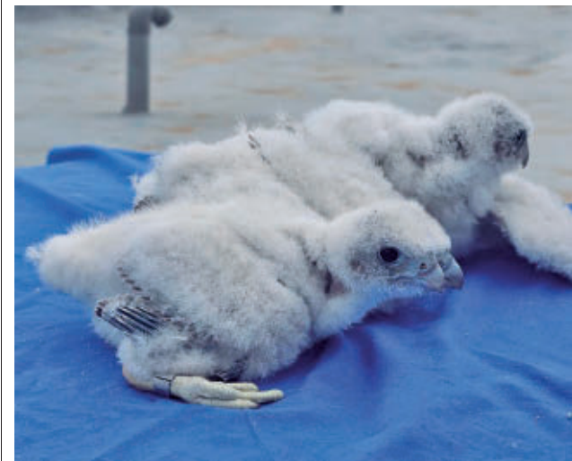
Los tres polluelos de halcón peregrino

Desde que nacieron, los polluelos han estado vigilados para seguir su evolución y ahora empiezan a dar sus primeros pasos y aleteos. Se espera que en breve aprendan a cazar junto a sus padres. Además, se ha instalado una cámara que permite a los biólogos de la Asociación Halcones Urbanos el seguimiento en directo para mejorar la información detallada de la cría.