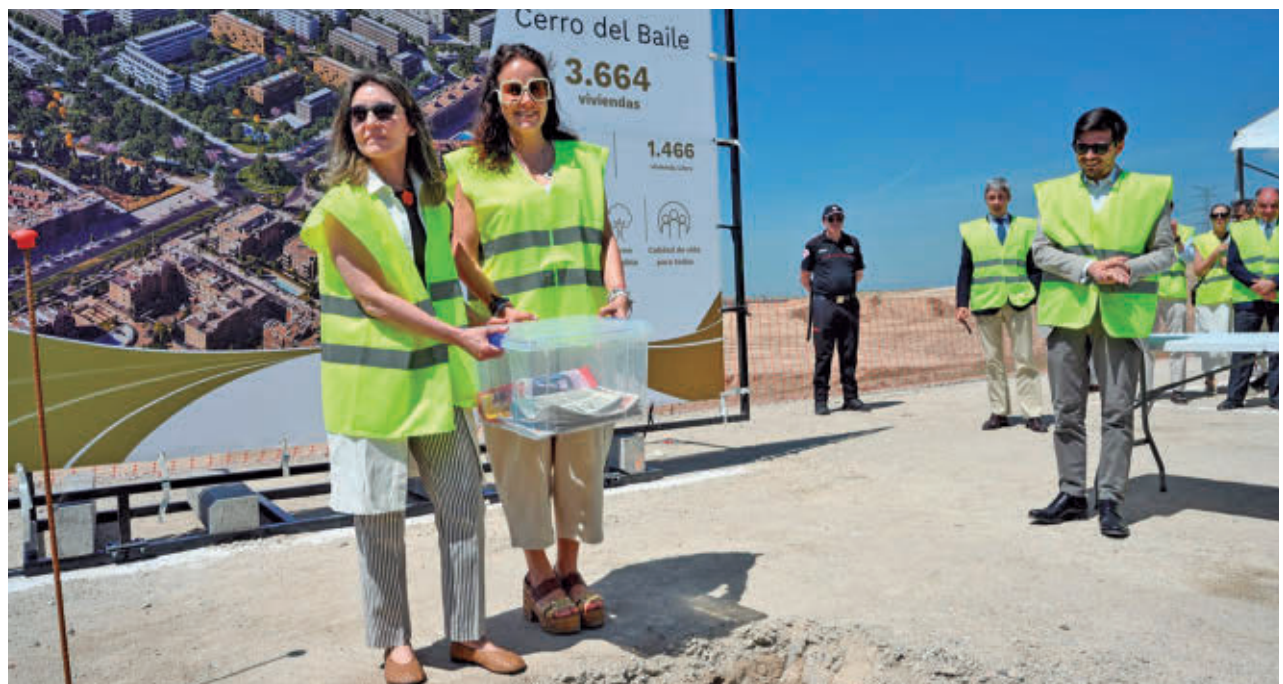
En la puesta de la primera piedra se enterró una cápsula del tiempo AYTO DE SS. REYES

En este sentido insistió en que "los canales oficiales son los que son y, de verdad, pido cautela, que la gente solamente se fie de los canales oficiales. Todo lo demás no podemos garantizarle a nadie que sea cierto o que no lo sea. Cautela y mucha cabeza a la hora de ver qué informaciones compramos como válidas y ciertas".