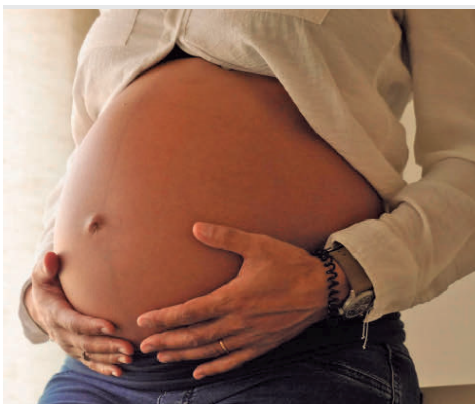
La medida se aplicará desde la certificación del embarazo

Se trata de una medida anunciada por la presidenta regional, Isabel Díaz Ayuso, durante el último Debate del Estado de la Región. El texto será remitido ahora a la Asamblea de Madrid para su tramitación parlamentaria, con la previsión de que pue-