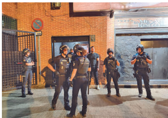
Los agentes, en la puerta de uno de los locales

Al margen de los establecimientos, Policía Local también llevó a cabo una serie de controles en la vía pública en los que se dio el alto a un