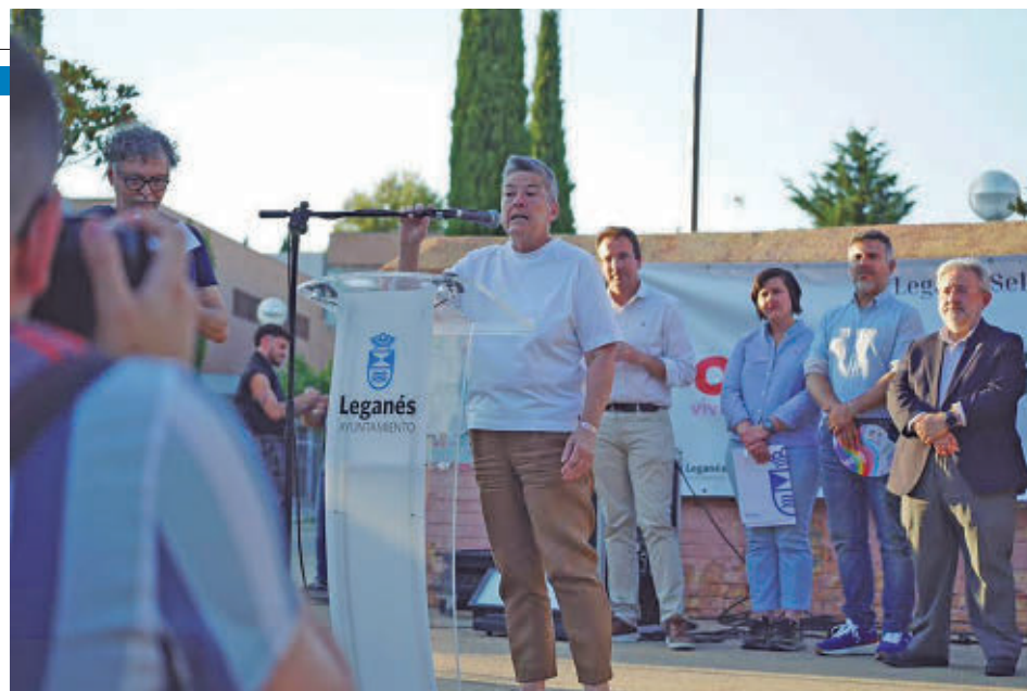
Acto de celebración del Orgullo de Leganés del pasado año