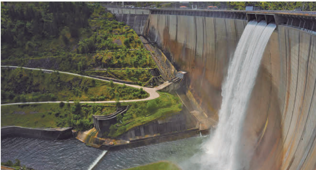
Embalse de El Atazar liberando agua