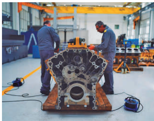
Trabajadores en la Comunidad de Madrid

"Es totalmente falso que vayamos a aplicar un tipo de copago, ningún tipo de reducción de las cuantías de las prestaciones económicas a los pacientes. Las prestaciones de la Comunidad de Madrid se van a abonar íntegramente a todos los pacientes en conformidad con las cuantías establecidas en la propia normativa estatal", recalcó García Martín.