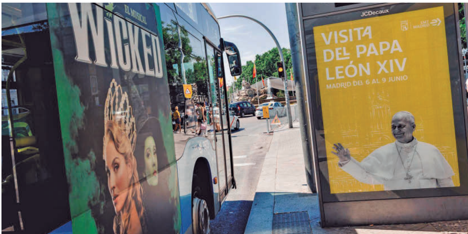
Los autobuses de la EMT serán gratuitos hasta el próximo martes 9 de junio