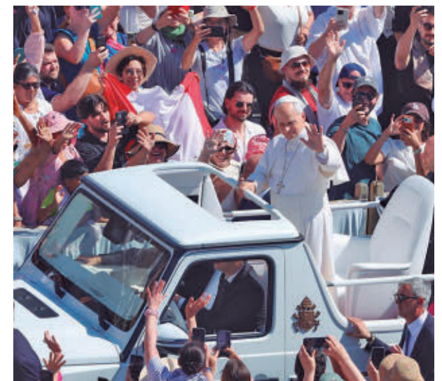
Una multitud de personas estará con el papa E.P.

En el desarrollo de sus funciones, los agentes contarán con 40 cámaras de grabación de alerta temprana de amenazas, 160 arcos de detección de metales, 162 escáneres de seguridad, 302 detectores de metales, 43 inhibidores de frecuencia y 44 equipos de evacuación individual. La Policía no permitirá volar drones en las zonas restringidas sin autorización previa.