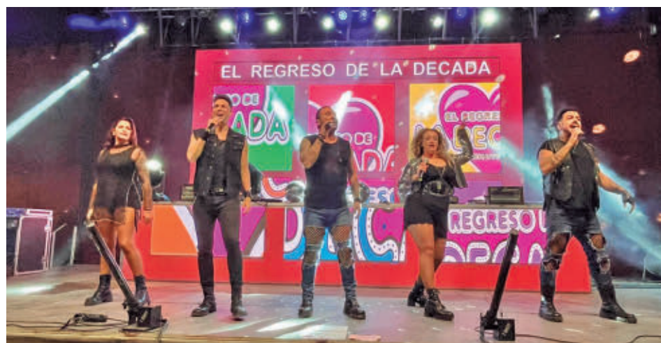
El Regreso de la Década actuará este viernes en la Plaza del Milenio