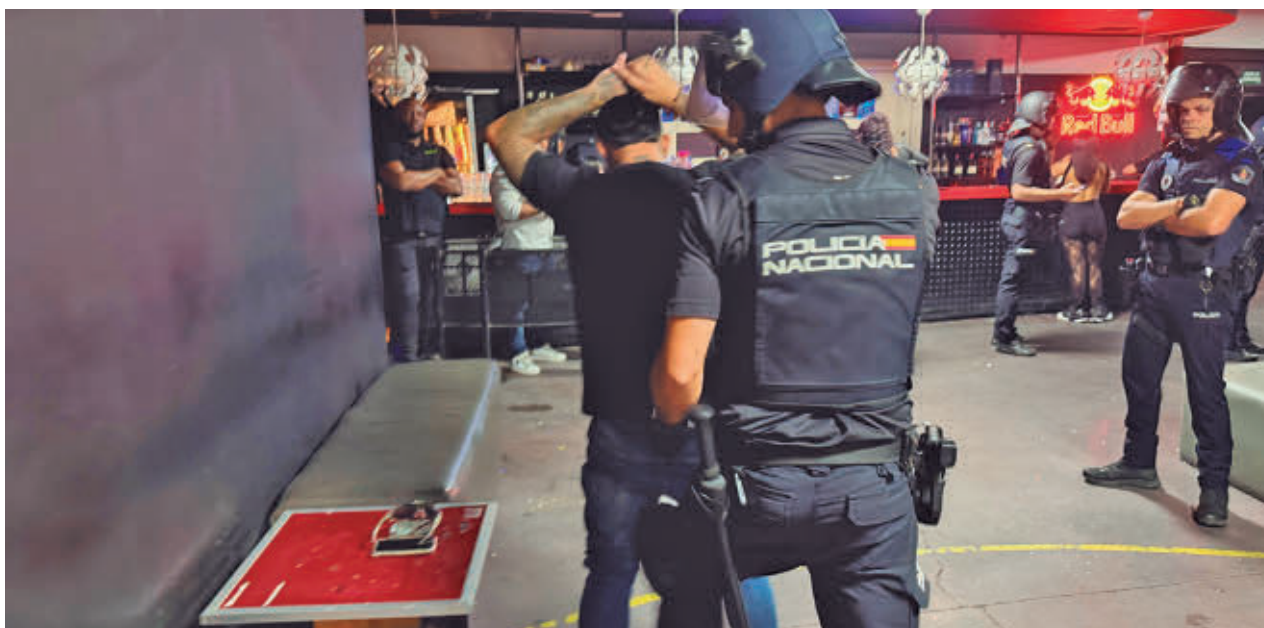
Una de las personas detenidas en la redada del pasado fin de semana