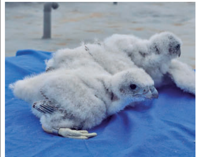
Los tres polluelos de halcón peregrino

Desde que nacieron, los polluelos han estado vigilados para seguir su evolución y ahora empiezan a dar sus primeros pasos y aleteos. Se espera que en breve aprendan a cazar junto a sus padres. Además, se ha instalado una cámara que permite a los biólogos de la Asociación Halcones Urbanos el seguimiento en directo para mejorar la información detallada de la cría.