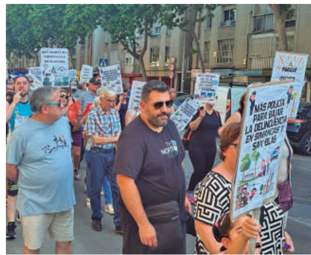
La última protesta vecinal tuvo lugar el 28 de mayo