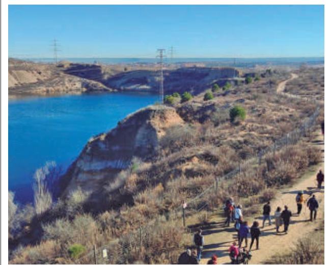
Una de las visitas vecinales a este espacio natural

La FRAVM, que apoyó esta movilización, reclamó una vez más la creación de una mesa tripartita para abordar el problema de una manera integral.