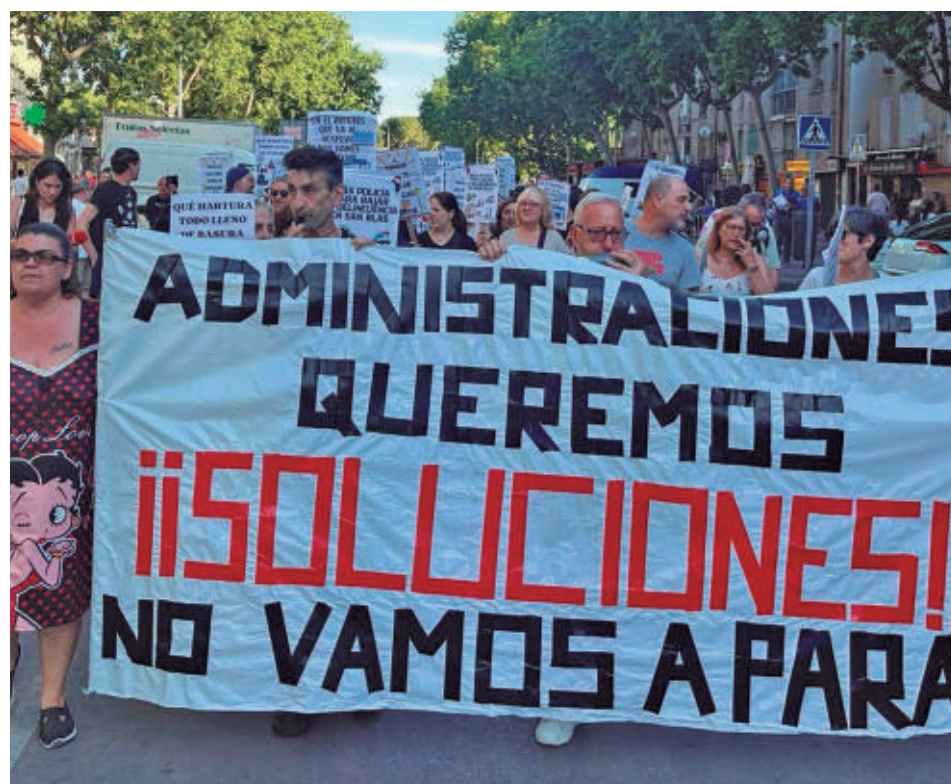
La cabecera de la manifestación vecinal del 28 de mayo

El 50% de las viviendas estará reservado a menores de 35 años y la renta media será de 949,5 euros.