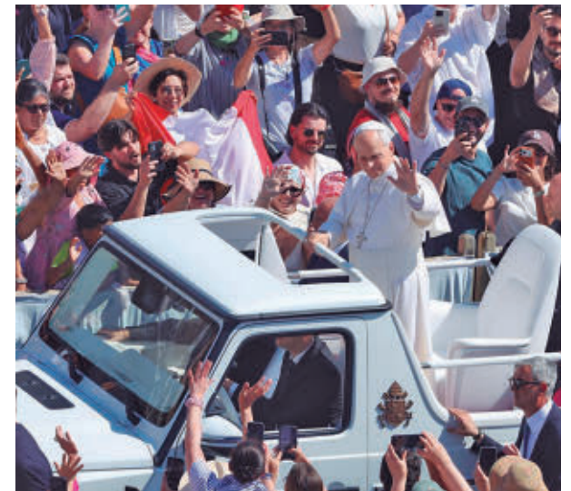
Una multitud de personas estará con el papa E.P.

En el desarrollo de sus funciones, los agentes contarán con 40 cámaras de grabación de alerta temprana de amenazas, 160 arcos de detección de metales, 162 escáneres de seguridad, 302 detectores de metales, 43 inhibidores de frecuencia y 44 equipos de evacuación individual. La Policía no permitirá volar drones en las zonas restringidas sin autorización previa.