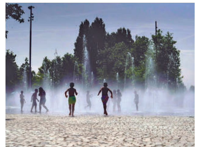
Los chorros de agua de Madrid Río

Por otro lado, en las escuelas infantiles se aplicarán medidas ante las olas de calor y los campamentos municipales de verano, que comenzarán en julio, contarán con protocolos en función de los niveles de riesgo, como suspender la actividad física a partir de las 12 o realizar actividades de agua.