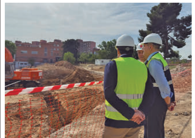
Un momento de la visita del consejero regional

El presidente del Gobierno, Pedro Sánchez, y el ministro de Transportes y Movilidad Sostenible, Óscar Puente, supervisaron el nuevo vestíbulo de la estación.