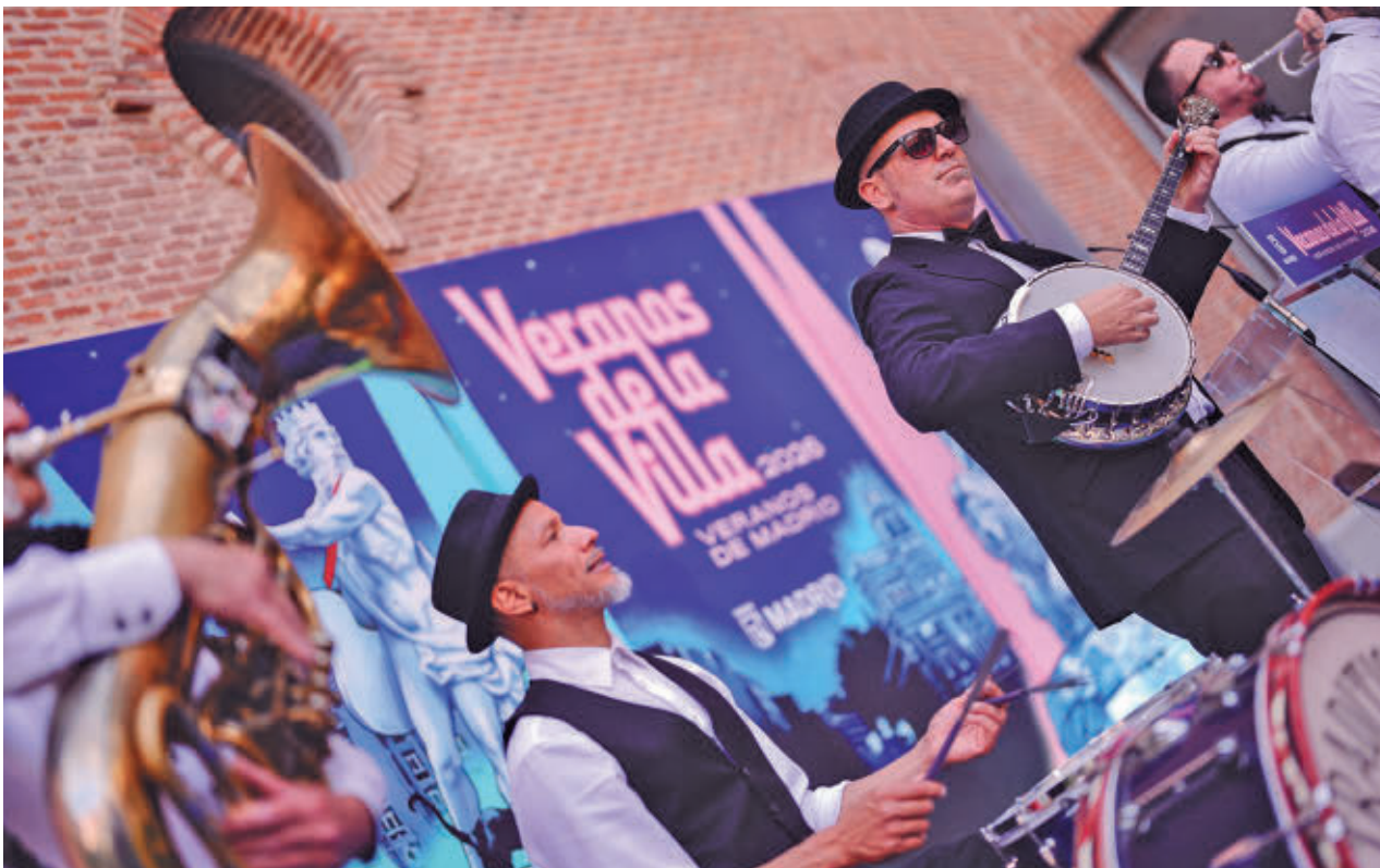
El acto de presentación contó con la actuación de la banda de dixieland Whatever Jazz Band