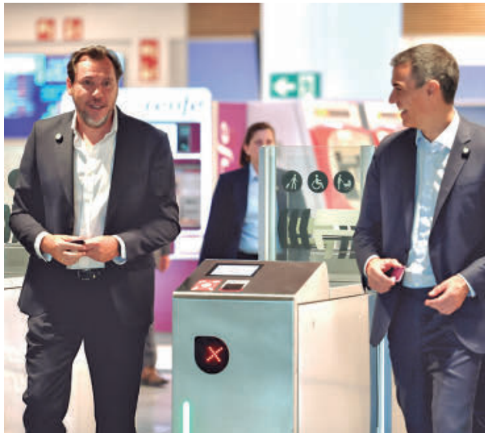
El presidente Pedro Sánchez y el ministro Óscar Puente

Este espacio se divide en tres áreas diferenciadas: una zona de embarque para Cer-