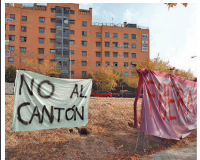
Una de las pancartas de los residentes