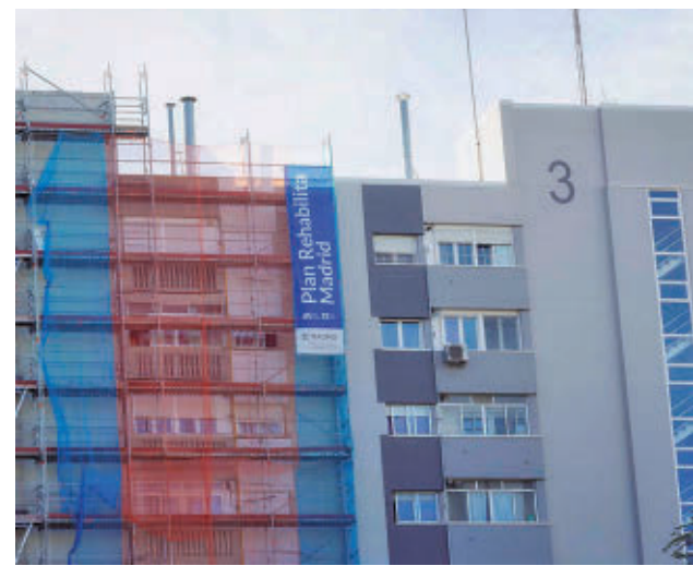
Varios bloques en obras del Poblado Dirigido