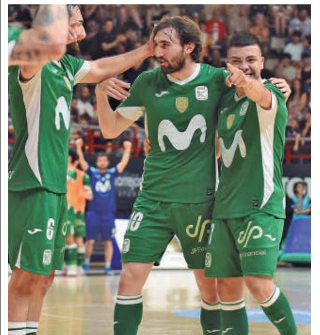
Celebración de uno de los goles del pasado lunes

El ganador disputará el partido decisivo este domingo 7 desde las 19 horas. El año pasado la final la protagonizaron el Real Betis y el Flexicar Fuenlabrada.