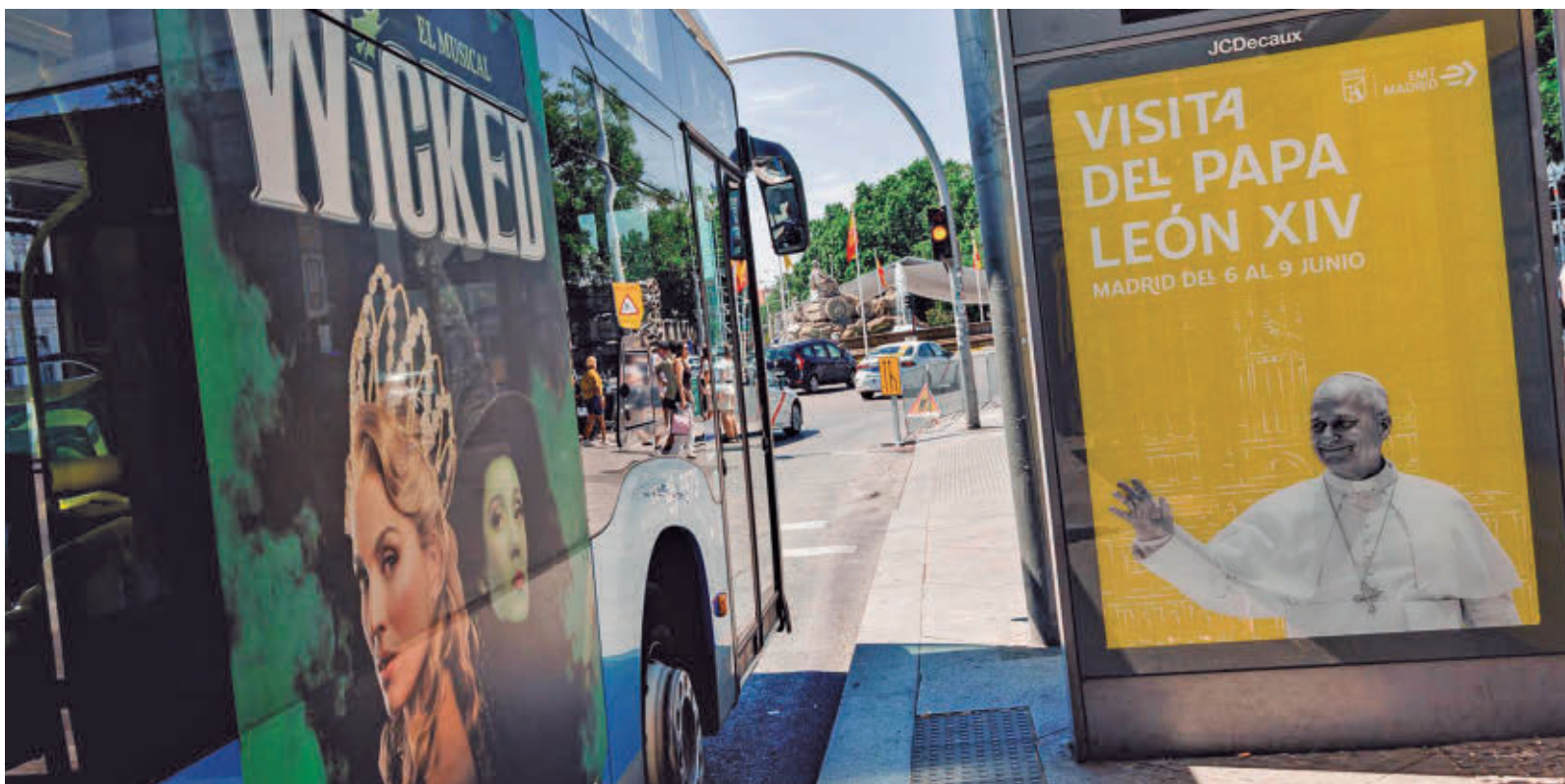
Los autobuses de la EMT serán gratuitos hasta el próximo martes 9 de junio EUROPA PRESS