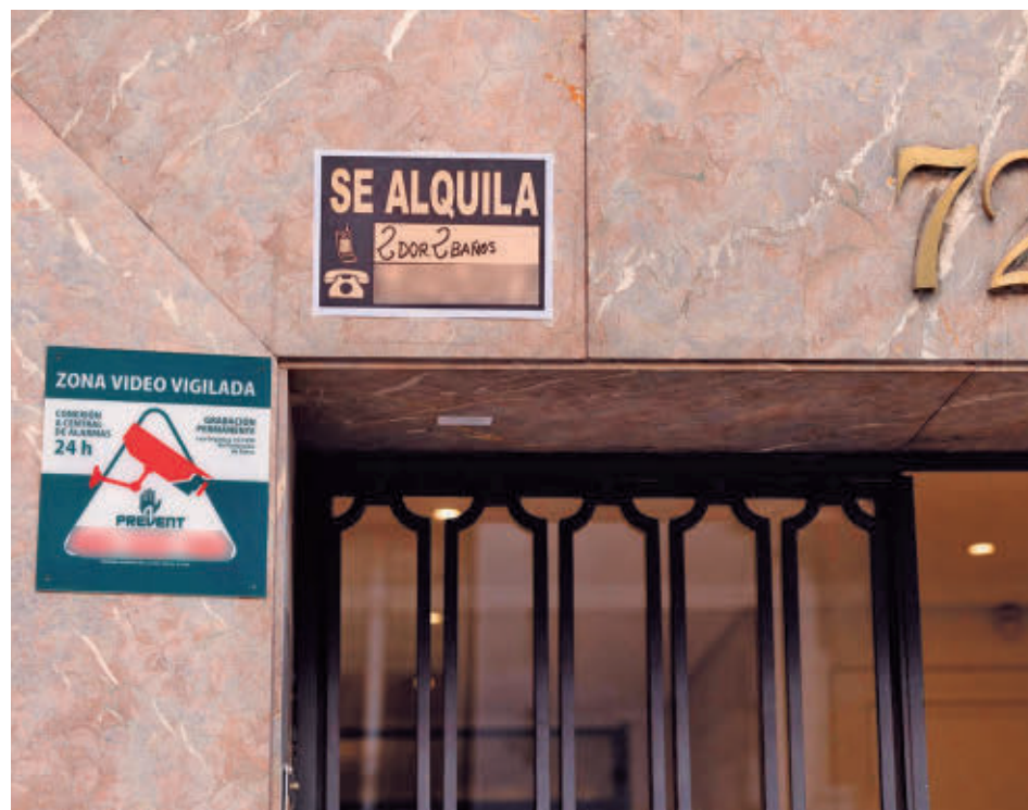
Anuncio de una vivienda de alquiler en Madrid

El precio de la vivienda en alquiler en Madrid cerró el año 2025 con un descenso anual del 1,4% y situó el precio en diciembre en 20,33 euros por metro cuadrado al mes, mientras que el salario bruto medio era de 27.680 euros (2.307 euros brutos