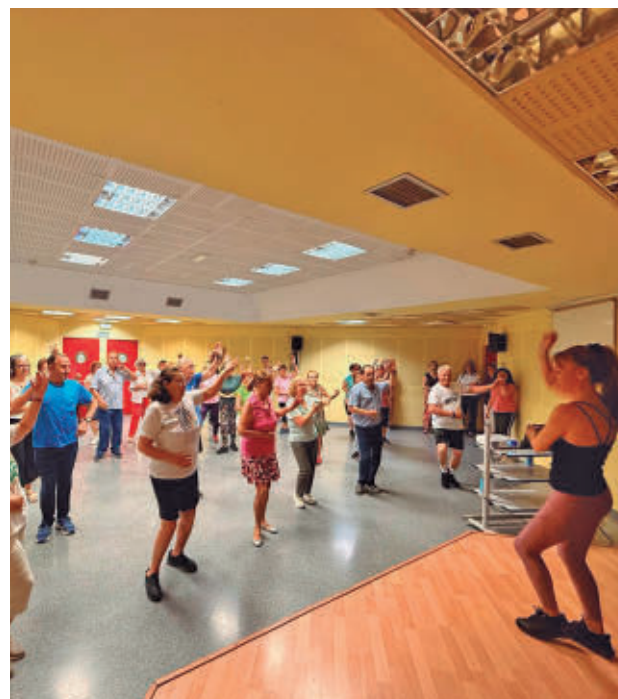
Programa estival para que los mayores se mantengan activos

Marcha, entrenamiento funcional, inglés, estimulación cognitiva, nuevas tecnologías, sevillanas, danza oriental, historia de España, actividad en la piscina, psicomotricidad, marquetaría y cuerpo y mente serán algunas de las actividades que se desarrollarán de lunes a viernes