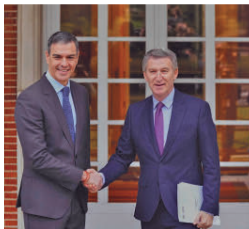
Pedro Sánchez y Alberto Núñez Feijóo

EL PERIÓDICO GENTE NO SE RESPONSABILIZA NI SE IDENTIFICA CON LAS OPINIONES QUE SUS LECTORES Y COLABORADORES EXPONGAN EN SUS CARTAS Y ARTÍCULOS