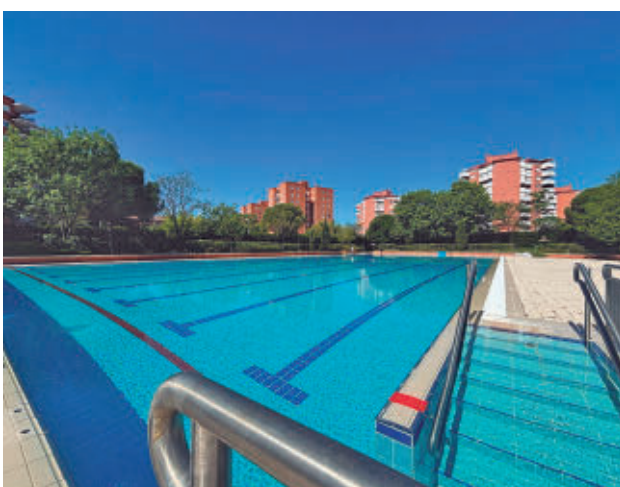
El Ayuntamiento ofrece descuentos con la Tarjeta Deporte

"Los datos de empleo del mes de mayo confirman que Móstoles avanza en una buena dirección, creando empleo de calidad y apoyando a las empresas y el emprendimiento locales. Además, quiero destacar especialmente la mejora del empleo femenino. Seguiremos trabajando para que la tendencia positiva se consolide y sigamos generando nuevas oportunidades laborales", señaló el alcalde, Manuel Bautista.