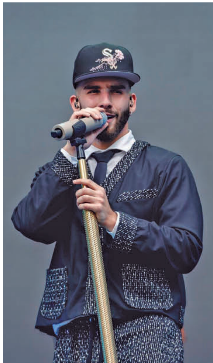
Manuel Turizo encabeza el cartel de este festival veraniego

Móstoles organiza el festival los días 20, 21, 27 y 28 de junio en el polideportivo municipal Andrés Torrejón • Fiesta Bresh, el estilo pop-rock con Macaco y ritmos latinos con Tito Nieves