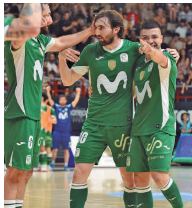
Celebración de uno de los goles del pasado lunes

El ganador disputará el partido decisivo este domingo 7 desde las 19 horas. El año pasado la final la protagonizaron el Real Betis y el Flexicar Fuenlabrada.