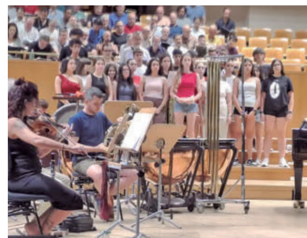
Alumnos mostoleños y músicos profesionales de la OCNE

Los alumnos han podido crear una pieza musical con músicos profesionales de la OCNE que interpretarán en el Auditorio Nacional el próximo 8 de junio.