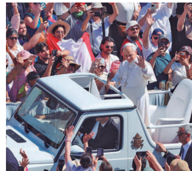
Una multitud de personas estará con el papa E.P.

En el desarrollo de sus funciones, los agentes contarán con 40 cámaras de grabación de alerta temprana de amenazas, 160 arcos de detección de metales, 162 escáneres de seguridad, 302 detectores de metales, 43 inhibidores de frecuencia y 44 equipos de evacuación individual. La Policía no permitirá volar drones en las zonas restringidas sin autorización previa.