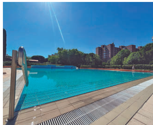
Habrán descuentos para empadronados