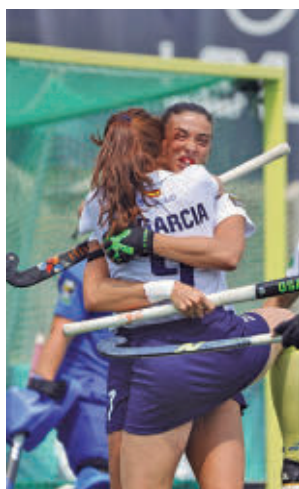
Triunfo claro ante el Terrassa

bieron el pasado fin de semana una nueva página en su palmarés con un único nombre: Real Club de Campo. En el campeonato masculi-