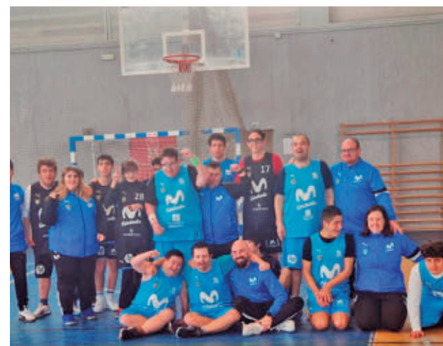
El Ciudad de Móstoles Estudiantes Amás Tigres

Después del título de Liga logrado por los Tigres, otro equipo del Ciudad de Móstoles Estudiantes Amás, los Halcones, puede lograr un nuevo título, ya que se enfrentará al Cetelem Down Madrid Estudiantes el próximo 13 de junio en la final de la Copa FEMADDI en categorías Plata B y Bronce B, respectivamente.