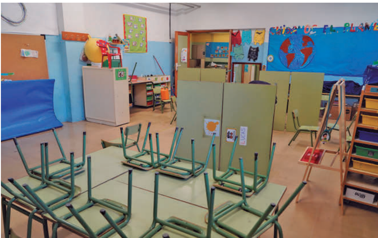
Las AMPAS insisten en que la prioridad debe ser garantizar unas condiciones térmicas adecuadas para alumnos y docentes